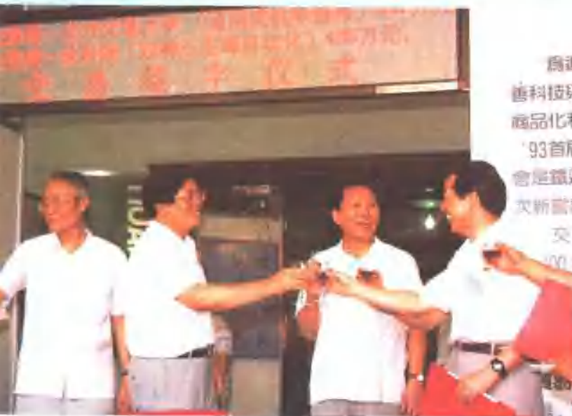
为通 善科技研 商品化科 '93首届 会是铁建 次新就 交