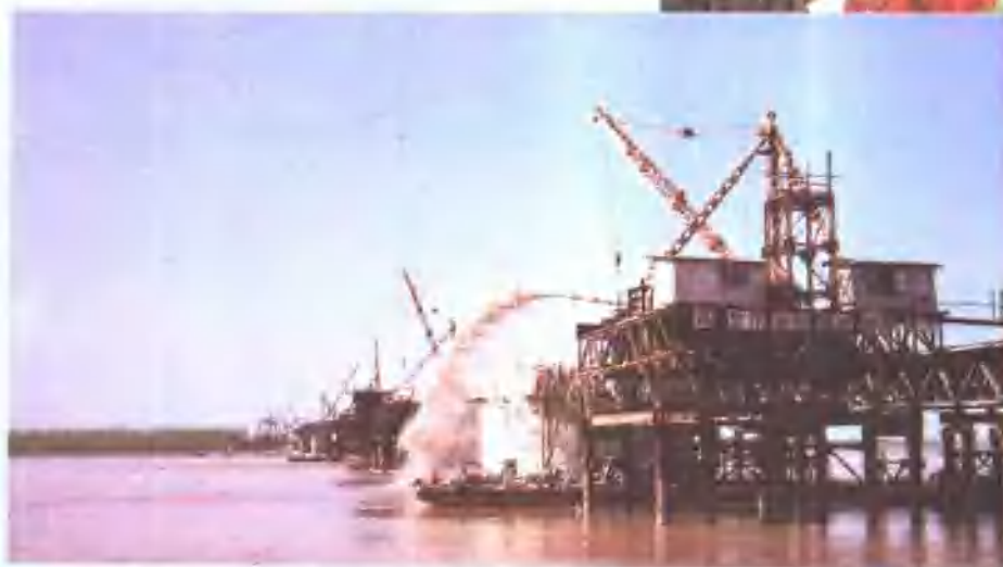
△京九线孙口黄河特大桥主桥沉井正在施工。