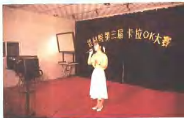
△铁科院第三届卡拉OK大赛于5月22日在文化宫举行。中国音乐家协会副主席时乐蒙等著名人士亲临指导。（左图） 院工会