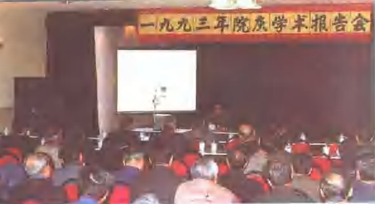
△一九九三年三月二日，铁科院召开“一九九三年院庆学术论文报告会”。