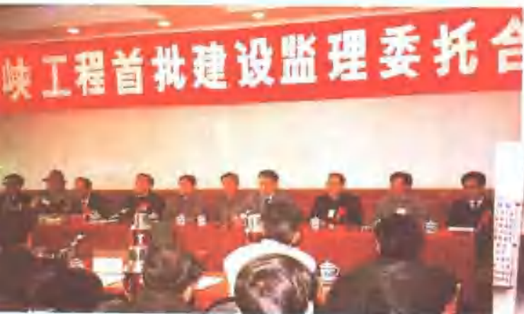
△1993年12月24日，中国长江三峡工程开发总公司举行合同签字仪式。铁科院承担了“西陵长江大桥”的建设监理。