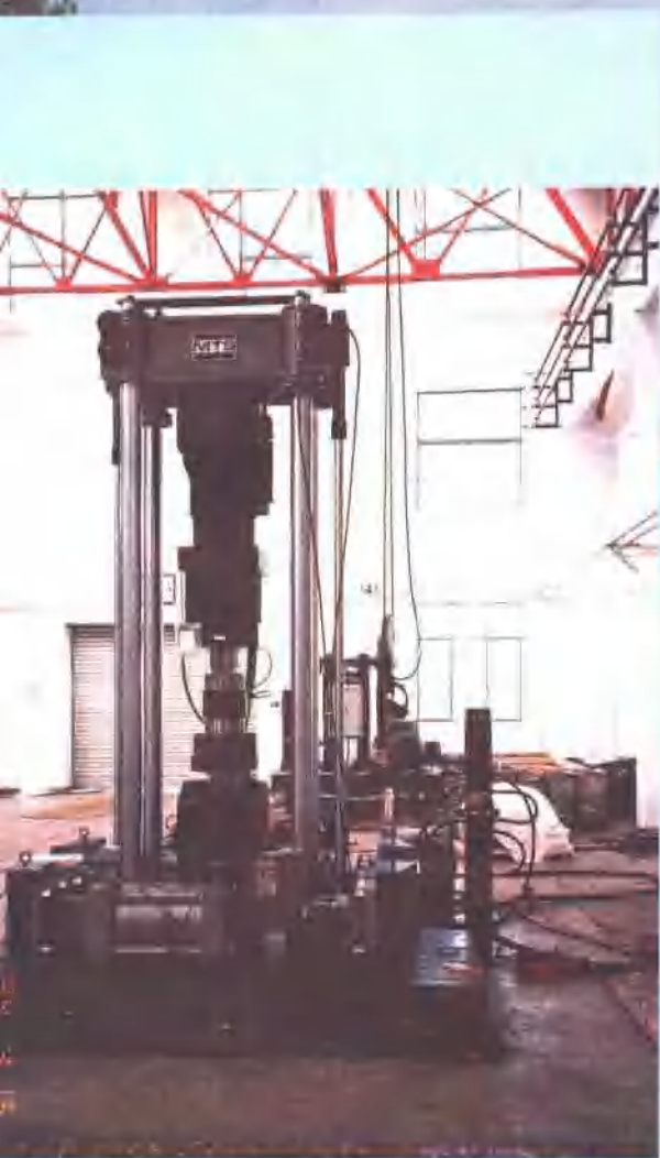
△轨道动力学试验室外景纵观。