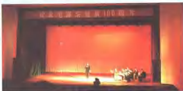
△纪念毛泽东诞辰100周年文艺演出在铁研文化宫举行。上图为演出会场。