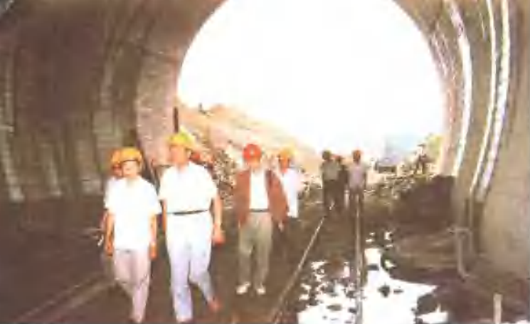
△8月27日至9月1日，院长伊熙祖、党委书记蓝务昂等赴京九铁路阜九段现场办公。并视察铁科院负责监理的孟良山隧道。