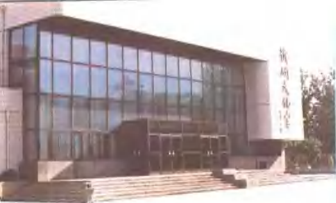
△“铁研文化宫”外景。