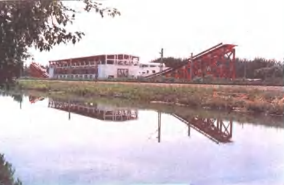
△一九九三年十二月完成机械设备安装的铁科院轨道动力学试验室外观。