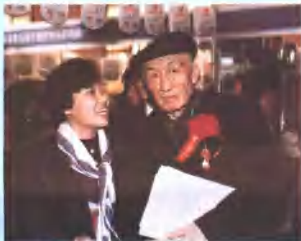
△1993年11月29日，在“中国青年科技成果博览会”上，中国科协主席朱光亚参观铁科院展台时，听取铁科院团委书记于湘介绍情况。