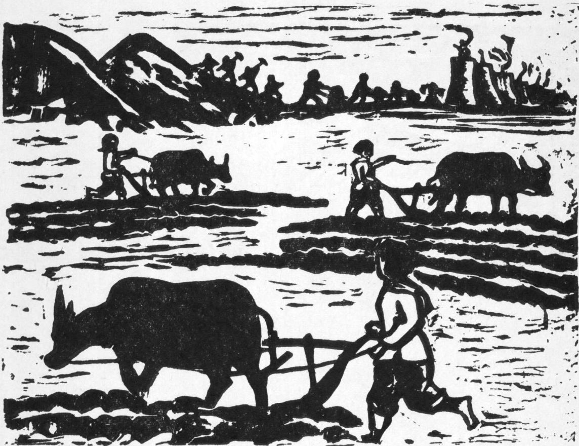
4. 深 耕 邓堯俊作