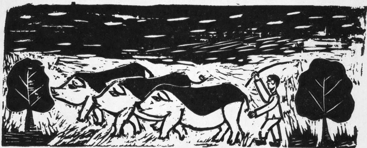
3. 把猪赶到食品公司