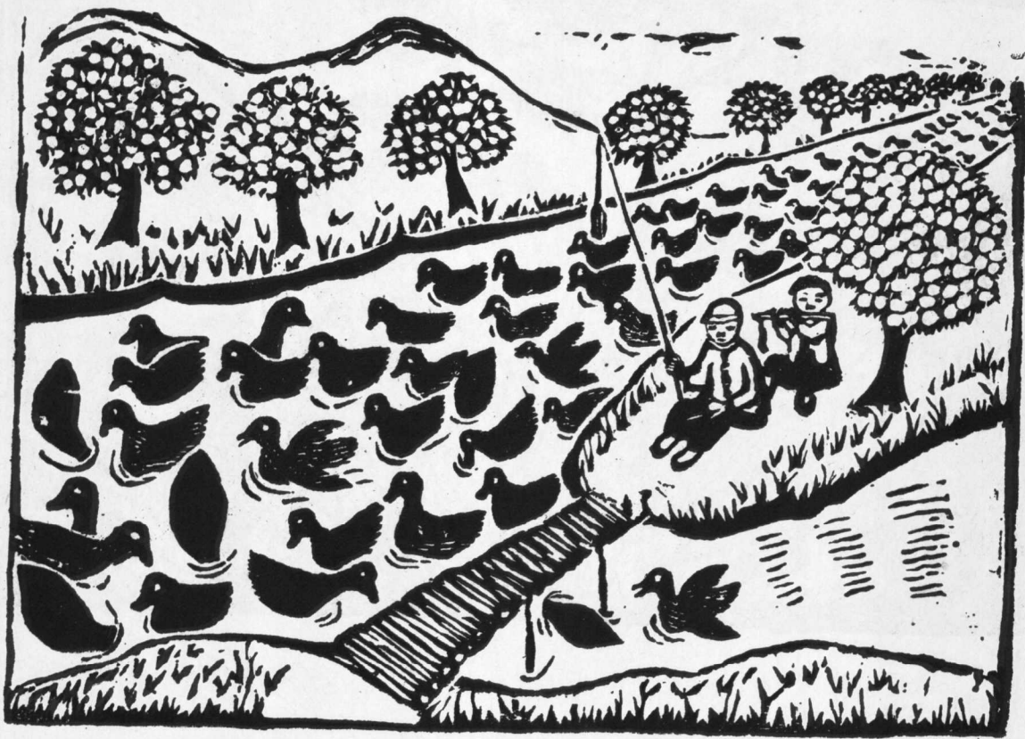
9. 鴨 羣 江池先作