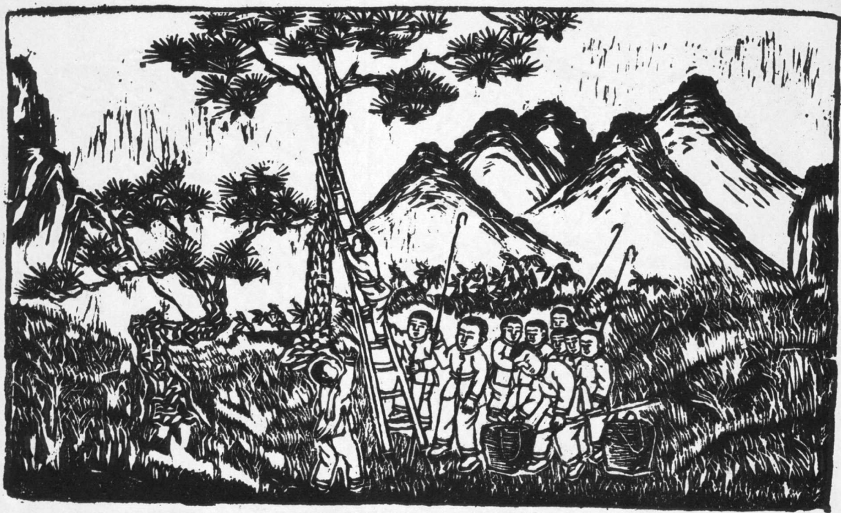
10. 采 松 种 江池先作