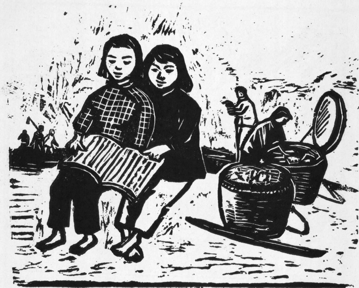
7.文化到田头 邓增勳作