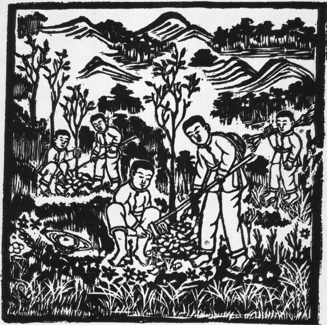
11. 种 菓 树 江池先作