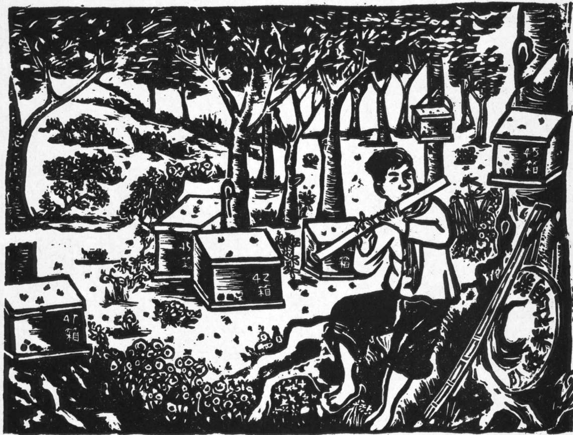
5. 养 蜂 邓堯俊作