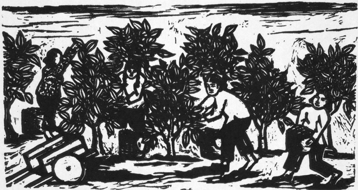
6. 采 茶 邓堯俊作