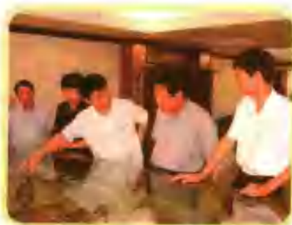
自治区副主席穆虹（右三）陪同国务院副秘书长（国家发改委原副主任）张平（右二）考察项目建设