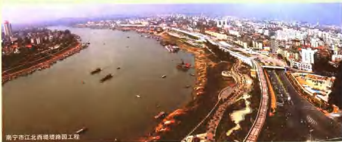
南宁市江西北堤堤路园工程