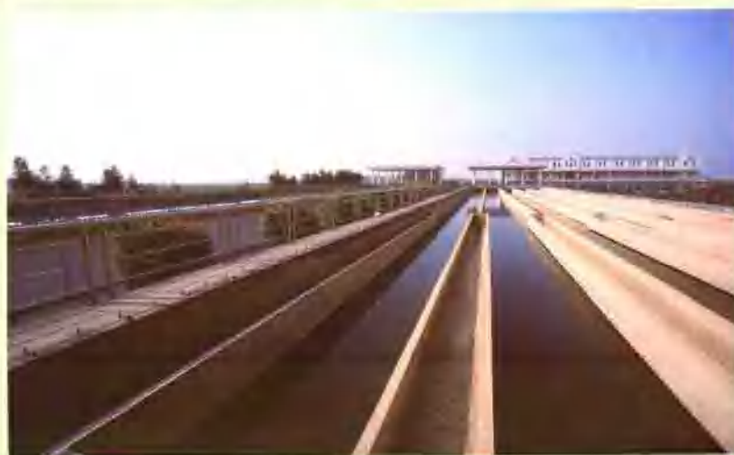
贵港市旧城区供水管网改造工程