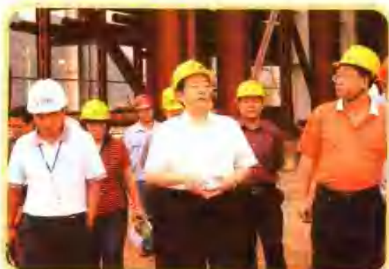
自治区党委副书记、常务副主席郭声琨（中）检查指导重大项目建设