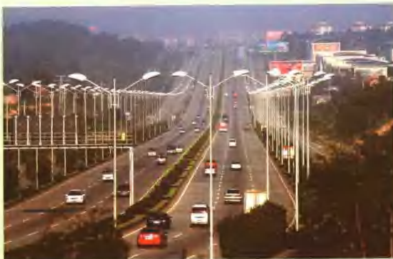
南宁市快速环道项目