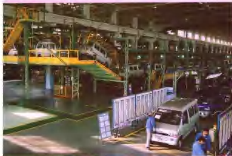
上汽通用五菱汽车股份有限公司微型客车技改工程

“十五”时期，广西汽车和机械制造、钢铁、建材、化工、制糖、烟草、食品等传统优势行业技术改造步伐进一步加快，结构调整取得新成效，产业竞争力逐步提高，涌现出了一批产品质量和效益大幅提升的大企业、大集团。“十五”期间，钢材生产能力新增300万吨，2005年达到500万吨；汽车生产能力新增20万辆，2005年达到35万辆。广西充分发挥资源优势和区位优势，积极推进有色金属工业、林浆纸一体化项目、医药等产业项目建设，为形成广西新的支柱和优势产业，实现资源优势向产业优势、经济优势转变打下基础。积极推进了一批起步早、区位和特点突出、已具有一定规模及管理水平较高的重点园区基础设施建设，建成了广西现代农业科技示范园、北海银河高科技产业股份公司软件园等项目。开工建设了桂林高新技术产业开发区科技园及铁山园、梧州工业园、柳州阳和工业新市区基础设施建设等项目。建成投产了北海银河精密片式电阻和精密片式电阻网络工程。广西水牛奶业（繁育体系）产业化开发项目、广西互联网二期工程等项目。开工建设了恒基伟业科技园二期工程、德意中间件软件及示范工程、中软桂林软件与服务出口基地一期工程等项目。