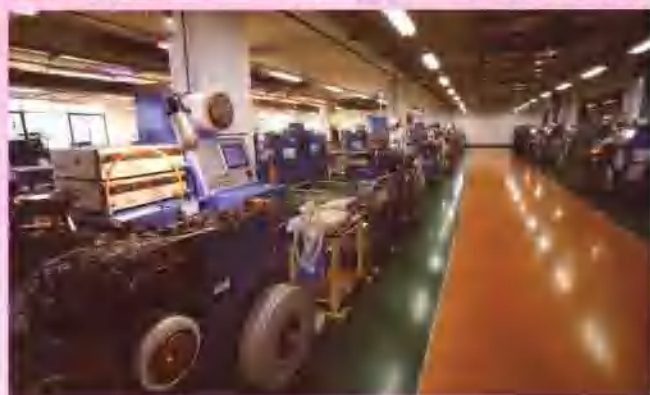
北海银河精密片式电阻和精密片式电阻网络工程