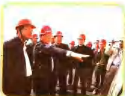
国家发改委副主任、国务院西部开发办副主任王金祥在广西考察项目建设