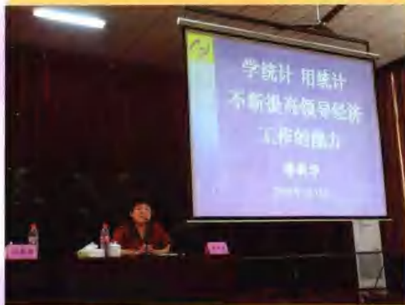
2006年7月19日,自治区统计局局长廖新华为柳州市四套班子领导、各县区、各部委办局一把手参加的培训班讲授了《学统计,用统计,不断提高领导经济工作的能力》专题,受到领导干部的欢迎