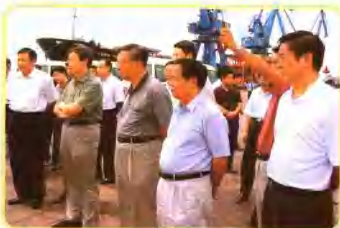
自治区党委书记刘奇葆（右一）、自治区主席陆兵（右二）、副主席杨道喜（左一）等陪同国家发改委主任马凯（左二）、副主任张国宝（右三）考察重大项目建设

“十五”时期，在自治区党委、政府的正确领导下，广西认真贯彻落实科学发展观和国家一系列方针政策，坚定不移地以经济建设为中心，全面实施“三大战略、六大突破”决策，把推进重大项目建设作为加快广西经济发展的重要战略任务，切实加强领导，精心组织协调，积极探索项目建设规律，创新项目建设机制，集中力量统筹推进重大项目建设，呈现出“开工一批、续建一批、投产一批、储备一批”的良好态势，对扩大投资规模、促进经济社会快速发展起到了重要的支撑作用，为胜利实现经济发展“三突破”、“双过半”目标，全面完成“十五”计划目标任务和“十一五”的快速发展奠定了坚实基础。五年来，广西围绕产业开发、基础设施、生态环保的公共服务等领域，共实施重大项目578项，完成投资1710亿元，占“十五”全区全社会固定资产投资完成额的30%，共建成投产重大项目259项，成为广西历史上重大项目建设数量最多、投资规模最大、取得成效最显著的时期。一大批重大项目的开工建成，使我区交通、能源、水利等基础设施进一步加强，极大改善了经济发展环境；汽车、机械、制糖、钢铁、建材等传统优势产业结构调整步伐加快，强优企业不断壮大，竞争力较大幅度提升，产业整体素质不断提高；铝、林浆纸一体化、锰业等新的优势产业初步形成；文化、教育、卫生公共服务项目的建成，促进了社会全面进步；边境基础设施建设大会战、东巴凤基础设施建设大会战的胜利告捷，极大改善了边境地区和革命老区人民群众生产生活条件；沿海基础设施建设大会战的扎实推进，为临海工业布局奠定了基础；钢铁、石化、核电等一大批关系发展全局的重大项目前期工作取得突破性进展。