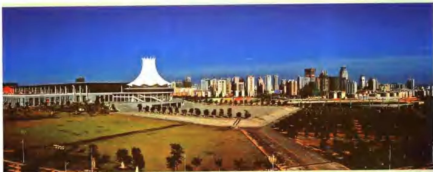
南宁国际会展中心

“十五”时期，广西城市焕然一新。建成了南宁江北西堤堤路园工程、南宁吴圩机场高速路、柳州市内环路以及一批县城道路、供水、垃圾处理等基础设施项目，开工建设了中国—东盟经济园基础设施、东盟各国联络基地基础设施、南宁大桥、柳州市西南、西北进出城道路、桂林东二环路、梧州地质灾害整治、玉林污水处理厂等项目。“十五”时期，广西县以上城市日供水能力新增 138 万吨，2005 年达到 551 万吨；城市日处理垃圾能力新增 2150 吨，2005 年达到 3750 吨；城市日处理污水能力新增 30.4 万吨，2005 年达到 61 万吨。