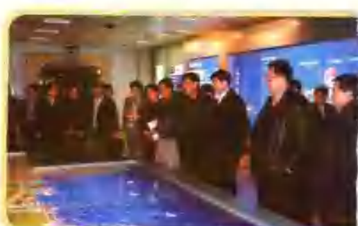
国家发改委原副主任、国务院西部开发办原副主任李子彬（右三）参观广西规划展示