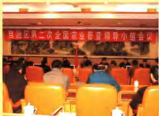
2006年3月14日,广西第二次全国农业普查领导小组第一次会议在南宁召开,全区第二次全国农业普查领导小组成员共20多人参加了会议,自治区人民政府第二次农业普查领导小组组长、自治区副主席孙瑜,自治区人民政府第二次农业普查领导小组副组长、自治区统计局局长廖新华到会并做了重要讲话