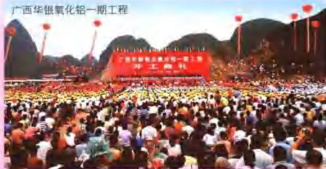
广西华银氧化铝一期工程