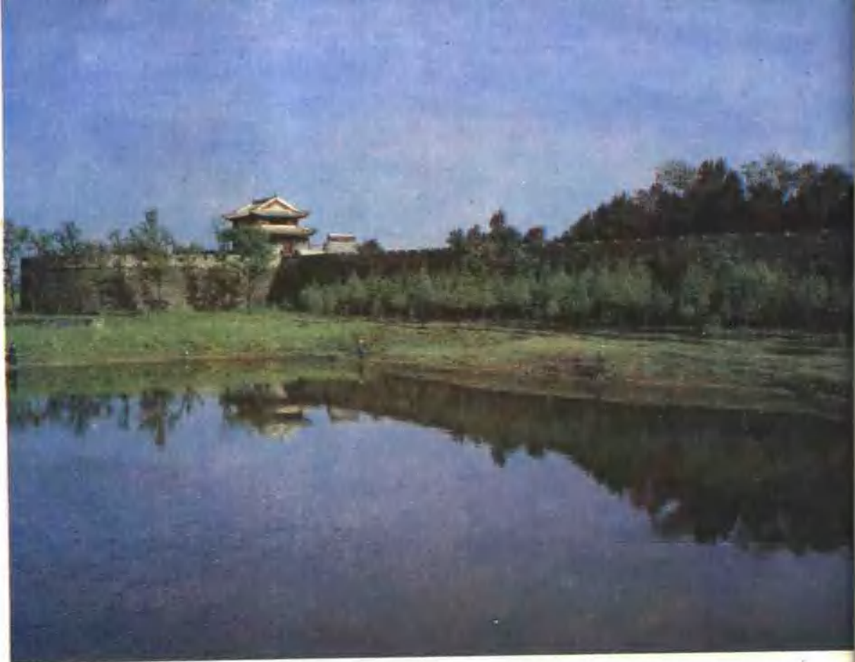
荆州古城（上） 江陵水乡一瞥（下）