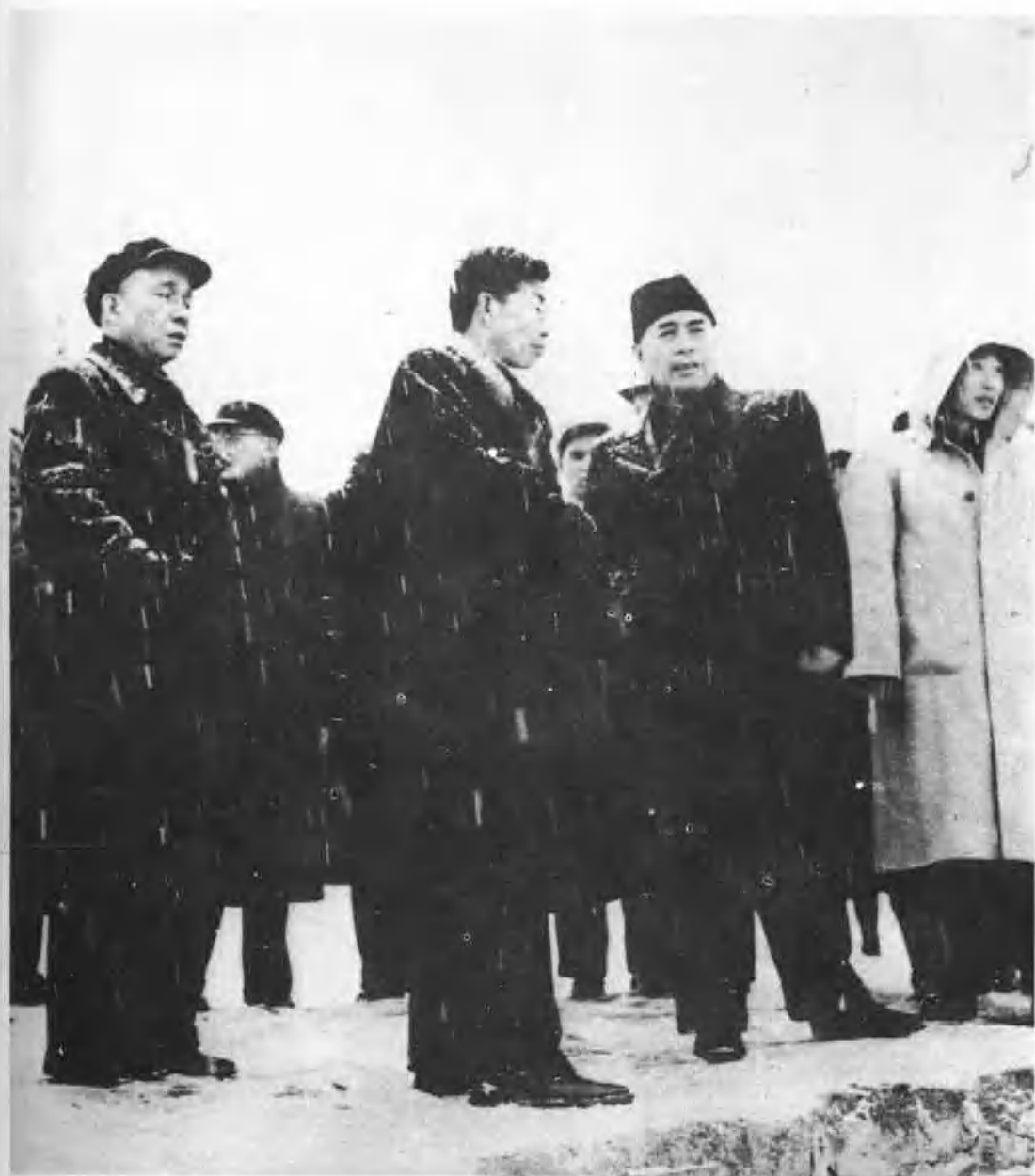
一九五八年二月周恩来同志和李富春、李先念同志在王任重、林一山同志陪同下视察荆江大堤。