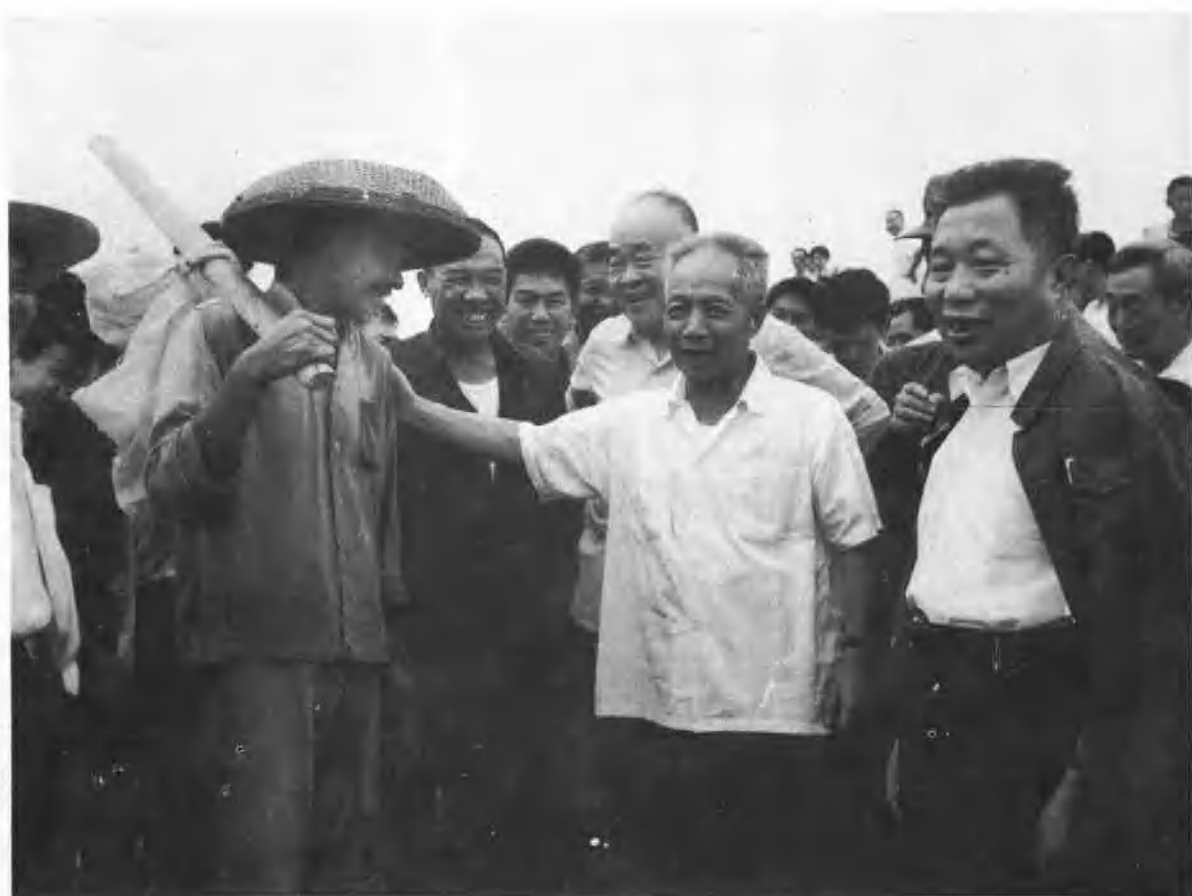
一九八〇年八月二十三日中共湖北省委书记 陈丕显、省长韩宁夫、副省长黄知真亲临长湖防 汛前线检查防汛、慰问灾民。