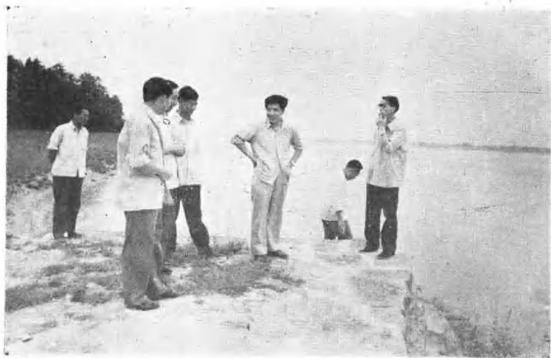
中共湖北省委书记关广富，在湖北省水利厅厅长童仁辉、荆州行署副专员徐林茂陪同下，检查荆江大堤郝穴铁牛矶险段。