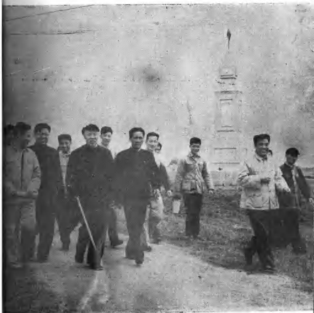
1965年5月，中华人民共和国副主席董必武在张体学、饒民太等同志陪同下，视察荆江分洪工程和荆江大堤。