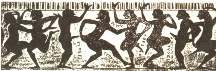
古希腊花瓶画《快乐的希腊人》

性关系。在他们看来，这是一种十分快乐、十分荣耀的事。而且，当时的希腊民众也不反对男人公开与男童发生关系，因为恋慕男童是这个国家的风俗。人们都很开放，如果主人正在与妻子交合取乐，有人要见他，大家会认真地告诉客人说：“他正忙于他个人的幸福的事呢！”同时还直言不讳地道出主人各种猥亵的做爱动作。当时，这样的做法是常见的，他们不认为这是什么伤风败俗的事，并不觉得羞耻。