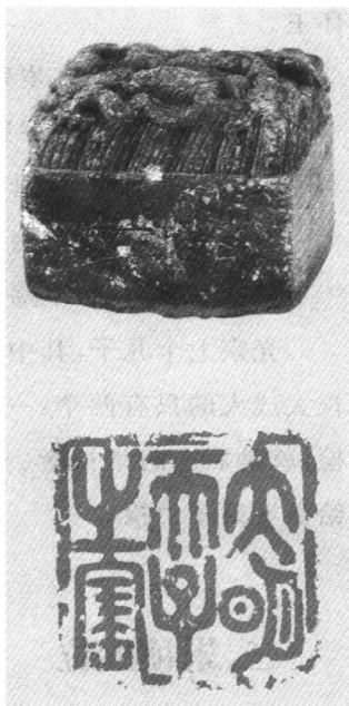
白石“大明天子之宝”