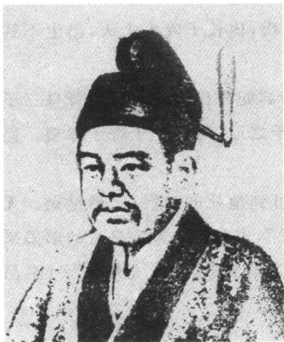
崇祯皇帝像（清人绘）

崇祯皇帝，名由检，生于万历三十八年十二月二十四日（1611年2月7日）。他比长兄由校（天启帝）小5岁。朱由检的生母刘氏，初入太子宫时是淑女（低于才人、选侍），生朱由检后不久，失宠被谴，郁闷而死，才23岁。太子朱常洛怕父皇（万历帝）知道，告诫