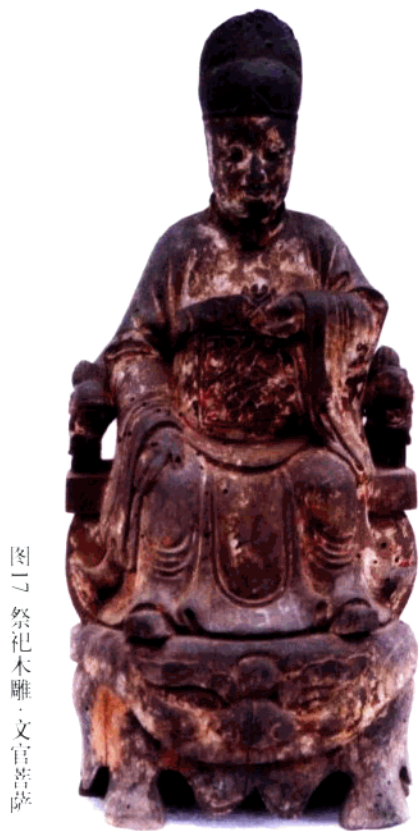
图2 祭祀木雕·文官菩薩

子、檐椽下边象征神水以避为殃的鳌鱼雀替，还有门窗边饰中常见的云纹、水纹、拐子龙纹等等，无不充溢着浓厚的楚巫文化色彩。嘉禾县唐村民居门楣上方有一件镂空透雕，呈两兽戏球之状，两兽似虎、似狮、似麒麟，其动势激烈，穿插回环往处复的云纹，其造型、气势与两千多年前楚汉艺术中的纹饰一脉相承，宜章芭蕉乡民居有“凤凰来仪”、“鱼龙变幻”等雕花木板，画面结构绵密、云彩与树木交织飞动，与楚汉帛画、漆器中所表达的神秘、浪漫气氛有着异曲同工的效果。