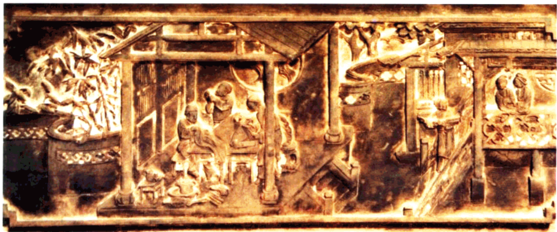
图23 带有浓郁乡土气息的木雕组画之一、“女红图”。

箭”为例，这是一段家喻户晓的“三国”故事，偌大一个战争场面，在一块小小的木板上表现得活灵活现，三个士兵开弓射箭代表了千军万马，诸葛亮与鲁肃端坐船头，略貌取神，船上旌旗招展，侍从悠闲不乱，都被十分简洁概括的手段表现出来。常见的“刀马人”木雕花板，往往都是三骑战马作“品”字形组合成一幅征战画面。由于穿插得体，却能以小代全，同样表现出金戈铁马的鏖战气氛，而湖南民居梁柱上的下山狮子斜撑，其动势生猛，用刀简洁，造型十分概括。以上表现手法，可谓实中见虚、虚中见实，虚实相生，意到刀不到，取得了以少胜多的艺术效果。