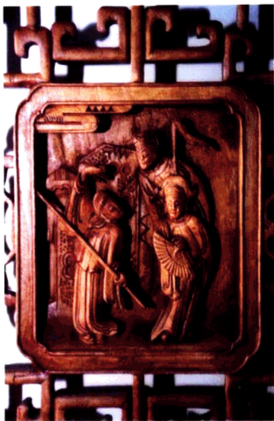
图7 建筑木雕局部：戏文故事

湖南与毗邻广东统称“湖广”，过去“湖广”的商人十分活跃，商贾发迹后回乡修建祠堂宅第于明清渐成风气，经济的繁荣与木材资源丰富成为湖南建筑木雕兴盛的基础。湘西土家族喜爱将凉亭建在石拱桥上，湘西南侗族善建鼓楼和风雨桥；其凉亭、鼓楼均有飞檐、横枋和栏杆作雕刻纹样。湘南、湘东、湘中地区建筑木雕最多。在湖南的宜章、临武、郴县等县，有的村落至今保留着气势颇为宏大的传统民居建筑群，宜章芭蕉乡的民居窗户田心板上可见完整的戏曲故事，如访贤、会友、比武、夺棍、打猎等片断，情节生动，人物传神，雕刻工艺之精到，会让你忘了画面情景是雕刻所为。临武县武水乡陈家村柳氏宗祠是清末时期的建筑，它的木雕装饰分布在大梁的中部，窗枋的尾端，短小的雀替、元宝和不太长的轩顶上，取得了以少胜多的效果，大梁上方拱形望板上遂施以的彩画，代替了传统的藻井图案，与雕刻相映成趣。郴县良田高雅岭杨家大屋系清同治年修建的，该大屋共8个天井，70余间房子，厅堂厢房“点睛”之处均有不少雕刻图案，