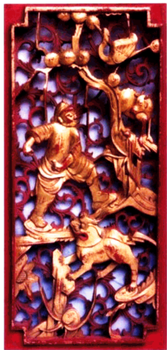
图8 家具木雕局部：西游记故事

其中有一组反映现实民俗生活的雕刻，分别表现了采桑、纺线、织布、女红、农耕、祭祀、农医等场景，人物真切，情节入微，好一幅写实风格的田园乡土生活图卷。