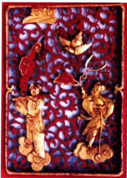
图7 家具木雕局部·八仙人物

床铺是男女老幼纳寝卧之所在,它涉及繁衍生息的诸多大事。除床铺的选材用料必须精良、结构尺寸讲究得当外,纹饰之美观则是最引人注目的。旧时大户人家最能体现其家道殷实、地位尊贵的就是床铺。湘西自治州博物馆藏有一张“千工床”,“千工”虽是虚词,但没有两年以上的功夫,这般华丽精致的床是做不出来的。“千工床”又称“三滴水”,是指床铺有三个进身,重栏叠档,像房子有三层滴水房檐一样。床檐边饰作月牙状,中心图案大都为“三星图”、“双龙夺珠”或“双凤朝阳”两旁则配有“麒麟送子”、“鹿鹤同春”、“鸳鸯荷花”、“松鼠葡萄”、“梅兰竹菊”等,另外,还有“八仙过海”、“郭子仪庆寿”、“三国