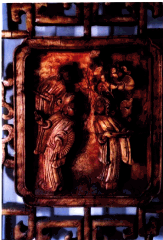
图4 建筑木雕局部：戏文故事