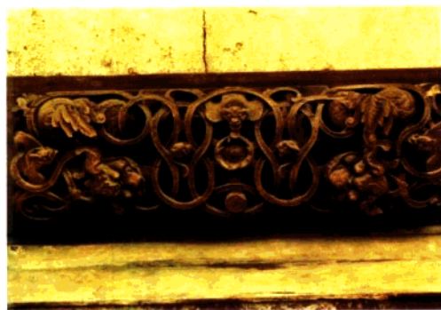
图3 清代建筑木雕：门楣·福寿绵绵