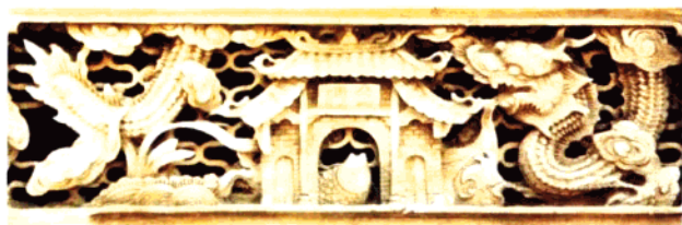
图22 含藏楚巫内蕴的建筑木雕条环板“鲤鱼跳龙门”。