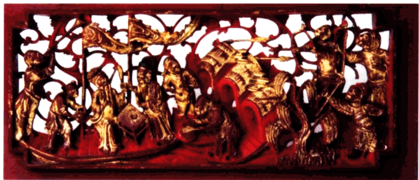
图20 充满简朴写意情趣的木雕“草船借箭”。

是清一色的吉祥图形,有民间《赞牙床》为证:“麒麟送子床头定,鸾凤鸳鸯立两旁,象牙牙床号月宫,四方诸柱是金银。雕龙彩凤双双舞,作出奇花色色新。玉枕锦食生彩色。芝兰奇宝洞房春。”真是一派喜庆祥和的气象。更加直观的是宜章县民居的木雕窗格,整个窗格就是由一个个变形的“福”、“寿”或“喜”字组成,别出心裁又给人一种扑面而来的亲切之感。