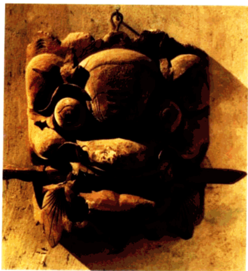
图14 祭祀木雕·虎头衔剑