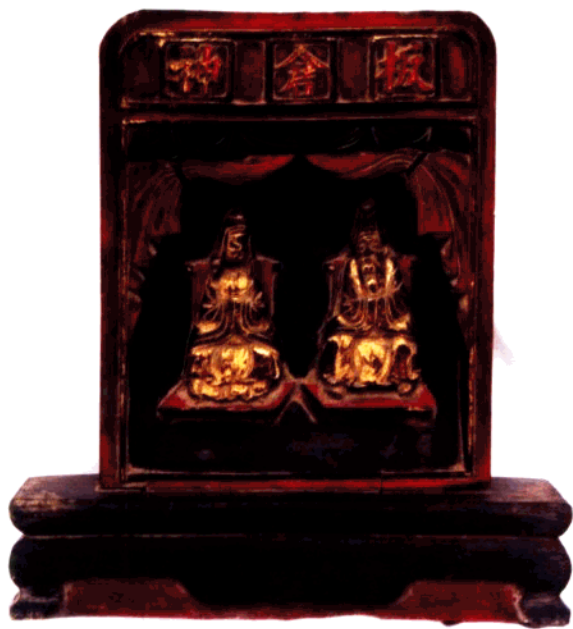
图16 清代祭祀木雕神像·板倉神