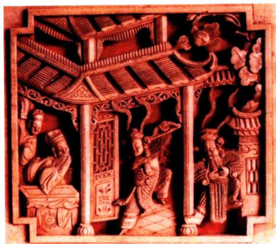
图13 家具木雕局部·戏剧故事

演义”、“西游记”等历史戏曲故事。总之，雕刻图案内容吉祥喜庆，工艺细腻繁复，镶牙嵌玉，点彩描金，可谓极尽精巧华丽之能事。与雕花床相匹配的通常还有八仙桌、太师椅和摆柜等。八仙桌一般为方形四腿，腿之下方成弯曲虎足状，雕花纹饰在桌子四方的侧面，两边饰以缠枝花、拐子纹等。太师椅雕饰部位集中于靠背和扶手上，靠背中央花心板雕刻戏文故事，最常见的有刀马人。这或许与主人的喜好有些关系。摆柜的雕刻部位最多，有挂落、牙板、金瓜、对狮等。以上雕刻多为高浮雕和透雕。尽管人物造型均采用夸张手法，但仍然突出着画面的立体感和真实感。