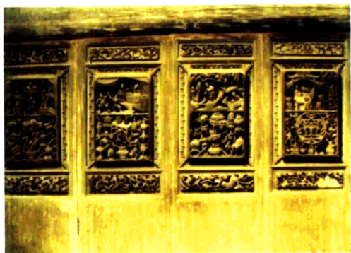
图1 清代建筑木雕：隔扇·戏文故事(四条屏)