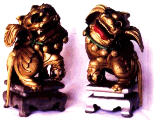
图19 祭祀木雕·香火狮子