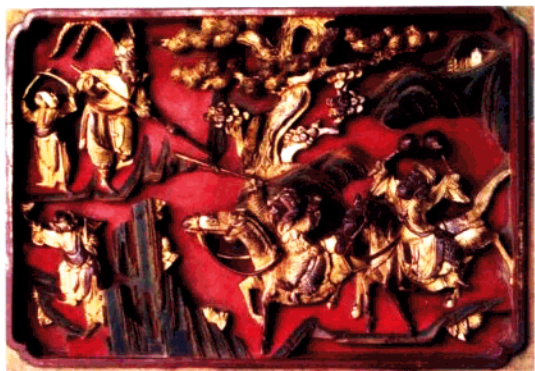
图5 建筑木雕局部：戏文故事