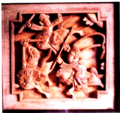
图12 家具木雕局部·刀马人