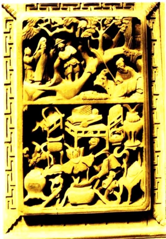
图2 隔扇局部·戏文故事·文王访贤

出代表作。这一时期出现的我国最早关于工艺的著作《考工记》中记载“大宰使百工化八材”所谓“八材”即“珠、玉、石、象、牙、木、金、革、羽。”可以推新，木雕工艺在当时与其他雕刻工艺一样，已经达到相当高的水平。