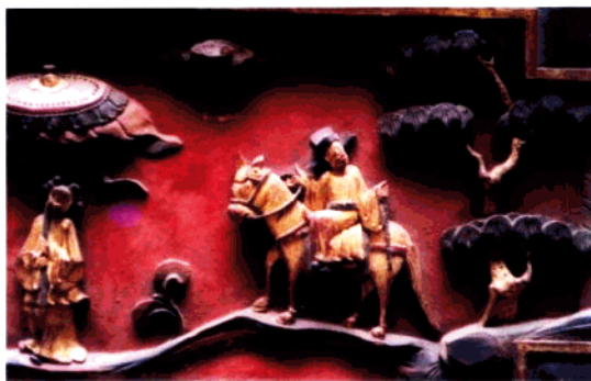
图6 建筑木雕局部：状元及第

村，修炼内丹等宗教仪式在民间形成风气，继而是文人雅士隐逸时尚风靡全国。建造寺庙、道观、宗祠和民居豪宅成为一种争相仿效的时髦，湖南地处山林丘壑之间，其宗教观念和自然山水格局促成了民间建筑与家具木雕的兴起，民间木雕行业在宋代已经发展到“从雕刻者如云，工刻艺者日众”的地步，据宋代金溪杨氏家谱记载，当时长沙王府有镌木家丞，专于木雕之事“携乡里人丁往事艺者众”。湖南宁远县的文庙是宋乾德三年（公元965年）初建，后历经毁坏与修复，其建筑规模宏大，气势不凡，前门后殿，雕梁画栋，正殿大门及窗裙板均有精致木雕装饰，或花鸟走兽，或戏文故事，其工艺堪称一流。