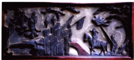
图21 富有吉祥喜庆意义的木雕“天仙送子、状元及第”。