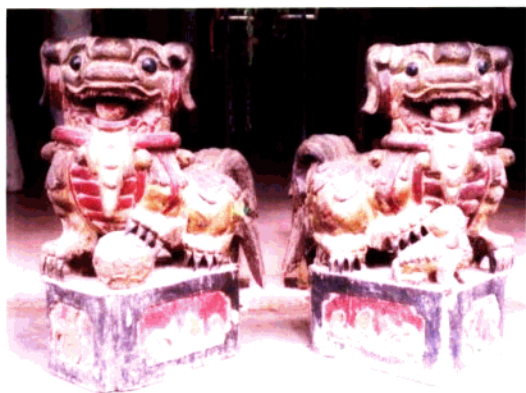
图18 祭祀木雕·香火狮子