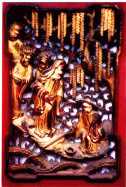
图6 家具木雕局部·「文王访贤」

纹饰与雕工相对要细密精致些,从雕刻纹饰题材看,建筑物上部主骨架一般是程式化的龙凤、麒麟、狮子等祥瑞动物和灵芝如意等吉祥符号。在房屋下部的门窗田心板和绛环板则多雕以历史神话人物,戏曲故事或民俗生活情景。窗隔纹饰有拐子龙纹、直棂、菱花三类,其中含拐子、套方、宫式、珠纹、水纹、海棠纹、井字口、万字纹灯笼框等等,穿插于窗隔线条中的点状纹样有花鸟、蝙蝠、狮子、人物等。湖南民居大门雕饰往往带有较浓的宗教巫术色彩,门首上方常见一木雕吞口面具,俗称“虎口衔剑”,具有明显的避邪镇宅意义。门槛雕有鲤鱼,寓“鲤鱼跳龙门”之意;与之对应的门楣上,常有一对数寸长的短木柱伸出,有圆有方,被称之为卦木,在卦木前端贴有水银镜,有的刻双鱼太极图,或刻乾坤二卦,其含义不外是借日月、阴阳弘扬天地正气,祈求平安吉祥。