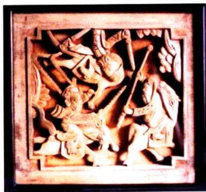
图12 家具木雕局部·刀马人