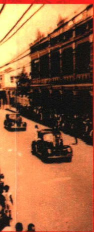
赵雪章 / 主编