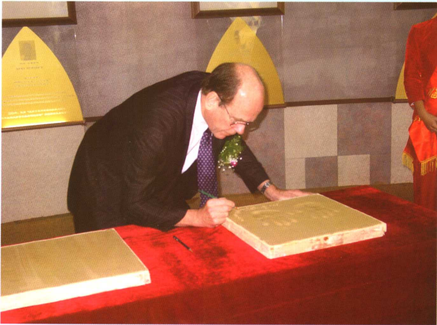
▲ 2001年诺贝尔化学奖得主巴里·夏普莱斯博士于2005年11月1日造访、考察珍奥。