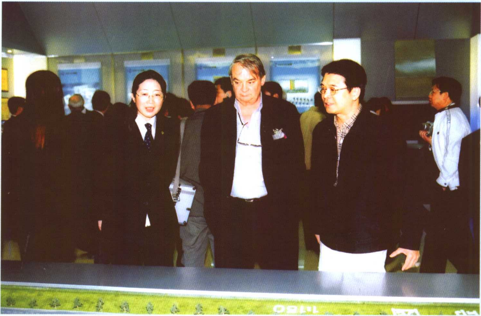
▲ 1998年诺贝尔生理学及医学奖得主弗里德·穆拉德博士于2005年4月26日造访、考察珍奥。