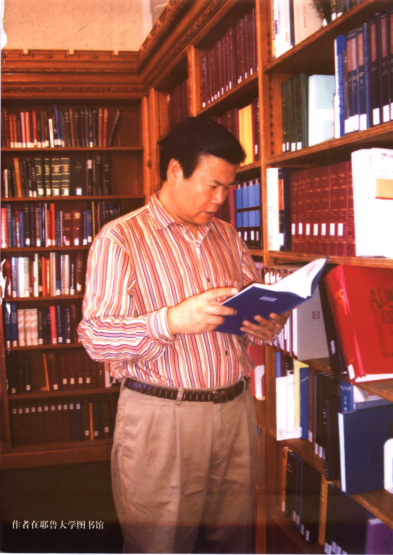
作者在耶鲁大学图书馆