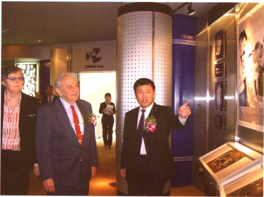
▲ 1992年诺贝尔奖得主罗道夫·阿瑟·马库斯博士于2005年11月1日造访、考察珍奥。