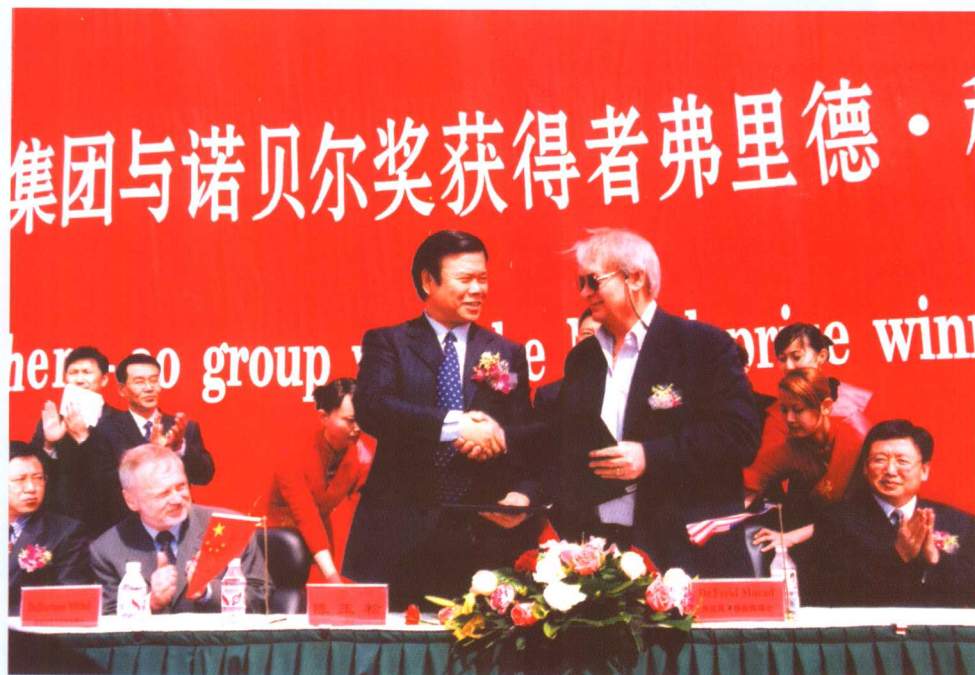
▲ 2005年4月26日，珍奥集团董事长陈玉松与诺贝尔奖得主弗里德·穆拉德博士在珍奥签约，穆拉德博士用自己的高端科研成果一氧化氮技术与珍奥合作，在中国进行产业化。