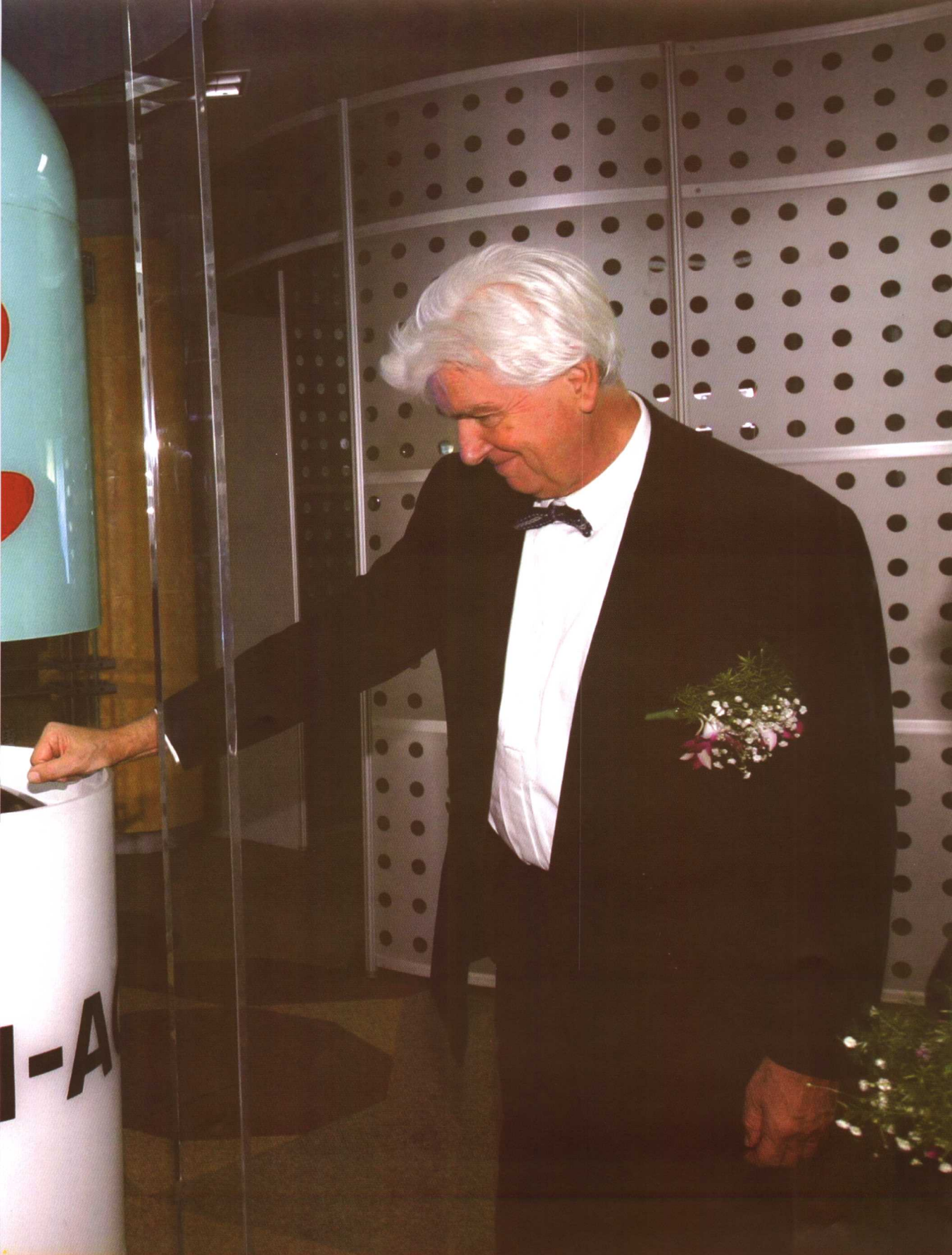
▲ 1999年诺贝尔生理学及医学奖获得者冈特·布罗贝尔博士于2004年11月3日造访、考察珍奥。