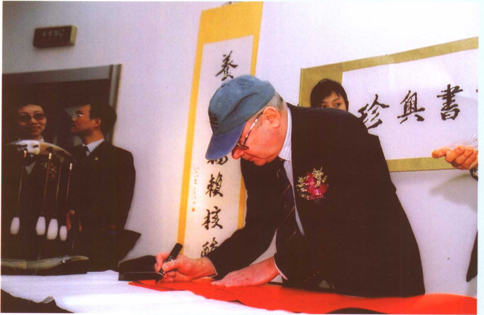
▲ 1988年诺贝尔化学奖获奖科学家约翰·戴森霍尔博士于2005年4月26日造访、考察珍奥。