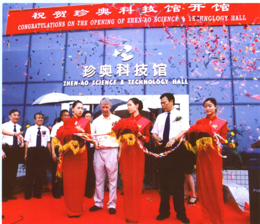
▲ 1993年诺贝尔生理学及医学奖获得者理查德·J·罗伯茨博士于2002年7月22日造访、考察珍奥。