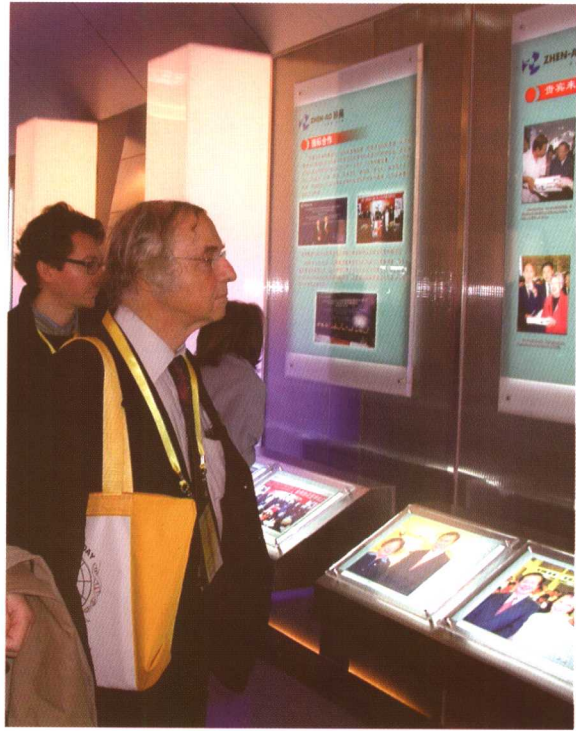
▲ 1989年诺贝尔化学奖得主罗伯特·胡贝尔博士于2005年4月26日造访、考察珍奥。