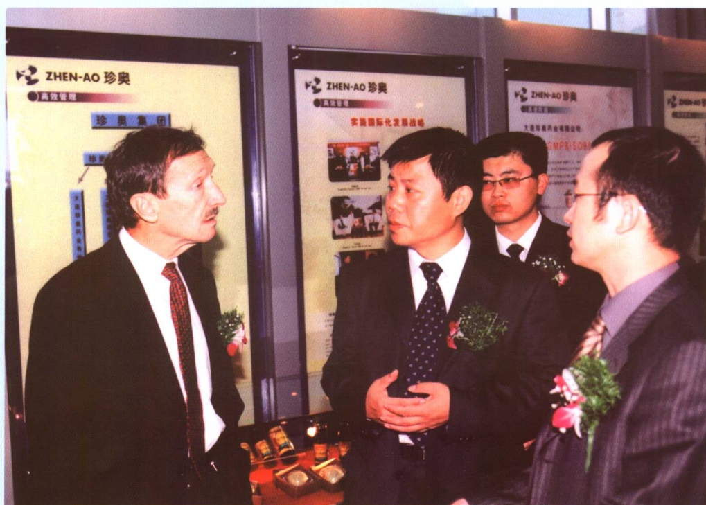
▲ 1996年诺贝尔生理学及医学奖获得者罗尔夫·M·青克纳格尔博士于2003年10月17日造访、考察珍奥。