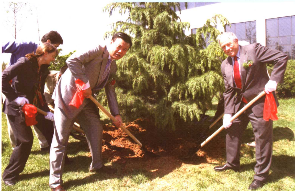
▲ 2002年诺贝尔化学奖获得者科特·伍斯里奇博士于2004年5月13日造访、考察珍奥。