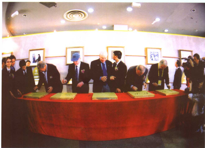
▲ 五位诺贝尔奖获奖科学家在珍奥科技馆内留下他们的手模。