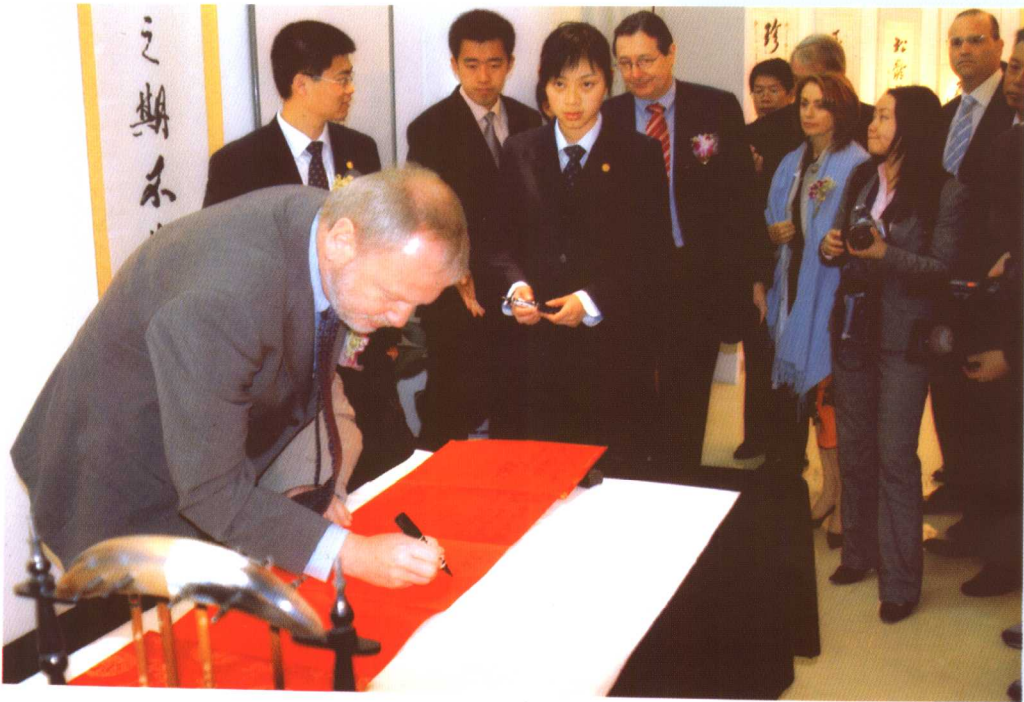
▲ 诺贝尔奖获奖科学家米歇尔博士为珍奥留言：给珍奥最诚挚的祝福，祝珍奥产品研发取得更大成功。