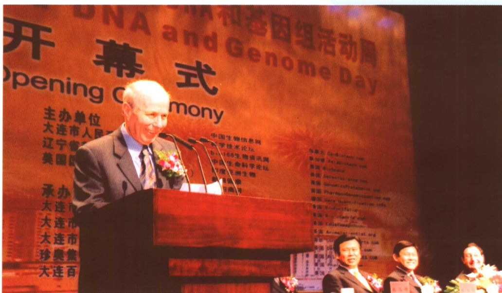
▲ 2004年诺贝尔化学奖得主阿夫拉姆·赫什科博士于2005年4月26日造访、考察珍奥。