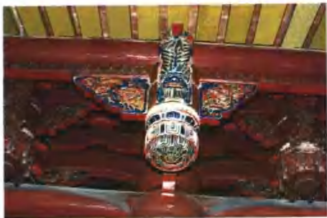
吊筒 竖柴 托木