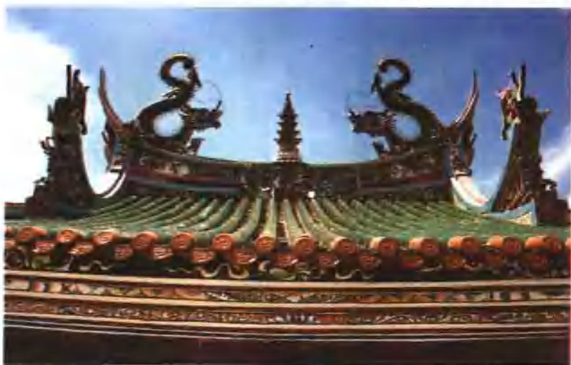
脊顶双龙宝塔装饰