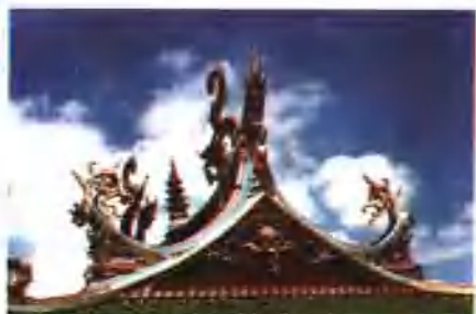
山墙、脊尾、归垂、护杆尾装饰