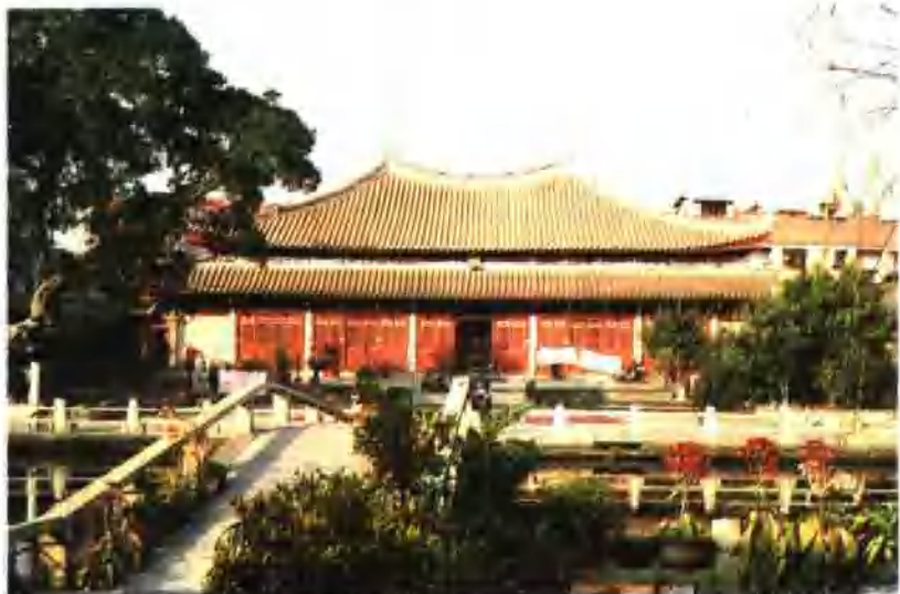
重檐、庑殿（孔庙大成殿）