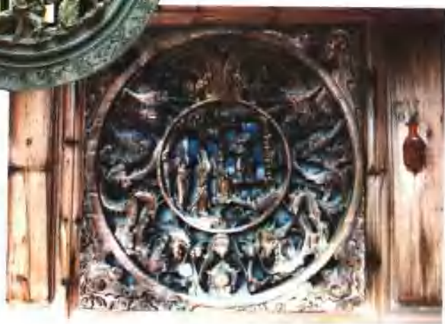
青石圆框人物透雕