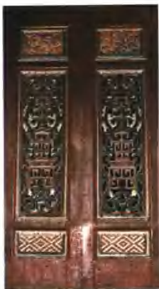
笼扇(带腰头雌虎堵)