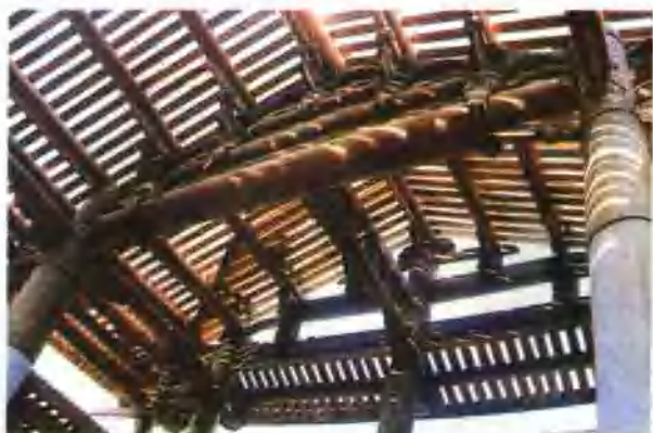
五架坐梁木屋盖栋路