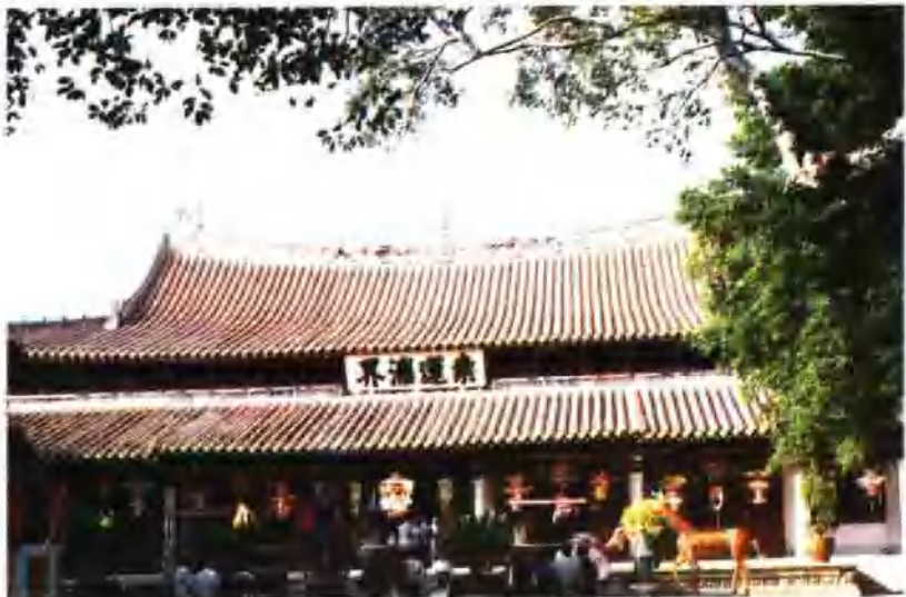
重檐歇山顶（开元寺大雄宝殿）