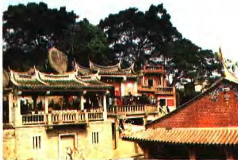
硬山顶（草庵摩尼教寺）