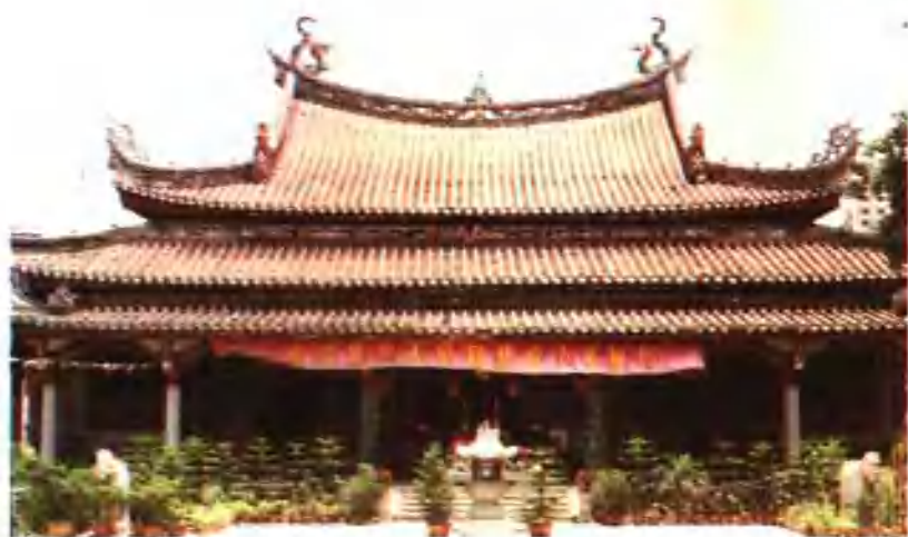
重檐歇山顶（天后宫）