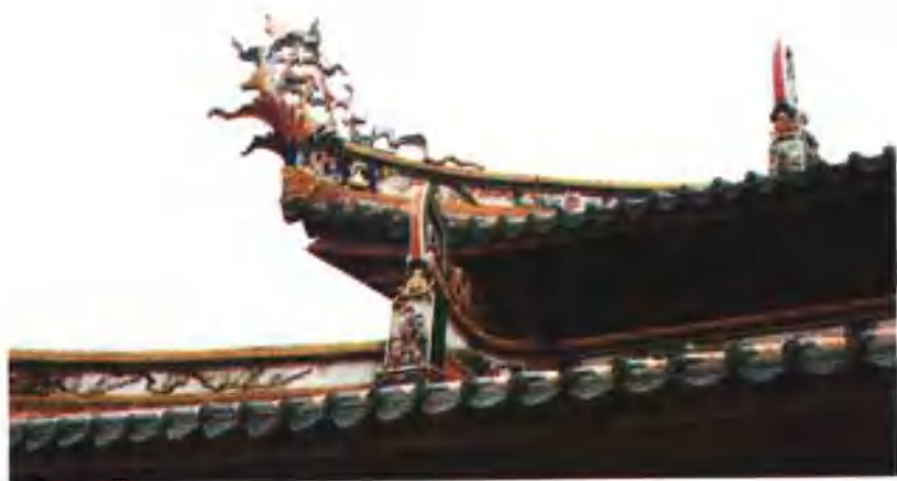
归带 帅杆尾 草花装饰