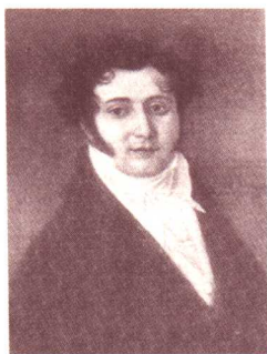
尤里·莱蒙托夫 (诗人之父)