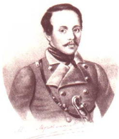
莱蒙托夫像（及签名式） （石印画）