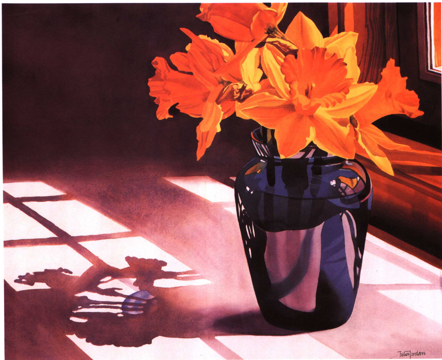
黄水仙 朱迪亚·佐丹 (53.3×74cm)