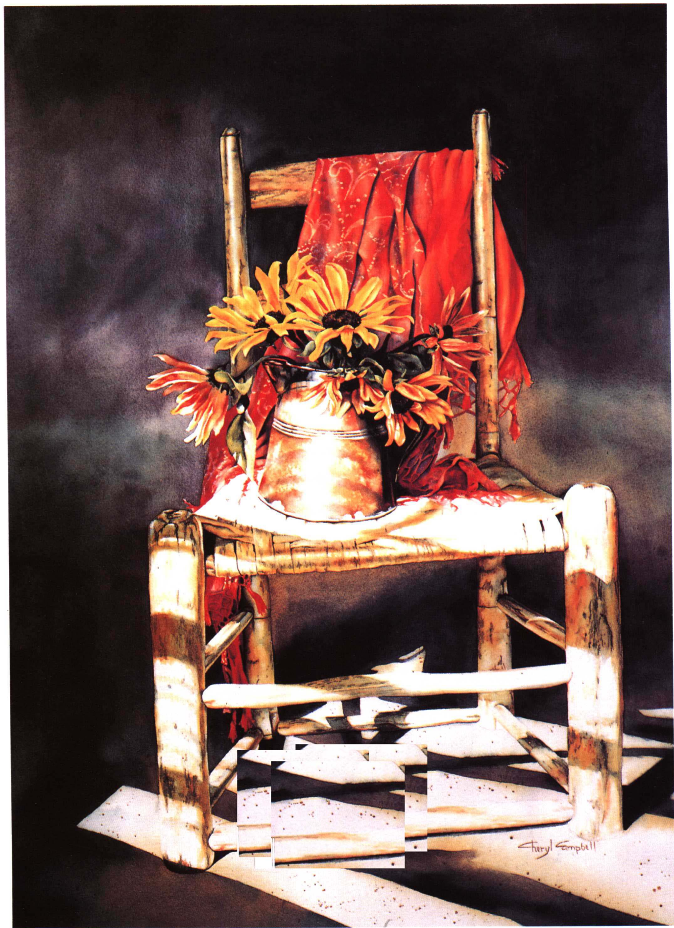
红色披巾 切瑞尔·切贝尔 (76.2×56cm)