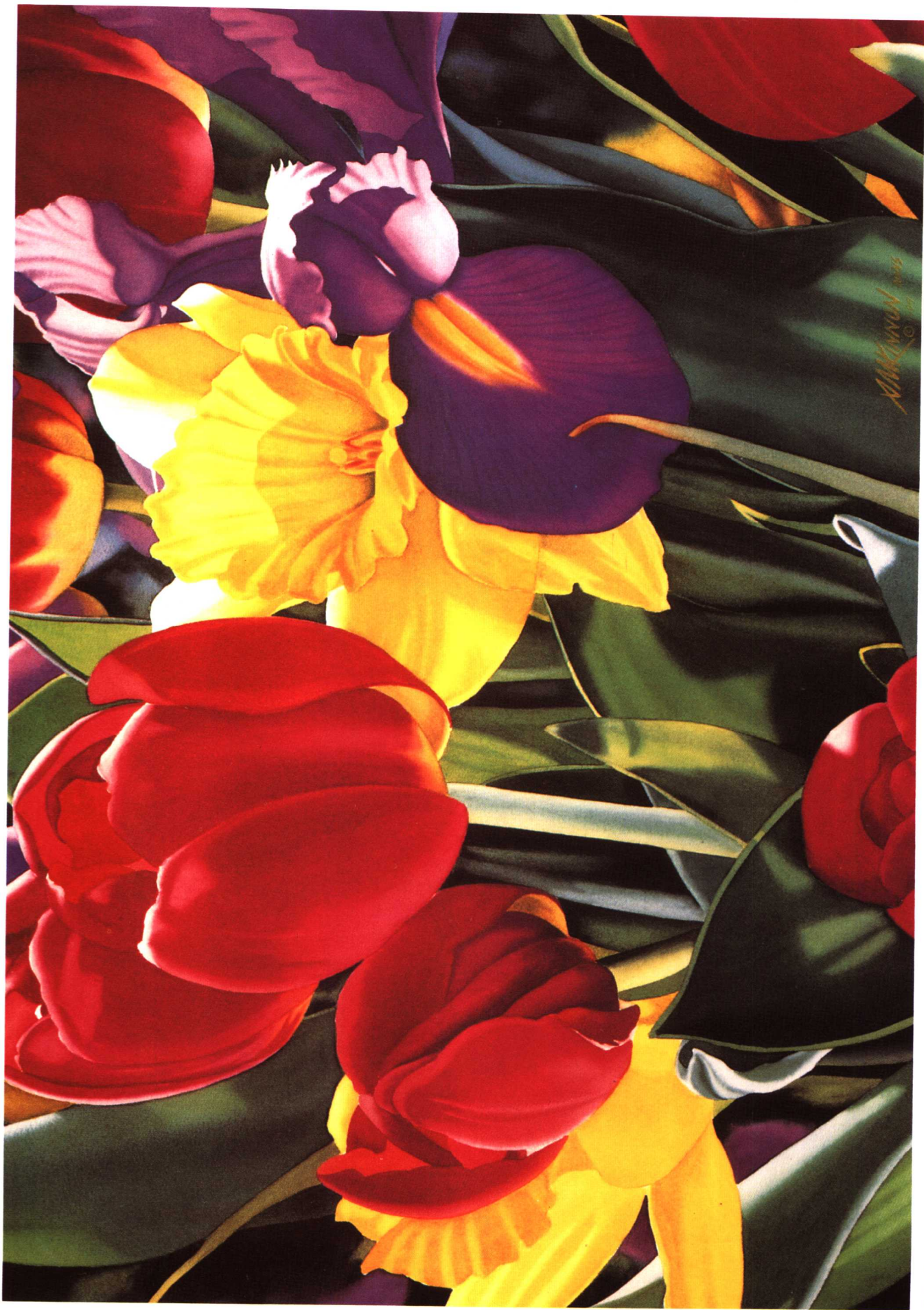
春天调色板 苏娜·麦克金农 (54.6×73.7cm)