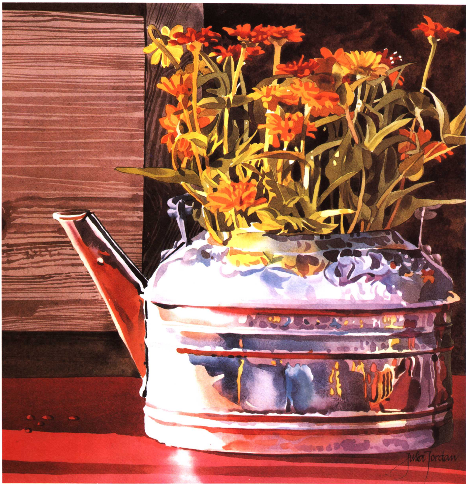
五彩壶 米丽亚·佐开 (36.8×36.8cm)