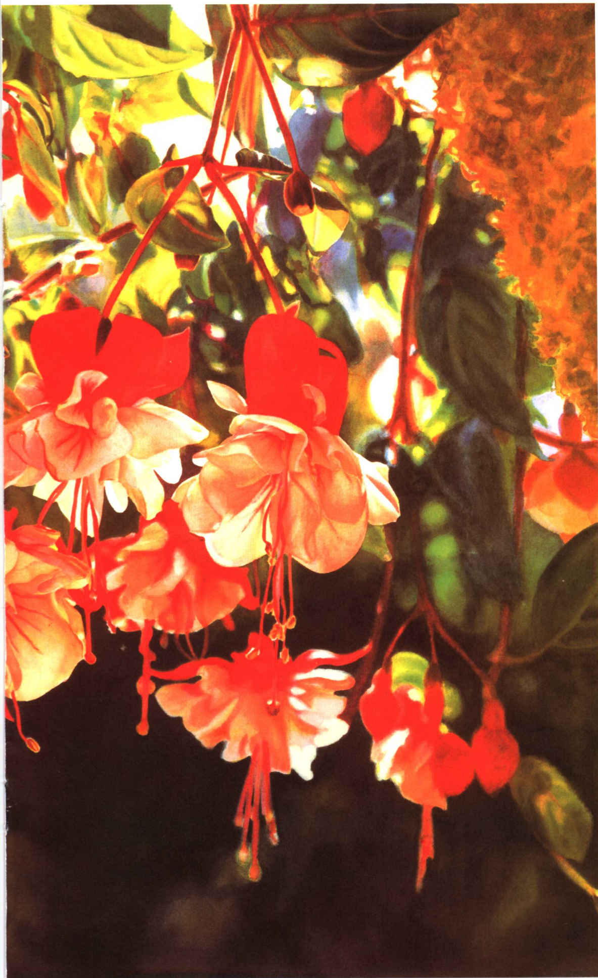
吊兰花 尼德拉·托雷 (76.2× 106.7cm)