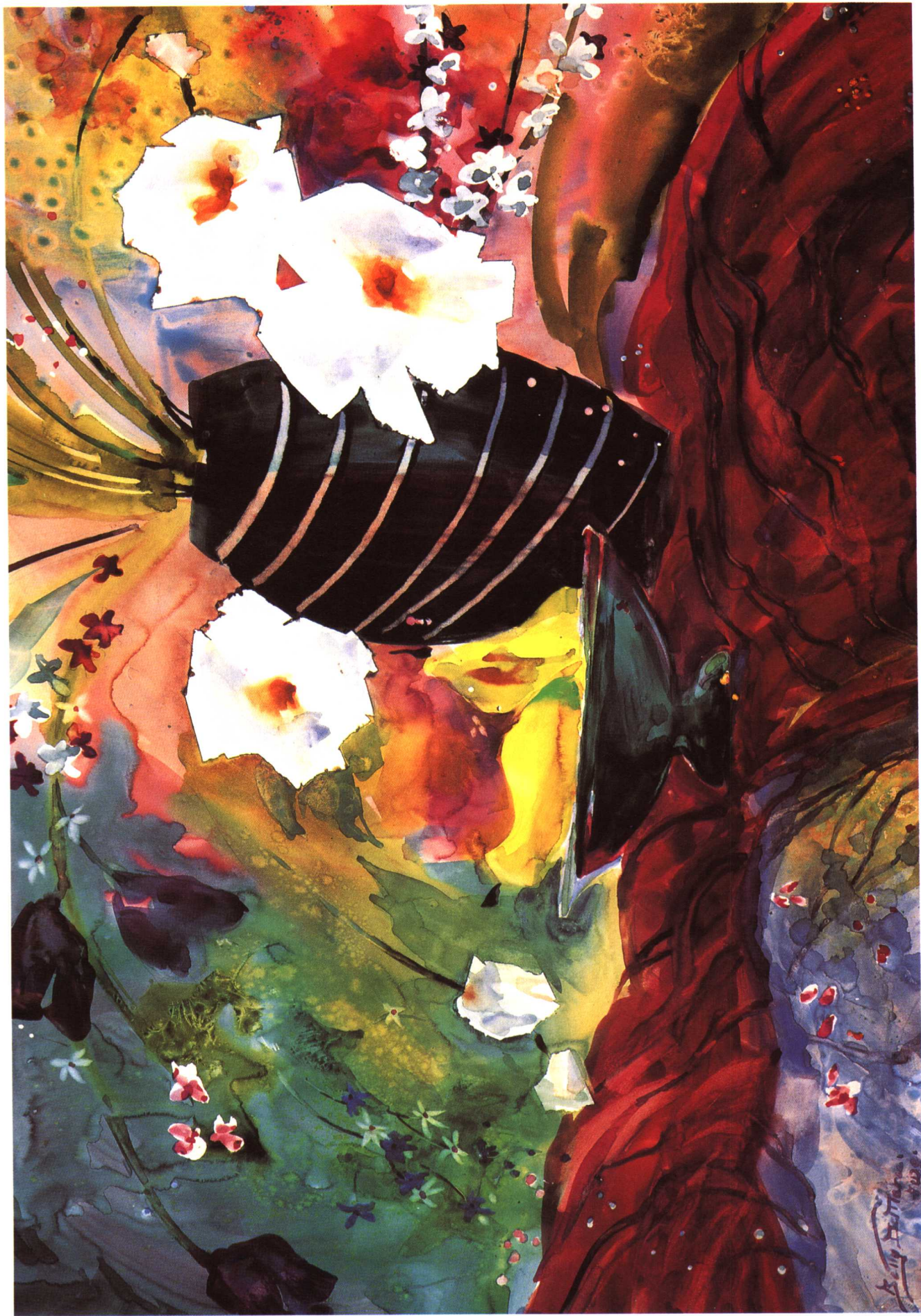
黑瓷器 贝蒂·迪玛丽 (50.8×76.2cm)