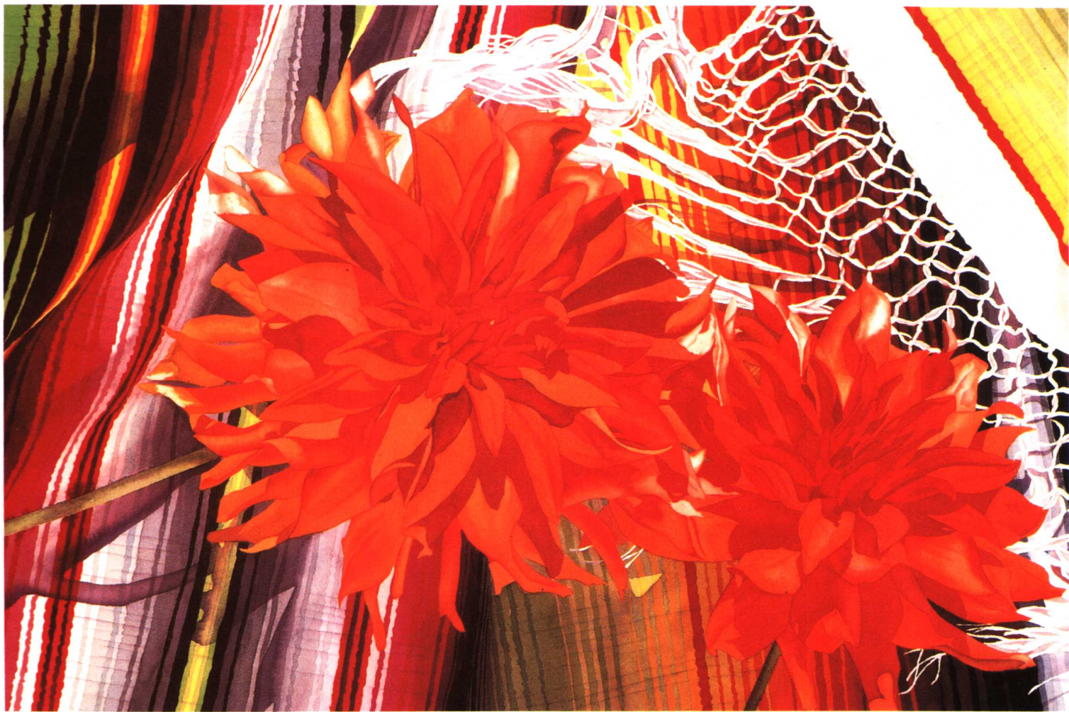
西班牙舞风 朱迪·D·特瑞曼 (68.6×99.1cm)