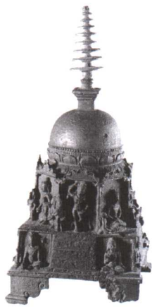
这尊9世纪的印度铜像是一座舍利塔，原是用来存放皇帝和国王的遗骨和遗物的。佛陀入灭后，他的遗骨分送给许多舍利塔，舍利塔随后就成为佛陀终极涅槃的象征。选自《梁启超说佛》

随着佛教传入中国，东汉时期在洛阳的白马寺修建了中国的第一座佛塔。在佛教信徒们的眼里，佛祖的舍利是最为神圣的崇拜物，而安奉舍利的佛塔就要具有庄严雄伟、匠心独到的形貌。所以，在中国大地上，自第一座佛塔建成后的2000多年来，相继出现了许许多多具有中国民族特色的古塔建筑。诚如梁思成先生所说：“作为建筑物的遗存，为中国的风景添彩增辉的，没有比在中国话里最容易发音和容易记住的‘塔’更显著的东西了。” ①