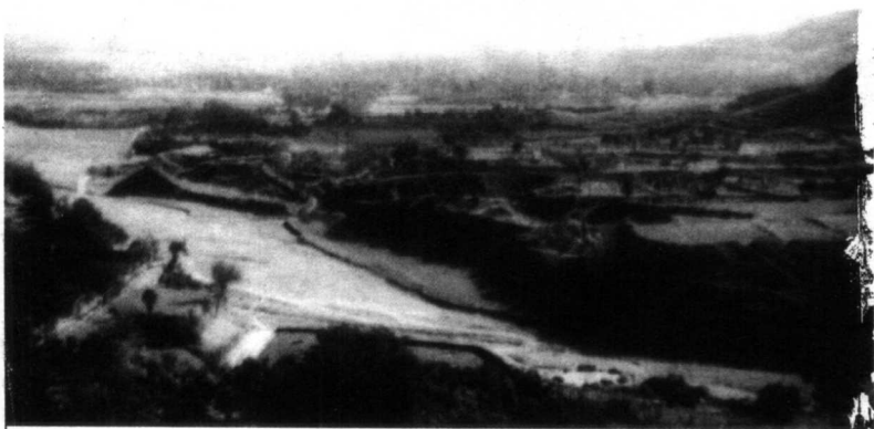
☆ 故事发生在华北平原的抗日民主根据地。

这是一个抗战小英雄的故事，它发生在抗日战争时期的华北抗日民主根据地。在硝烟弥漫的战争岁月里，有着千百个这样的故事，这是其中一个。