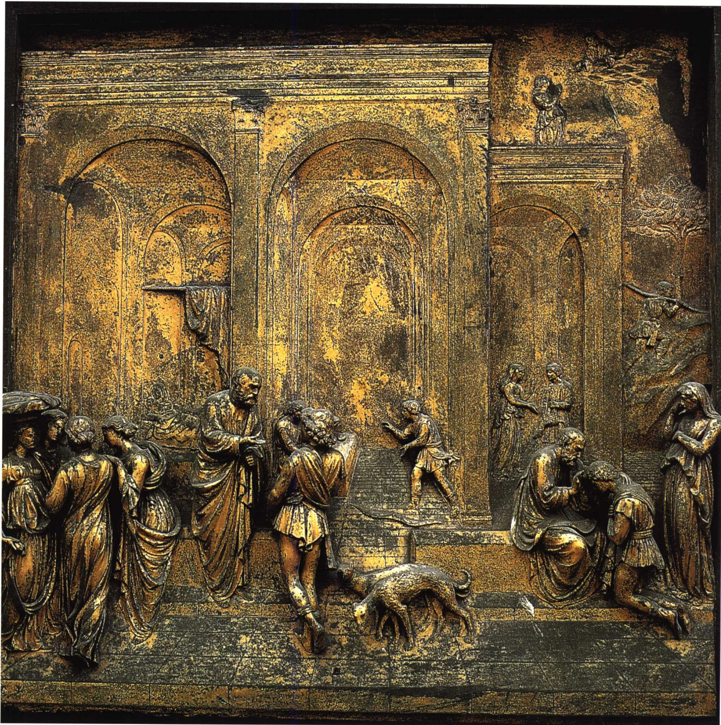
洗礼处的天堂之门 1429-52 局部：以撒的故事 青铜(79.5 × 79.5)厘米 罗伦佐·吉尔贝蒂