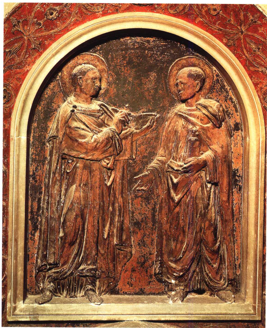
圣科斯马斯和圣达米安(圣罗伦佐教堂) 1434-43 绘画油泥,(215 × 180)厘米 多纳太罗