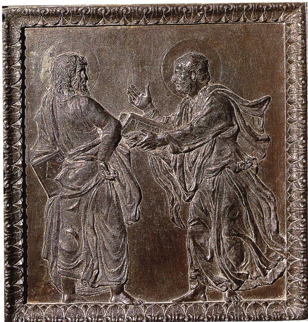
殉道者之门(圣罗伦佐教堂)