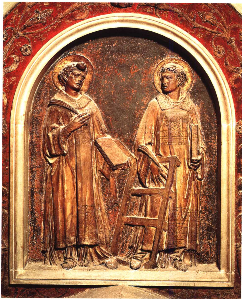
圣斯蒂芬和圣劳伦斯(圣罗伦佐教堂) 1434-43 绘画油泥,(215 × 180)厘米 多纳太罗