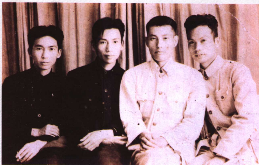
与地下党老战友合影