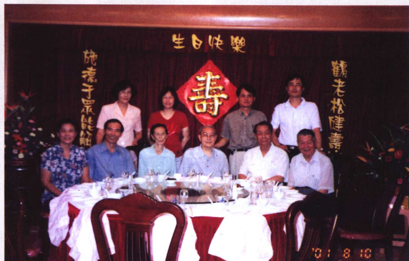
诸晚辈为施老庆祝八十大寿