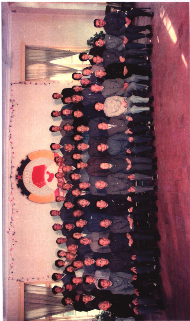
1992年邓颖超政协主席莅厦视察时与市政协委员合影