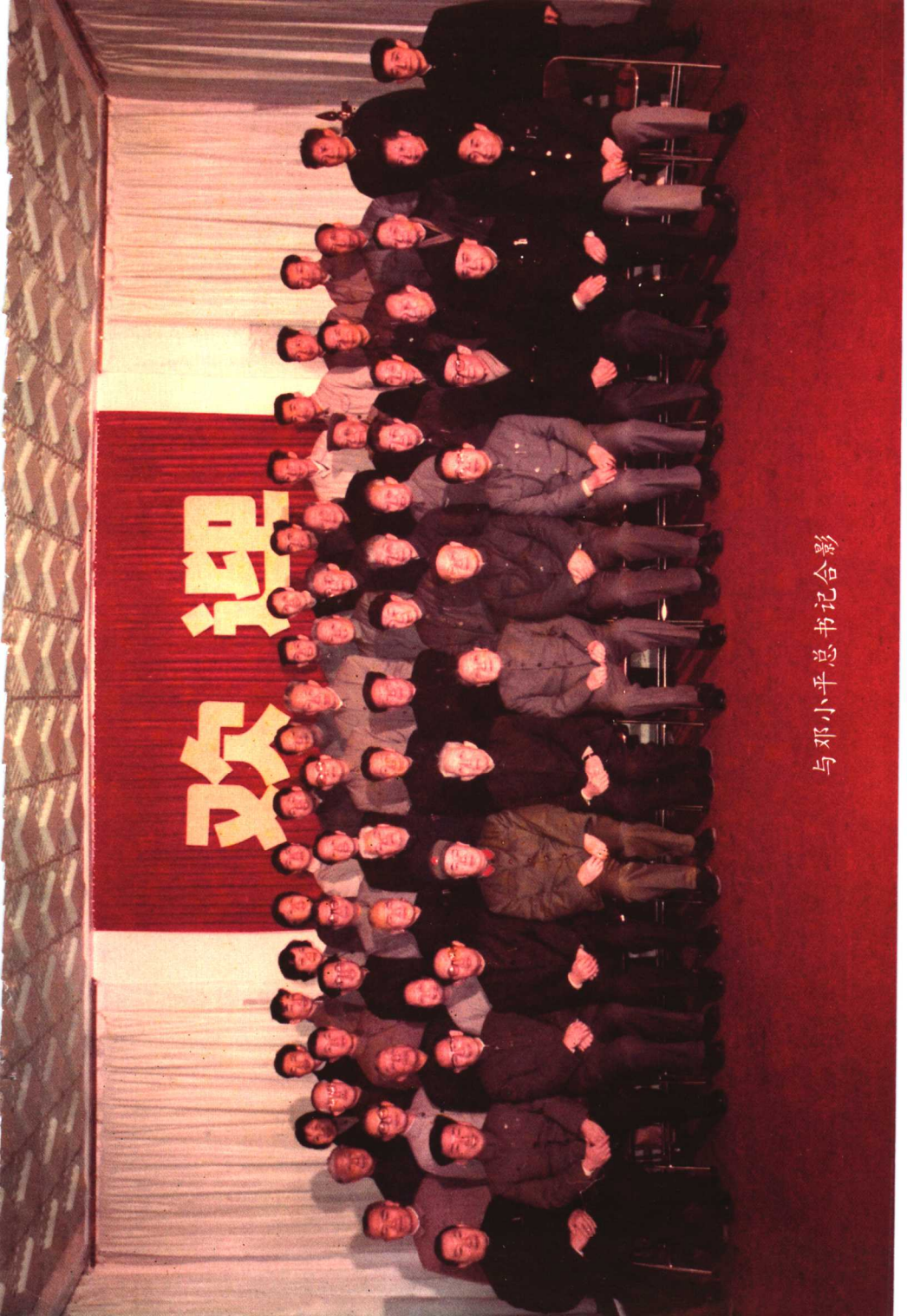
与邓小平总书记合影