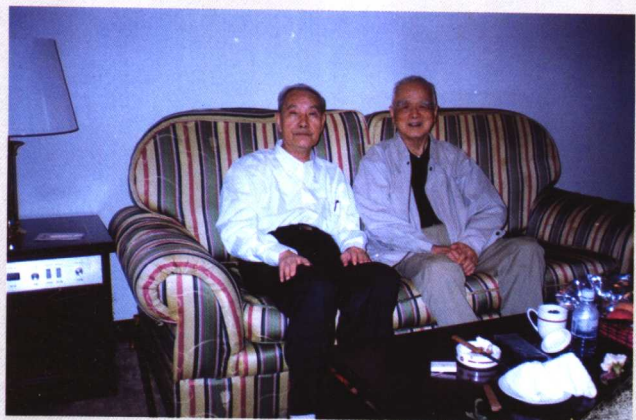
与老领导 梁灵光合影 (2002.10.20 上午)