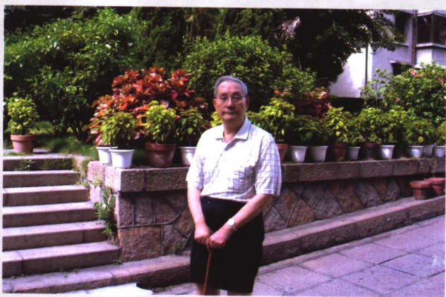
摄于自家 院子 (2002年)