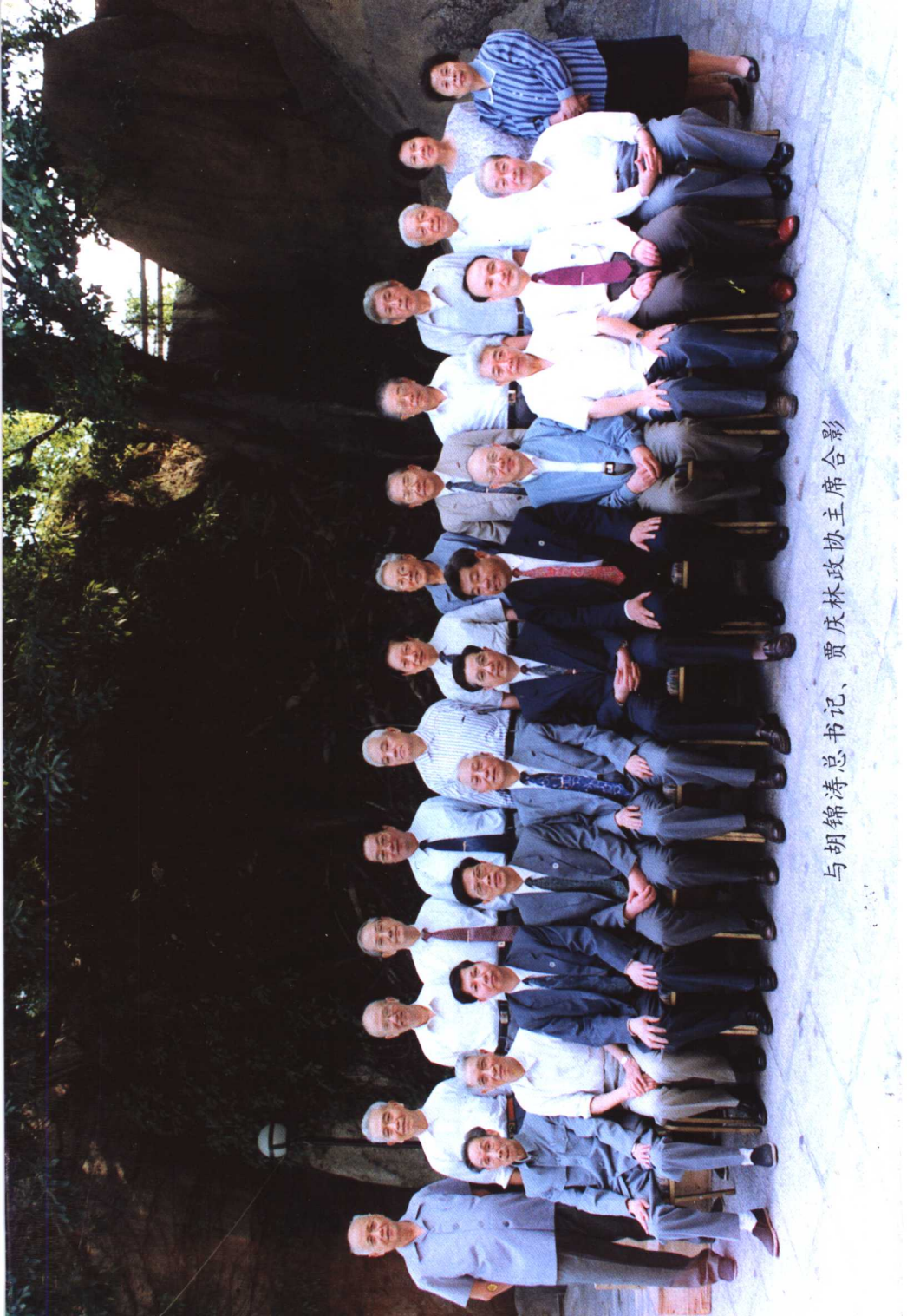
与胡锦涛总书记、贾庆林政协主席合影