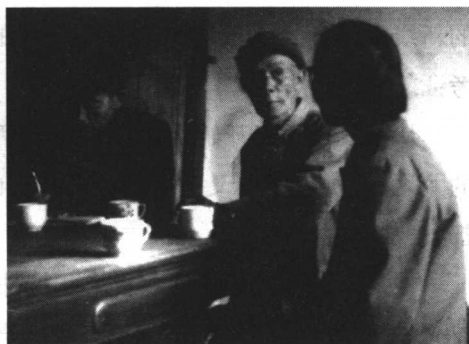
1983年4月，毛远志访问安源煤矿老工人