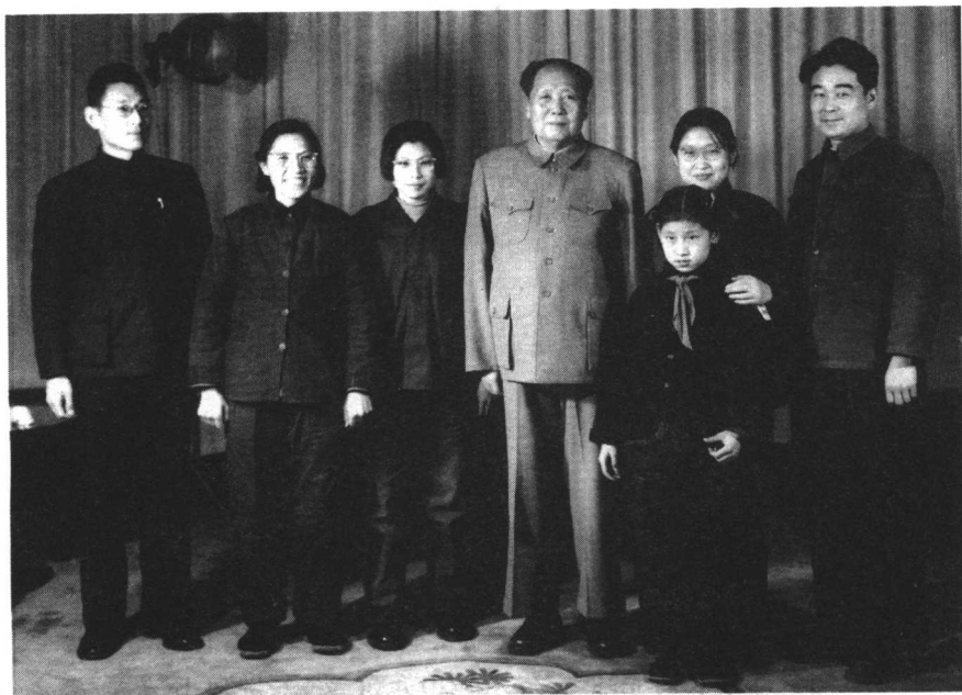
1963年12月26日，毛泽东与毛泽东烈士的女儿毛远志（左二）、女婿曹全夫（左一）等人合影

当他们走进颐年堂时，毛主席正与他的湖南故旧程潜、章士钊以及他的表兄王季范三位长者兴致勃勃地谈话。母亲他们坐在一旁静静地听着，接受教育。后来，主席请客人及工作人员共进晚餐。