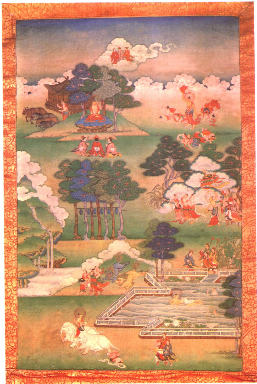
出游图——感受生老病死之一