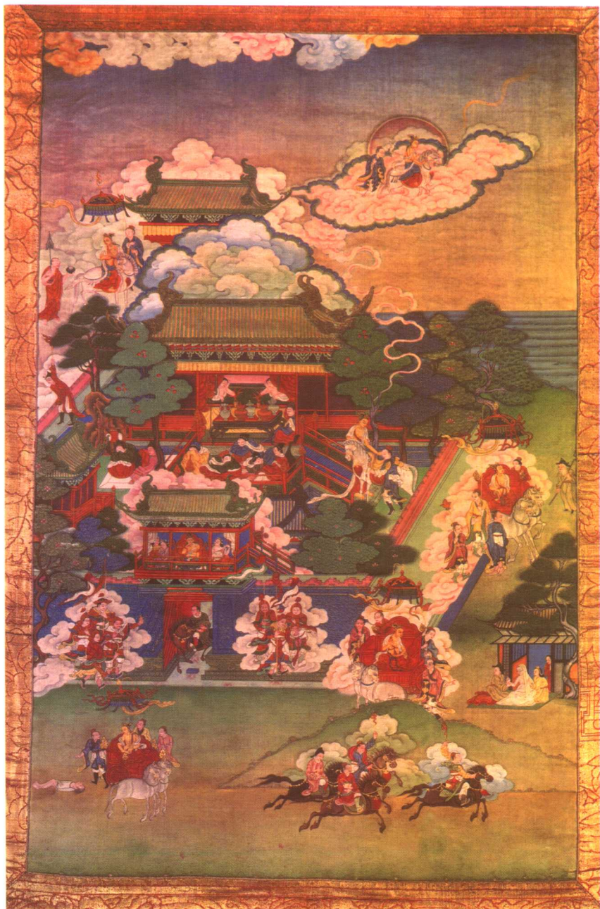
出游图——感受生老病死之二