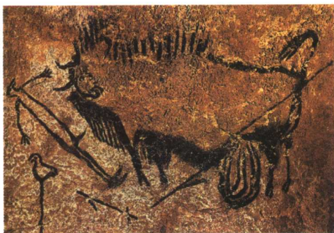
野牛、人与鸟 约公元前1.5万年 法国

画面的特点：写实的动物形象、一些稚拙的人物和奇怪的几何图形组合在一起，反映了原始人对自身与周围世界的理解。