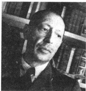
图 1-2 斯特拉文斯基

斯特拉文斯基(1882~1971)，美籍俄罗斯作曲家、指挥家、钢琴家，20世纪上半叶影响最为深远的作曲家之一。早年入圣彼得堡大学学习法律，后师从里姆斯基-科萨科夫学习作曲。与著名艺术经纪人贾济列夫合作的几部芭蕾作品均产生广泛影响，1939年移居美国。1962年重返苏联，获得很高荣誉。其一生创作风格多变，作品涉及浪漫主义、原始主义、新古典主义、序列主义等多种流派，其著名代表作有：《火鸟》、《彼得鲁什卡》、《春之祭》、《士兵的故事》等。