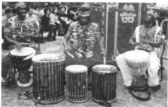
图 1-4 非洲鼓乐

非洲鼓具有鲜明的民族特色,无论是制鼓的材料、鼓的形状还是演奏技巧都十分独特。一般说来,在非洲存在几十种基本鼓型和数百种鼓的变形。鼓身的形状既有各种几何形,也有各种飞禽走兽形,甚至人形。有的鼓身上还画有各种图案,雕刻花草、人兽,具有浓郁的黑人文化特色。鼓皮的材质也是多种多样的,除常用的牛皮、羚羊皮外,还采用豹皮、斑马皮、蜥蜴皮、鳄鱼皮,甚至还有大象的耳朵皮。非洲鼓上还常常附加一些装置,以获得某些特殊的效果,如在鼓腔内装一些珠子或干的植物种子,或将金属