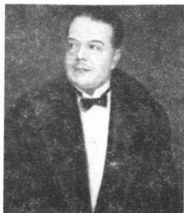
图 1-3 贾济列夫

贾济列夫(1872~1929),20世纪俄罗斯最杰出的艺术经纪人,他经营的俄罗斯芭蕾舞团在西欧获得了极大成功,使之上升为世界上最具实力的舞蹈团。同样,他为斯特拉文斯基提供了最佳的音乐创作舞台,使其独到的天赋得以充分展示。不仅如此,他在绘画领域也极具创意,主编了《艺术世界》杂志。他还以独到的眼光、强有力的经营手段,使俄罗斯圣彼得堡跻身世界艺术中心。他成功地策划了20世纪最重要的一些艺术事件,如原始主义芭蕾《春之祭》的演出等。贾济列夫是20世纪音乐艺术生活中举足轻重的人物。