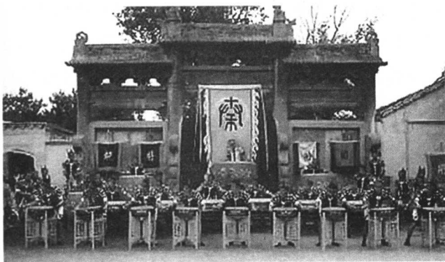
图 1-1 山西鼓乐

《秦王破阵乐》是山西绛州鼓乐中最为出名的曲牌。相传,唐武德三年(公元620年),秦王李世民率领唐军大破刘武周,收复并州、汾州两地,为了庆祝胜利,当地百姓用民间锣鼓奏出了《破阵乐》,后来,这首民间鼓乐得到整理和发展。到了贞观元年正月,唐太宗李世民大宴群臣,在大殿上演奏了经过加工整理并重新排练的《秦王破阵乐》。乐队的布局为“左圆右方,先编后伍,鱼丽鹅颡,箕张翼舒,交错曲伸,首尾相互,以象战阵之形”。由唐代初年的音乐家吕戈教练乐工120人,舞者身披银甲,