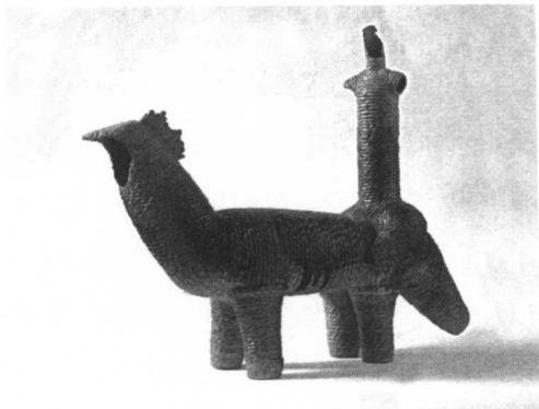
绿的反角度 2000年创作

制陶，看陶，体会陶，这是人类最古老的艺术行为。在博物馆里观赏原始陶器，总抑制不住内心的冲动。古老的陶器是印证原始先民心理情怀的艺术品。指纹，绳纹，描画的笔触和转动的痕迹，轮廓和线条的变化，面对这一切，我好像看到制作者的身影。在我眼中，远古时代的陶器好像不是来自几千年前，它那生动的色彩仿佛还有出窑时的温度……这时我的手也会情不自禁去抚摸点什么，手指也会去掐弄那并不存在的白泥巴。陶泥是那么柔软、均匀、滑腻，划过手头的感觉是那么的真实。