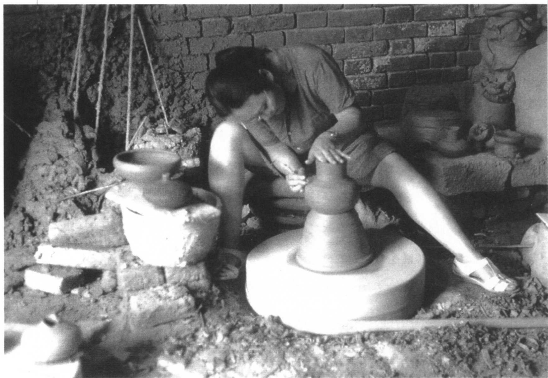
1990年 作者在陕西澄城县陶瓷厂窑洞作坊