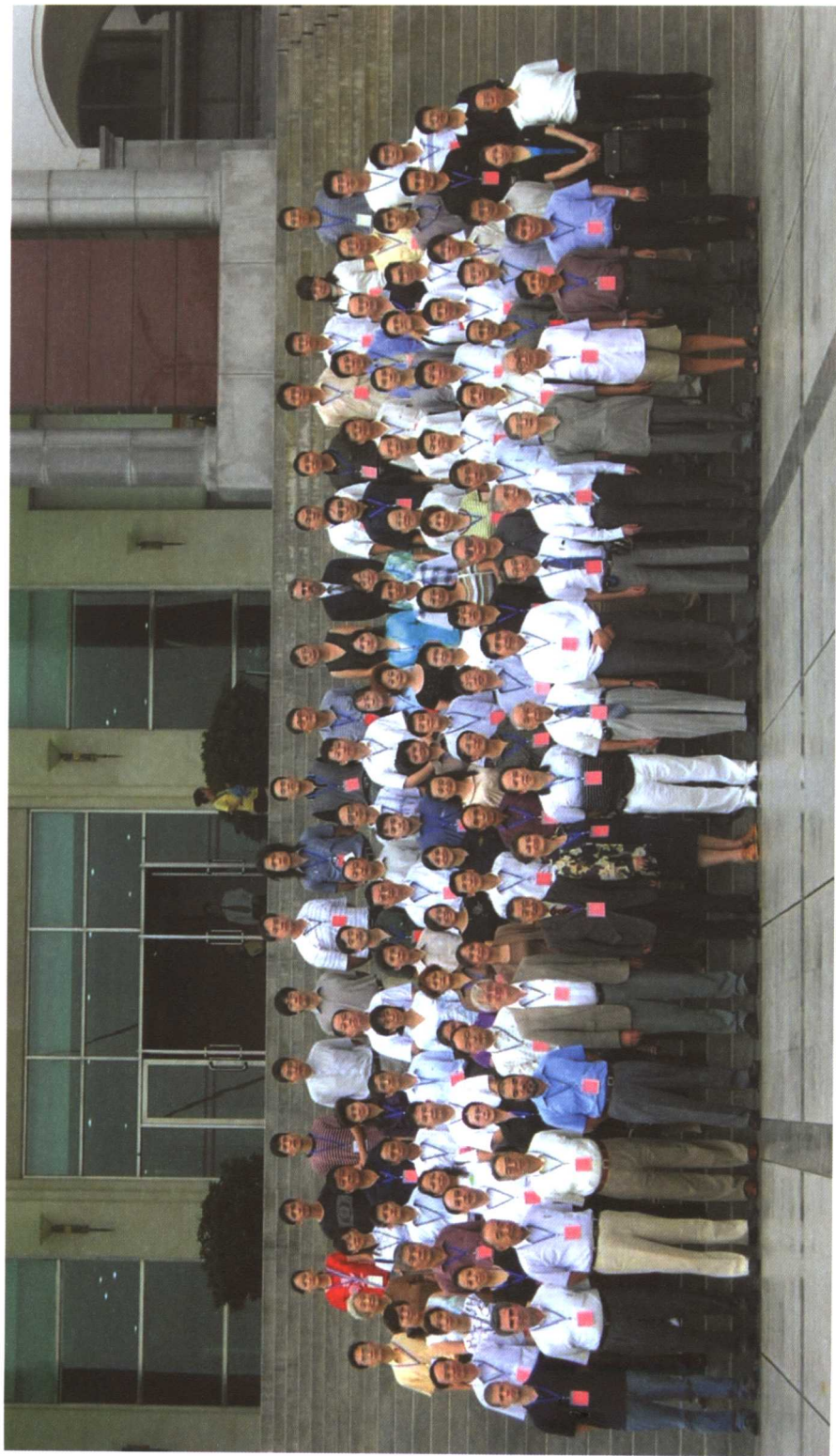
2005年“科举制与科学国际学术研讨会”代表合影