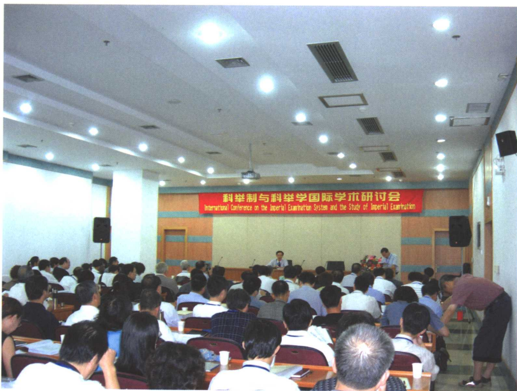
2005年“科举制与科举学国际学术研讨会”会场