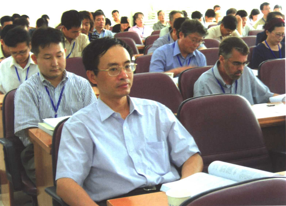
2005年“科举制与科举学国际学术研讨会”会场一角