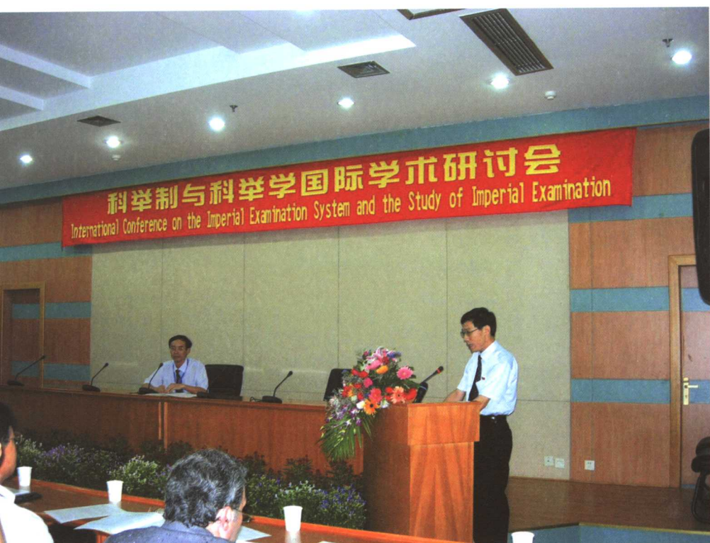
2005年“科举制与科举学国际学术研讨会”开幕式