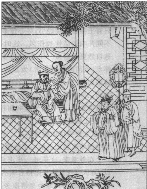
二十四孝图·亲尝汤药

阳朔三年(前 22),伯父大将军王凤病重,王莽日日随侍在侧,“亲尝药,乱首垢面,不解衣带连月”,其孝心远远超过王凤的亲生儿子。王莽的行动使不久于人世的王凤深受感动,看着王莽那憔悴的面容,他自然想起早逝的兄弟,怜爱之意油然而生。在弥留之际,王凤郑重地将王莽托付给元后和汉成帝。王凤病逝不久,成帝就任命王莽做了黄门郎。这是隶属中朝的一个加官,秩六百石。官虽不大,但地位相当重要,因为是在皇帝身边服务,晋升的机会很多。果然,王莽任职时间很短,即被提升为射声校尉。这个官职是武帝设立的八校尉之一,其职权是管理待诏射声士,即一支射技高超的军队的指挥,秩为二千石。这一年王莽只有二十四岁。二千石的射声校尉,与地方大吏郡太守秩级相当,不少人在官场上奋斗一辈子也达不