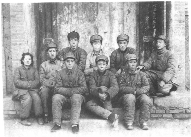
△ 1946年任中共建西县委书记时与县委机关部分同志合影