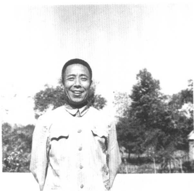
△ 1962年任中共中央东北局秘 书长时留影