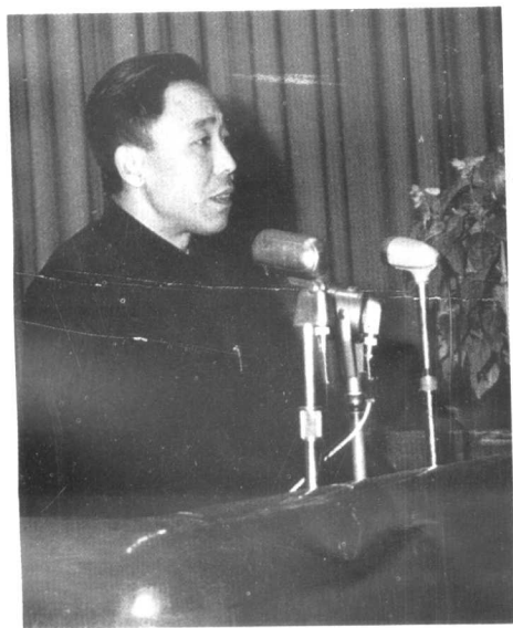
▽ 1957年任中共哈尔滨市委书记时在 市委宣传部召开的一次大会上讲话