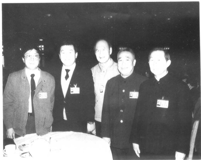
△ 1988年3月与李长春同志等在七届全国人代会上