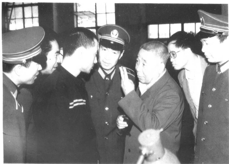
△ 1988年4月29日视察省第二监狱，6小时后因心力衰竭逝世