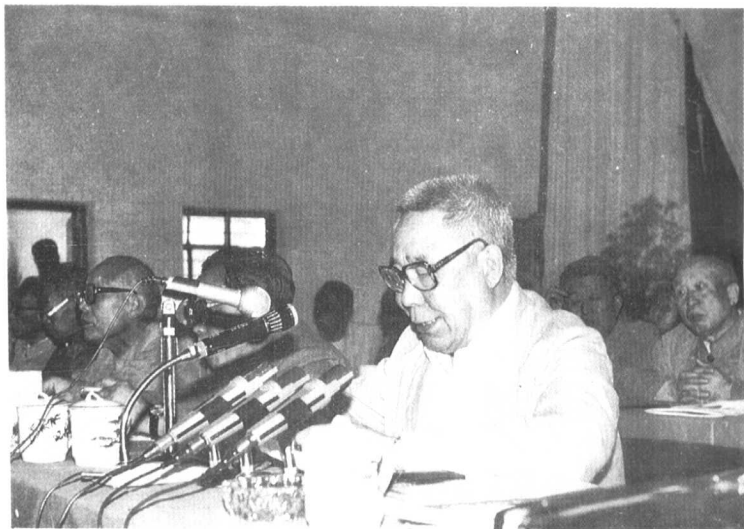
△ 1986年5月14日在河南省社会科学学会联合会第三次代表大会上讲话