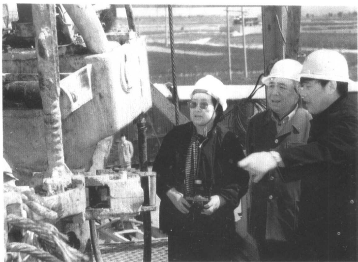
△ 1988年4月在中原油田调查研究