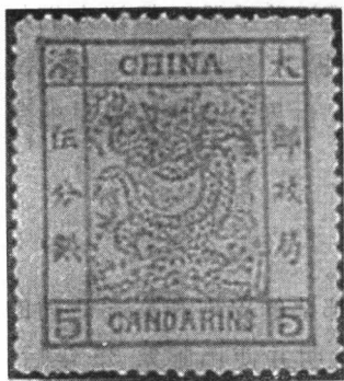
大龙阔边黄5分银新票

1866年,在海关总税务司署内设置邮务办事处,除递送各国领事馆的信件外,也负责中国各海关间的文件传送。开始只规定了邮资和加盖邮戳等,没有实行贴用邮票的制度,后来邮政业务进一步扩大,才感到有发行邮票的必要。