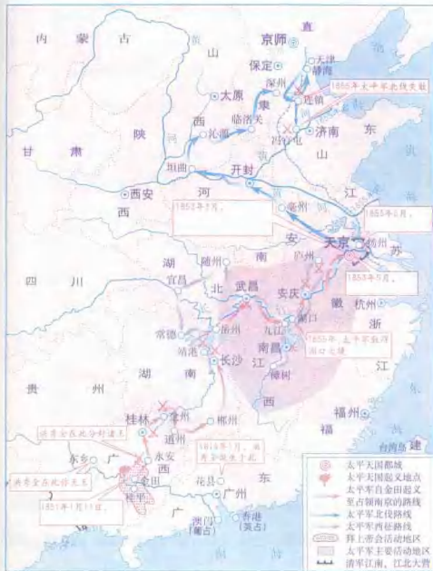
太平天国前期形势