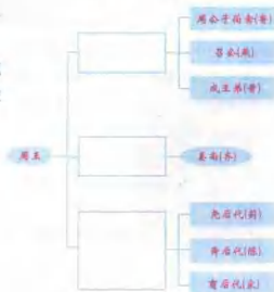
西周分封诸侯分类示意