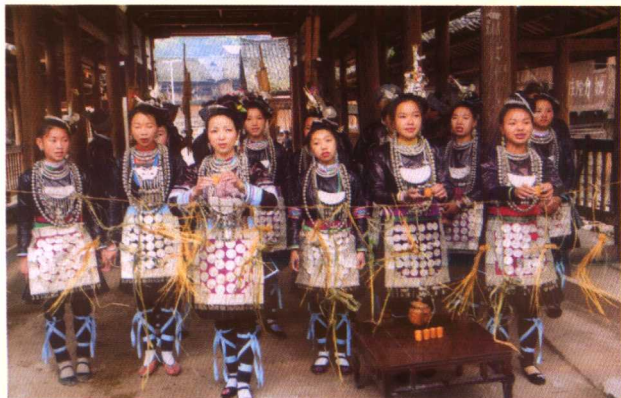
从江小黄拦路