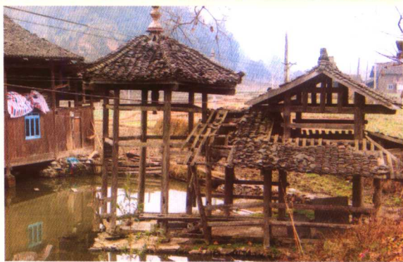
黎平口寨水井 (侗族地区古老的水井之一)