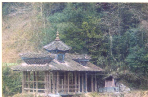
侗族地区较早的风雨桥位于黎平高近村