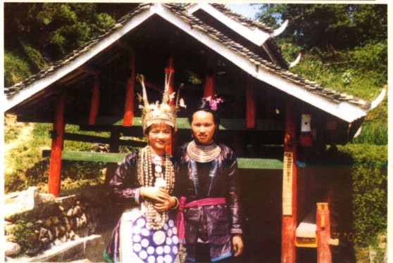
贵州从江高增寨的侗族姑娘