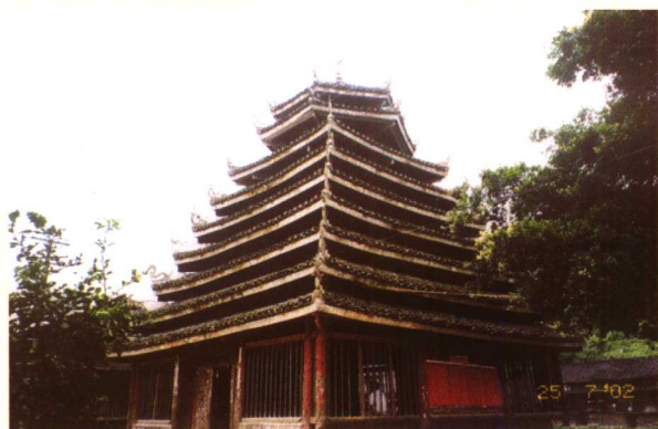
广西三江马胖鼓楼