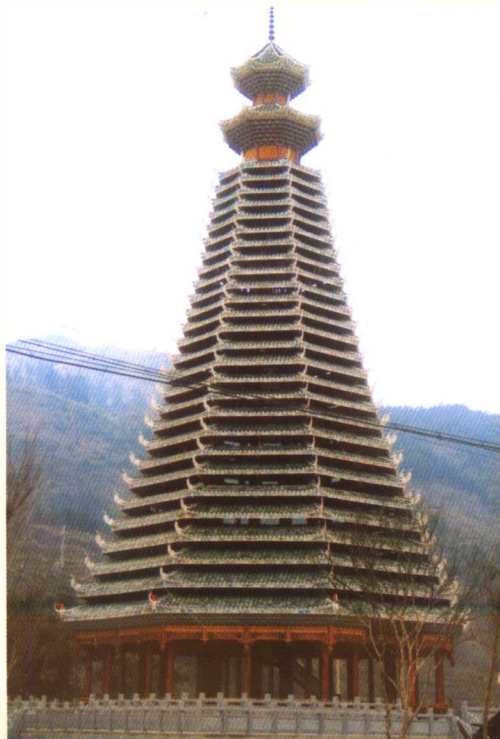
从江鼓楼（目前侗族地区最高的鼓楼）