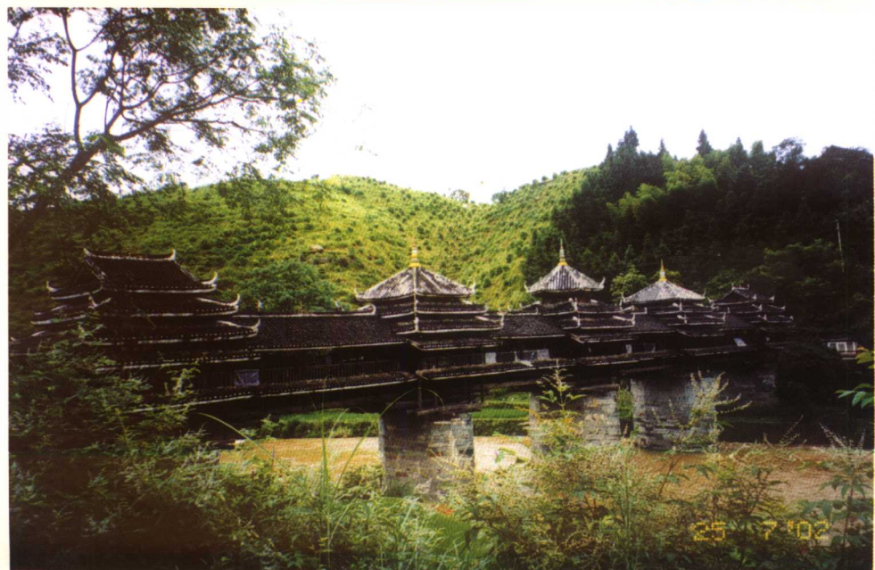
广西三江程阳风雨桥