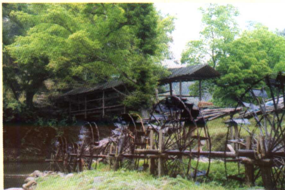
水车 (中国西部生态文化工作室供稿)