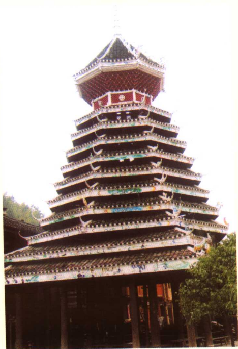
黎平肇兴鼓楼之一