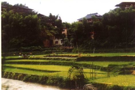
广西三江林溪田园风光