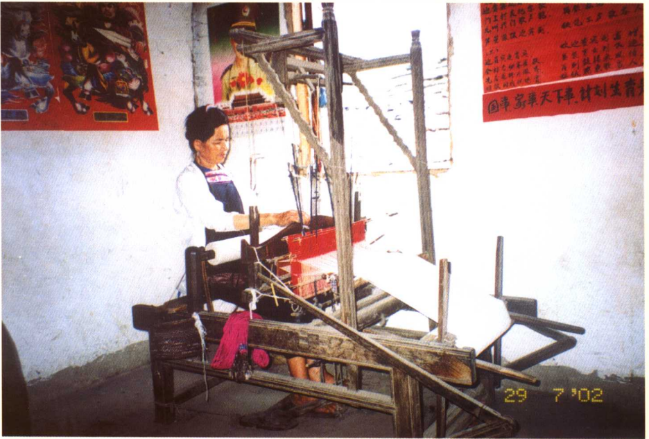
贵州从江高增寨的纺织