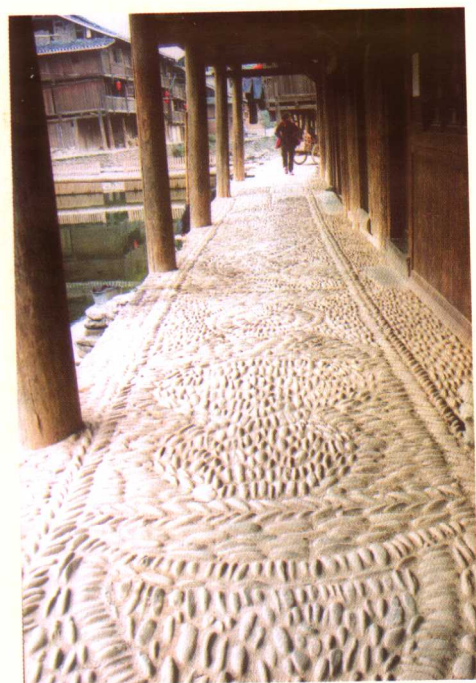
黎平肇兴鹅卵石花路