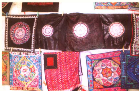
成为工艺商品的背带盖