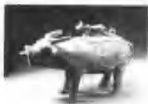
春秋穿有鼻环的牛尊