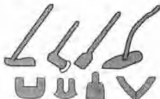
战国时期的铁制农具