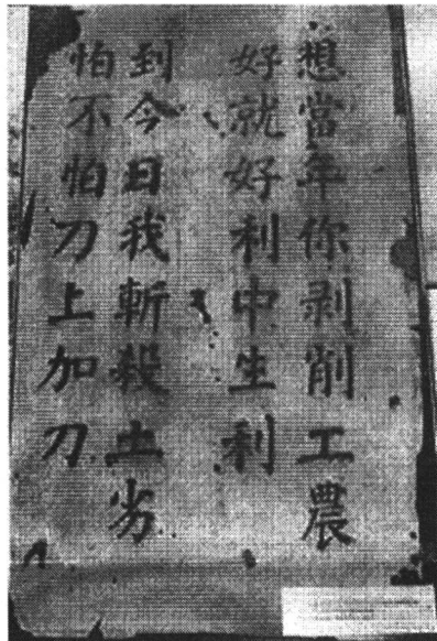
图 1-2 遂川县工农兵政府的标语

井冈山地处湘赣边界罗霄山脉中段，介于湖南酃县和江西宁冈、遂川、永新四县交界处，总面积约 4000 平方公里（参见图 1-1）。大革命时期，这几个县都建立了党的组织和农民自卫军，群众基础比较好；山上的茨坪、大小五井等地都有水田和村庄，周边各县的农业经济亦有一定基础，部队筹款筹粮具备较好的物质条件。最重要的是这里交通不便，距离国民党统治的中心城市比较远，加之湘赣两省军阀之间存在矛盾，敌人的统治力量相对比较薄弱。崇山峻岭中，地势险要，森林茂密，只有几条狭窄的小路通往山内，易守难攻，具备建立革命根据地的最为理想的地理条件。在敌我力量悬殊的条件下，精明智慧的毛泽东选择了一块理想的落脚点。