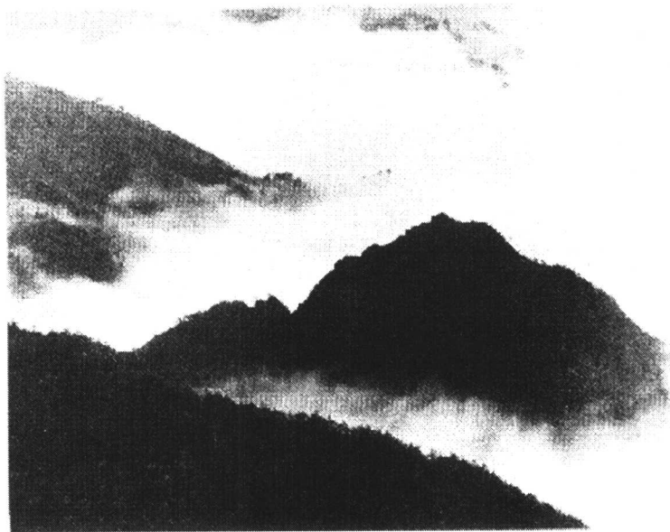
图 1-1 井冈山五大哨口之一——黄洋界，位于茨坪西北面