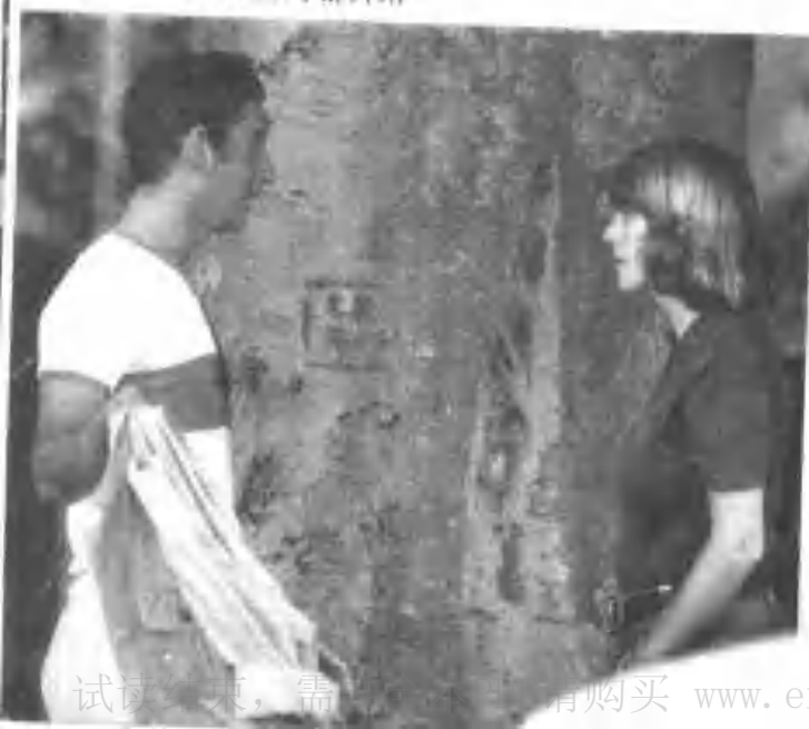
▼ 查理王子于马球赛后，与友人卡蜜拉共享宁静片刻