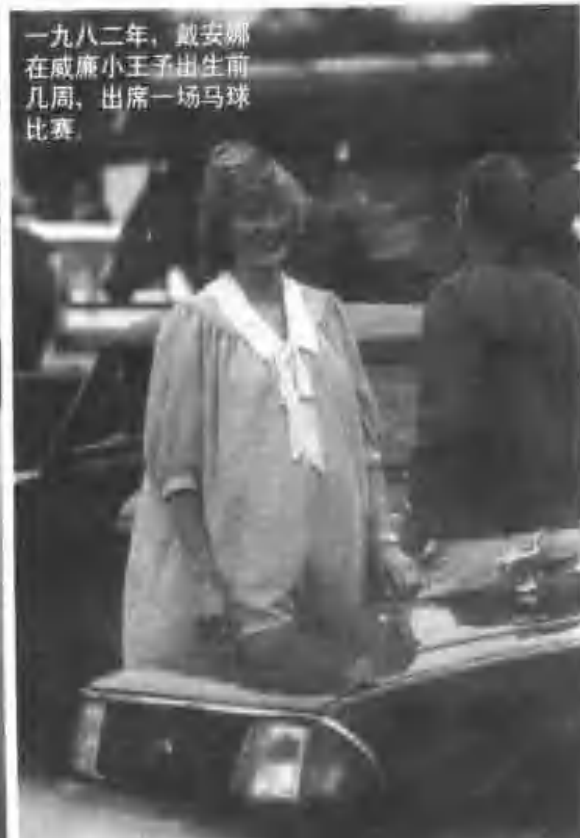
一九八二年，戴安娜在威廉小王子出生前几周，出席一场马球比赛。