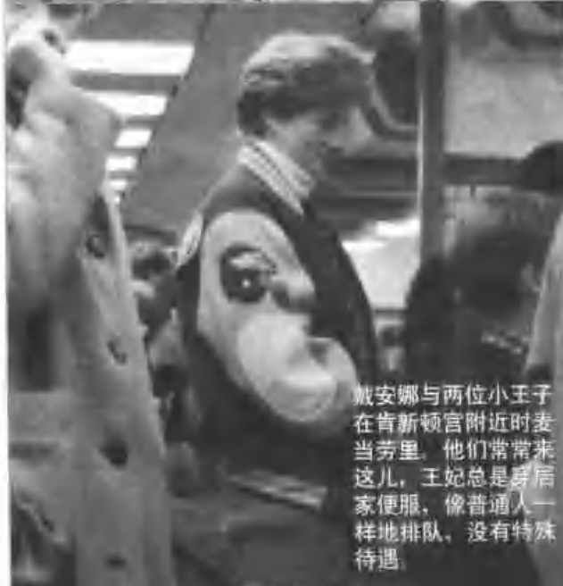
戴安娜与两位小王子在肯新顿宫附近时麦当劳里，他们常常来这儿，王妃总是穿居家便服，像普通人一样地排队，没有特殊待遇。