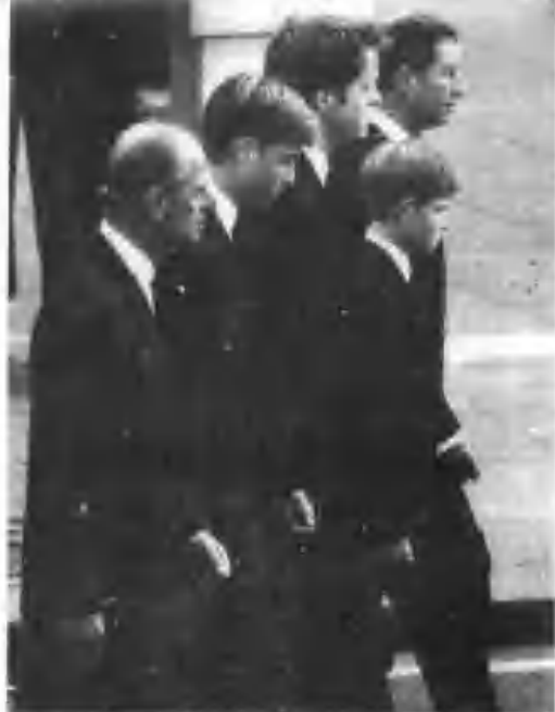
查理期王子(左起)亨利王子、戴妃弟弟、威廉王子及皇天爱丁堡公爵，陪着戴妃前往西敏寺。