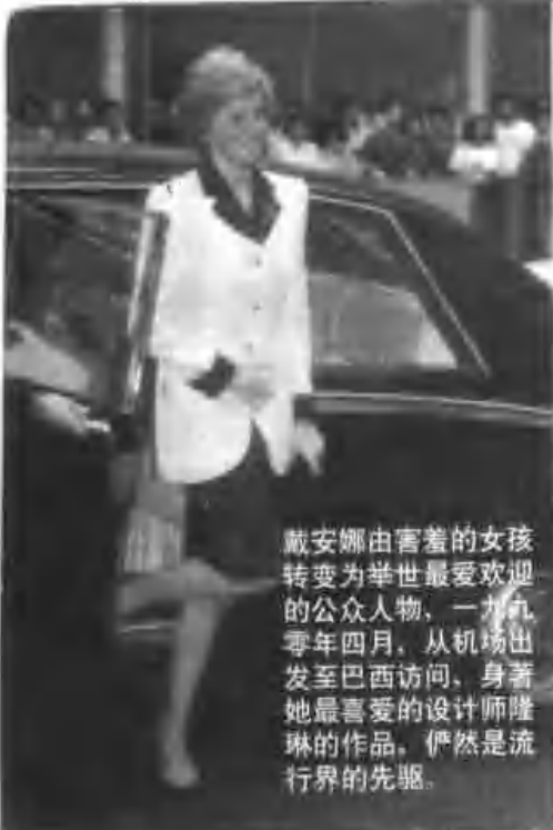
戴安娜由害羞的女孩转变为举世最受欢迎的公众人物，一九九零年四月，从机场出发至巴西访问，身著她最喜爱的设计师隆琳的作品，俨然是流行界的先驱。