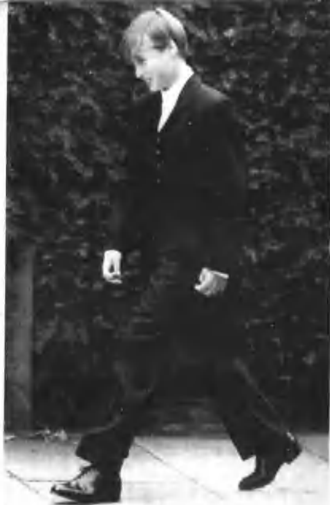
穿上传统英式燕尾服的威廉王子，十足一个小绅士的模样。