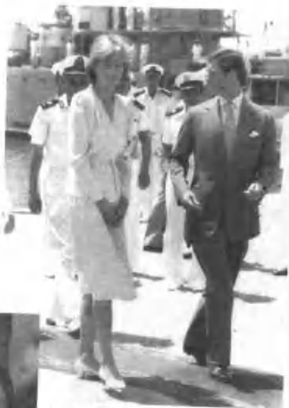
▲ 抵埃及展开蜜月旅行的另一程。