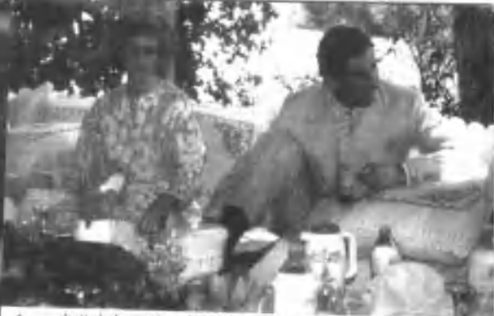
▲ 一九八九年三月，查尔斯夫妻出席阿拉伯王公安排的骆驼竞赛，对这种官方活动，一旁的戴安娜显得与致索然。