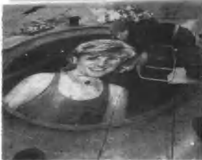
一名画家在伦敦一条街道上，把戴妃的肖像绘画在路面，以示悼念。