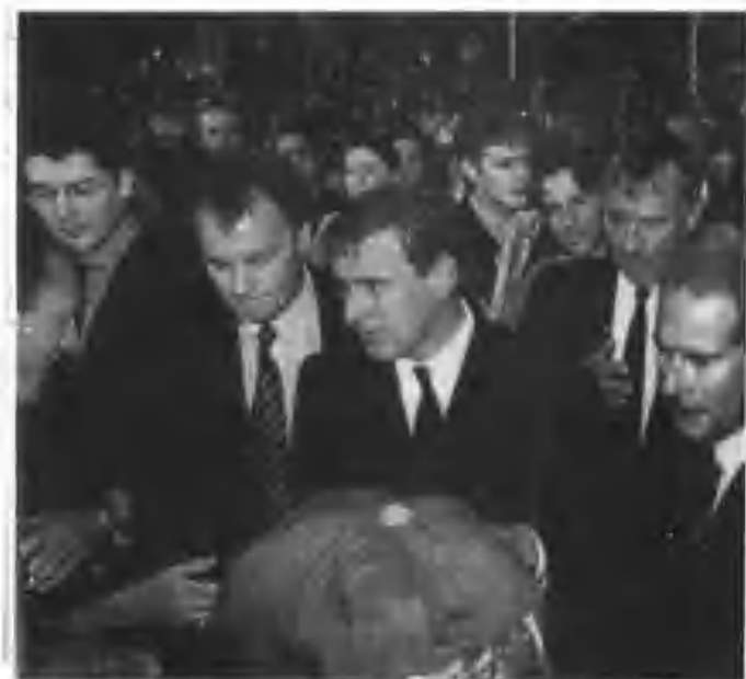
约克公爵(左三)及爱德华王子(左四)大白金汉宫外被前来悼念戴妃市民簇拥。