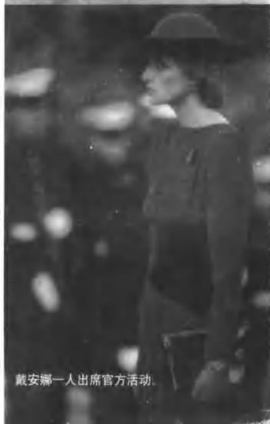
戴安娜一人出席官方活动。