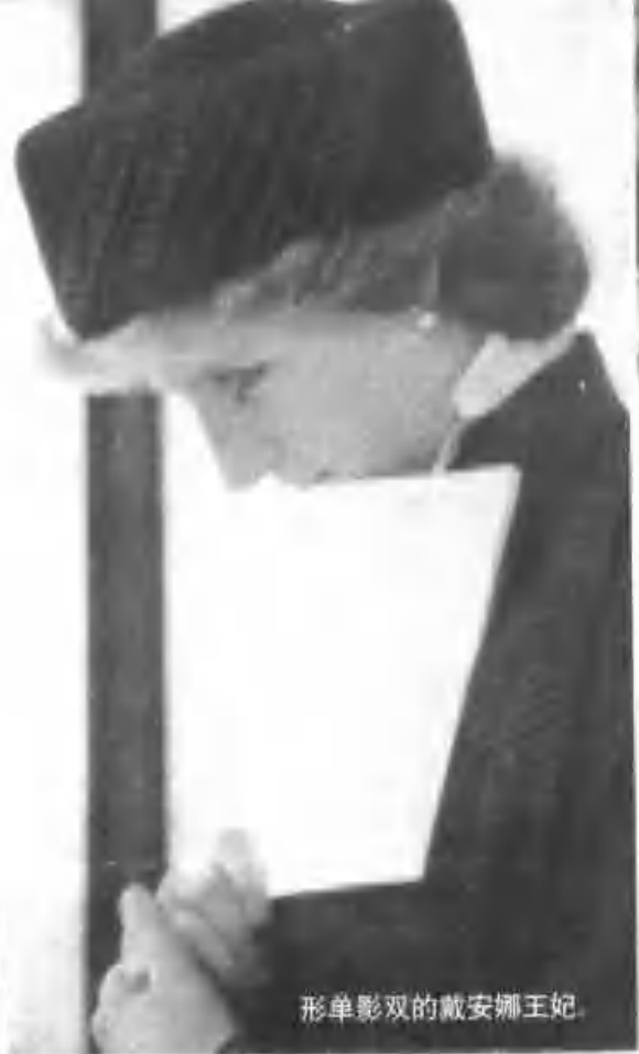
形单影双的戴安娜王妃。