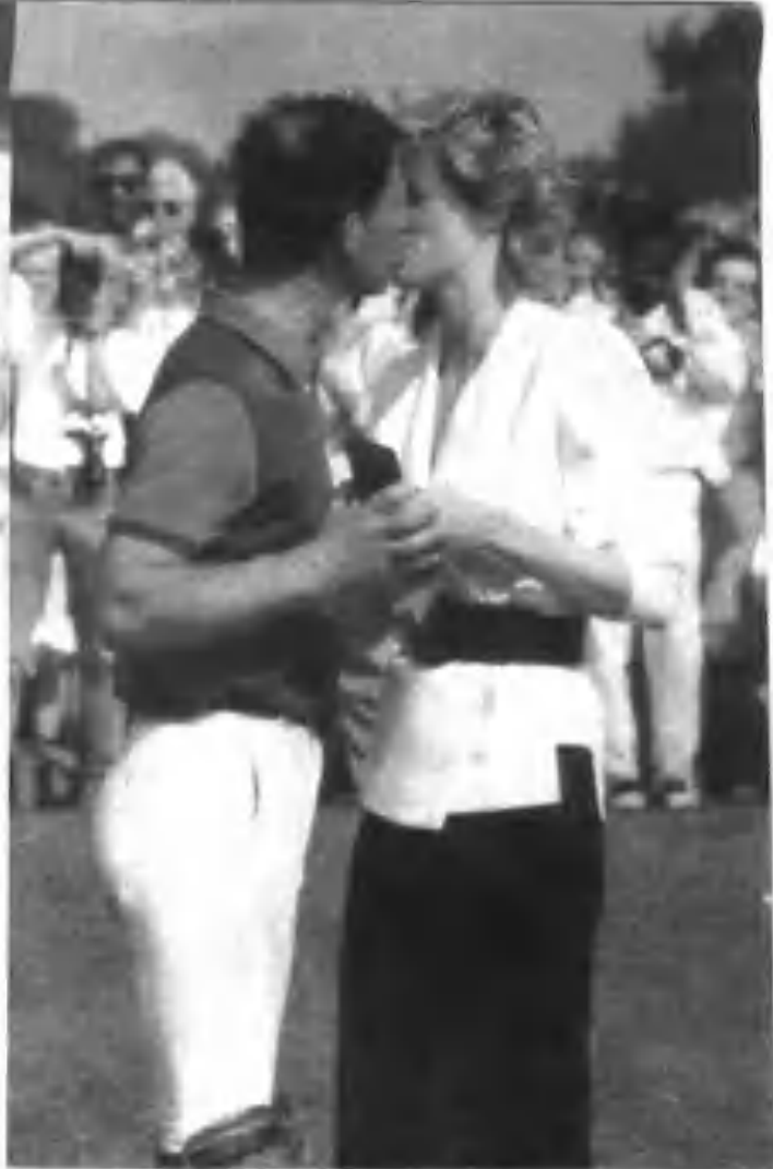
▲ 一九八六年六月一场马球赛后，戴安娜颁奖给查尔斯，并与他亲吻。