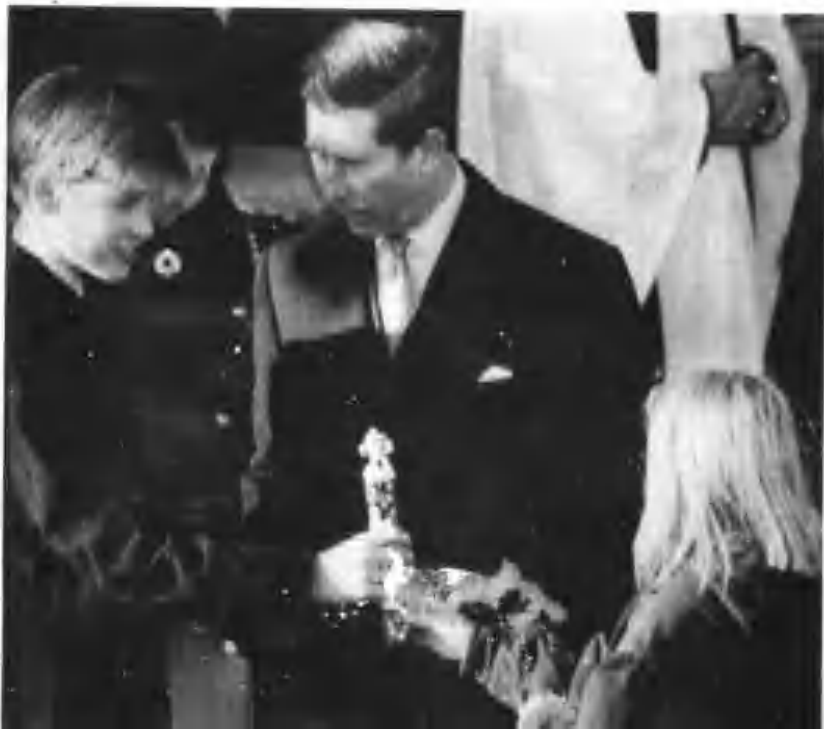
九五年在圣诞节，风度翩翩的威廉王子接受一名仰慕他的女孩的礼物。