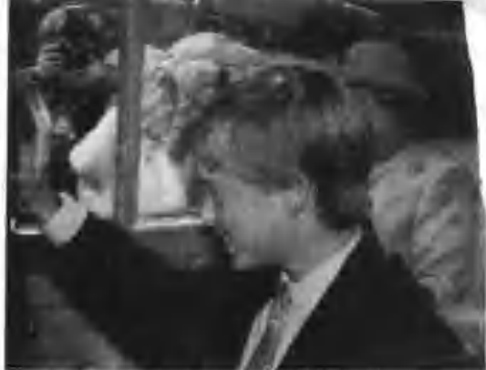
威廉王子每次出现均有很多Fans向他呼喝采。