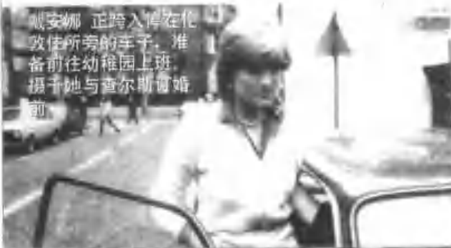
戴安娜正跨入停在伦敦住所旁的车子，准备前往幼稚园上班。摄于她与查尔斯订婚前。