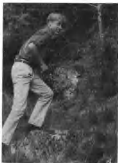
威廉王子除了学业成绩超卓也是一个运动能手。