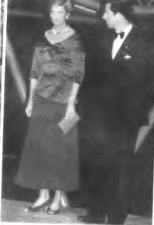
▲ 一九九一年十月在多伦多官方拜会活动。