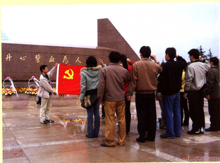
研究生党员在龙华烈士陵园进行宣誓活动