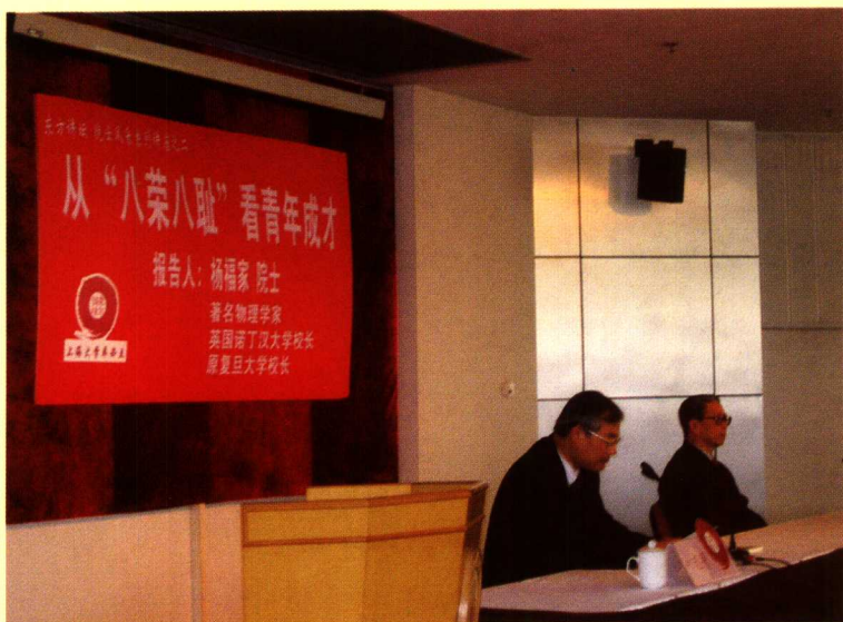
研究生聆听杨福家院士“从‘八荣八耻’看青年成才”主题报告 上海大学党委副书记、常务副校长周哲玮教授(左),英国诺丁汉大学校长 杨福家院士(右)。