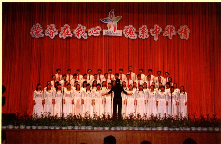
研究生高唱“八荣八耻”歌