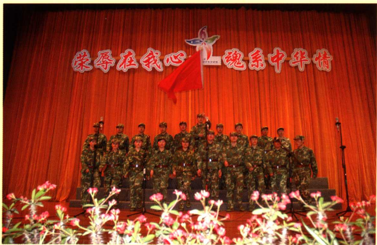
土木系的“游击队”在号角中冲锋、在歌声中战斗