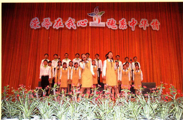
数码学院研究生合唱团以活泼的形式送来了温暖