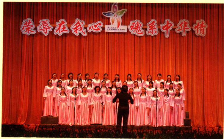
外国语学院“娘子军”以别样中英版本结合的《歌声与微笑》唱出了水平