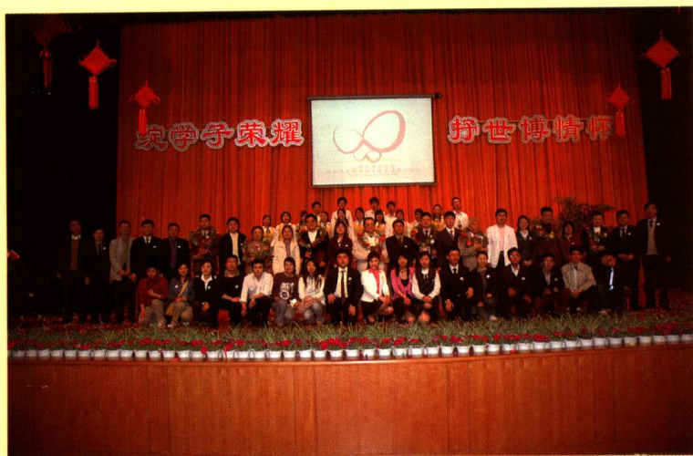
研究生与社会英雄楷模共践社会主义荣辱观大型晚会