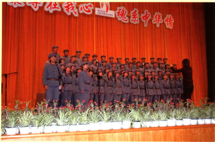
文学院研究生合唱团唱出了军人的气势