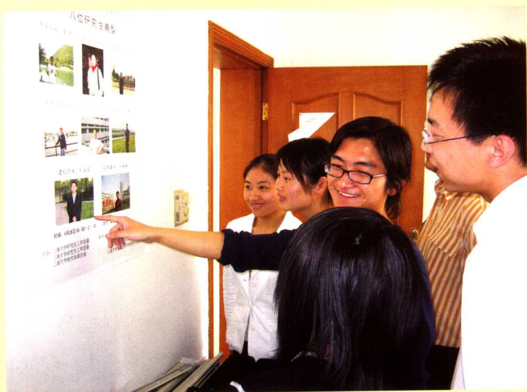
研究生热烈讨论评选出的八位研究生先进典型