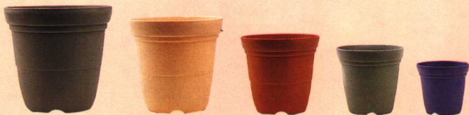
各种尺寸的标准盆器