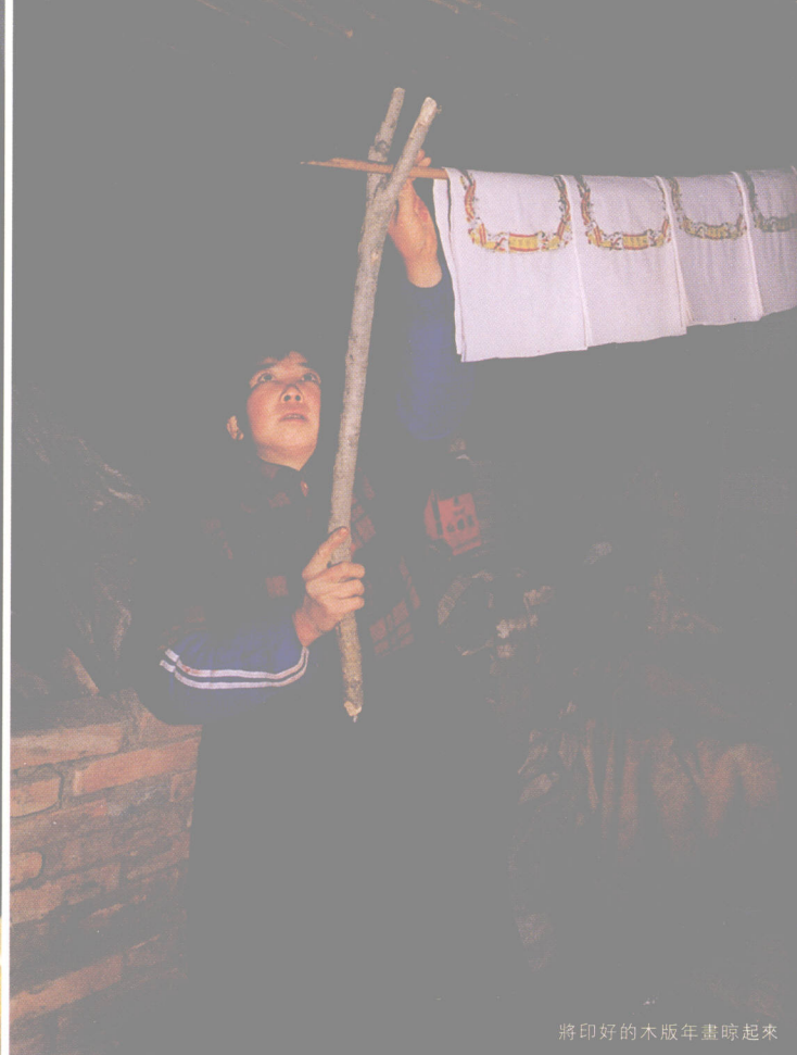
將印好的木版年畫晾起來。