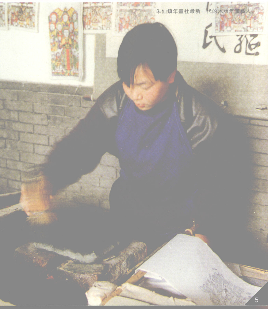
朱仙鎮年畫社最新一代的木版年畫藝人