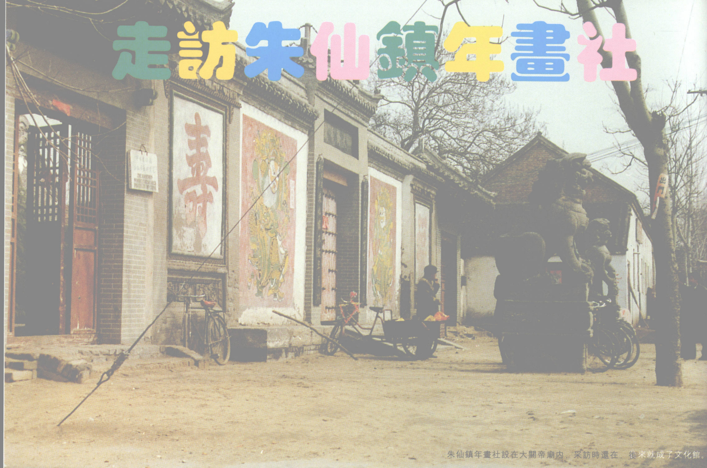
朱仙鎮年畫社設在大關帝廟內。採訪時還在，後來就成了文化館。

解放後，朱仙鎮年畫曾經幾度升沉起落。到了“文革”時期，傳統木版年畫遭受滅頂之災，許多珍藏的古版連同年畫一道作為“四舊”化為灰燼。“文革”後恢復了好幾家朱仙鎮年畫社，正宗的祇有朱仙鎮這一家。