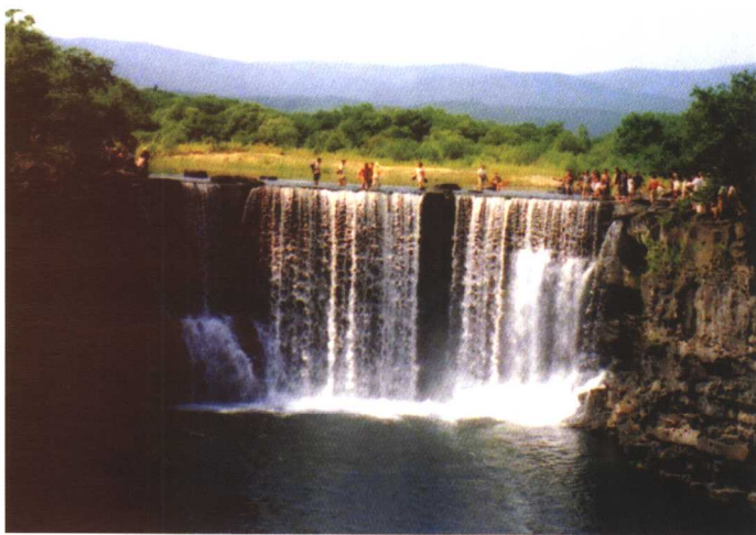
画面中垂直的水流给人以流动的感觉 姜述业摄于镜泊湖