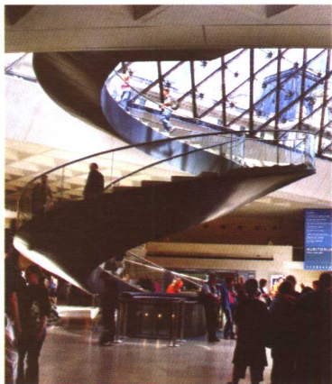
旋转的楼梯以曲线条展示于人