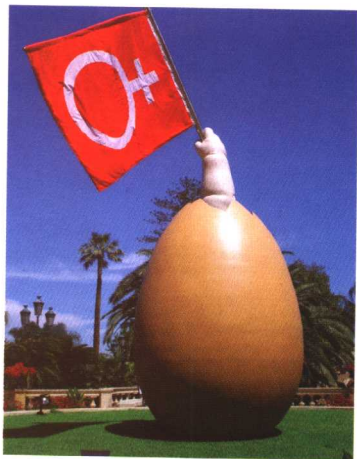
对表现一个蛋形的雕塑，关键是形状

通过取景框去观察周围景物的那一刻起，我们就在有意识地组织画面。虽然任何一幅影像都是由形状、线条、质感、明暗、色彩视觉要素结构而成的，但是在表现某一景物特性时，形状、线条、质地、明暗、色彩等这些视觉要素并不是同时出现的。例如，要着重表现天空时，关键的是色彩；对表现一个鸡蛋而言，重要的是形状；当表现白雪时，质感则占了主要地位。