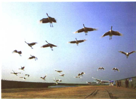
影调的对比，突出了主体的形状 作者摄于齐齐哈尔扎龙

如果在一幅组织好的构图中存在着任何不恰当或干扰成分，观众便会感觉画面不够协调。观察画框的周边部位，以确保没有任何不想要的成分侵入画面，或者没有任何重要的成分超出画框。