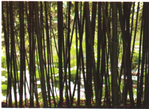
竹林形成的实线条给人以幽静之感 作者摄于北京紫竹院