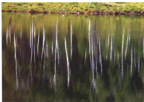
水中细细白桦树的倒影显现出线条的纤弱

画面上的线条有粗、细、曲、直、浓、淡、虚、实之分。不同的线条不仅可以构成不同的图形，而且因其粗细、曲直、浓淡、虚实之不同，能产生不同的艺术表现力。一般来说，不同线条给人的感受可以相对概括为：粗线条强、细线条弱；曲线条柔、直线条刚；浓线条重、淡线条轻；实线条静、虚线条动。