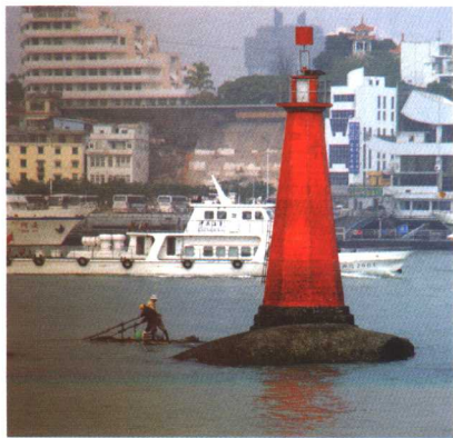
冷色的环境使粗粗的暖色水塔的线条分外醒目，粗线条的水塔控制了整个画面的稳定 作者摄于泉州