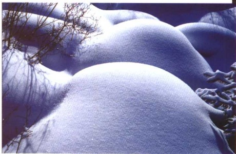
当表现白雪时，质感则占主要地位 作者摄于伊春大平台

另外，线条、形状、质感、影调、色彩这些视觉要素是相辅相成的、互相依存的，是能够任意组合的。一幅能使人赏心悦目的照片，无不是将视觉要素，如线条、形状、色彩、光线的有机结合。想要拍出一幅具有视觉冲击力的照片，就要从认识各种视觉要素开始。