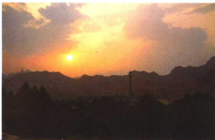
要着重表现天空时，关键的是色彩