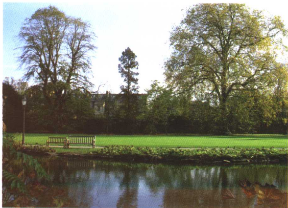
水平线占主导地位，加强了湖面的宁静感

照片中常见的水平线条一般都是地平线。水平线如果位于画面正中，将上下的空间一分为二，这种对等分割使画面上半部分明亮，下半部分阴暗。这种分割的画面显得平静、宽广。但是处理的不好，会使画面单调、乏味和呆板。在照片中，如果要表现某种宁静的感觉，就可在构图时让水平线条占主导位置。如果照片是全幅的，那么这种宁静将会更加强烈。