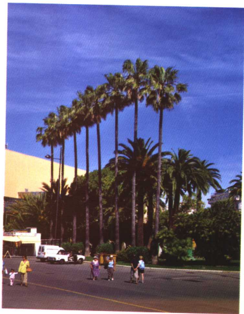
路旁那垂直挺拔的椰树形成的垂直的竖线条，有挺拔、高耸、向上的特征 作者摄于法国

垂直线条一般给人以坚定、庄重、沉着之感。垂直线在一定的空间内，与其他形式要素形成一定关系时，会产生一定的运动方向及较为具体的心理效应。