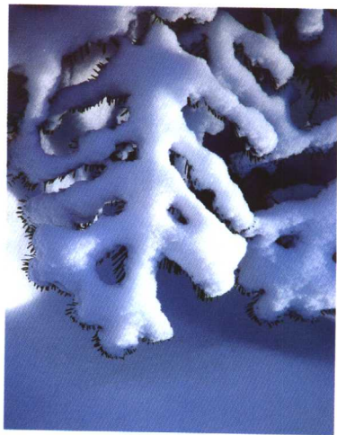
在自然界中，各种各样的形态，都是具有质感和色彩的