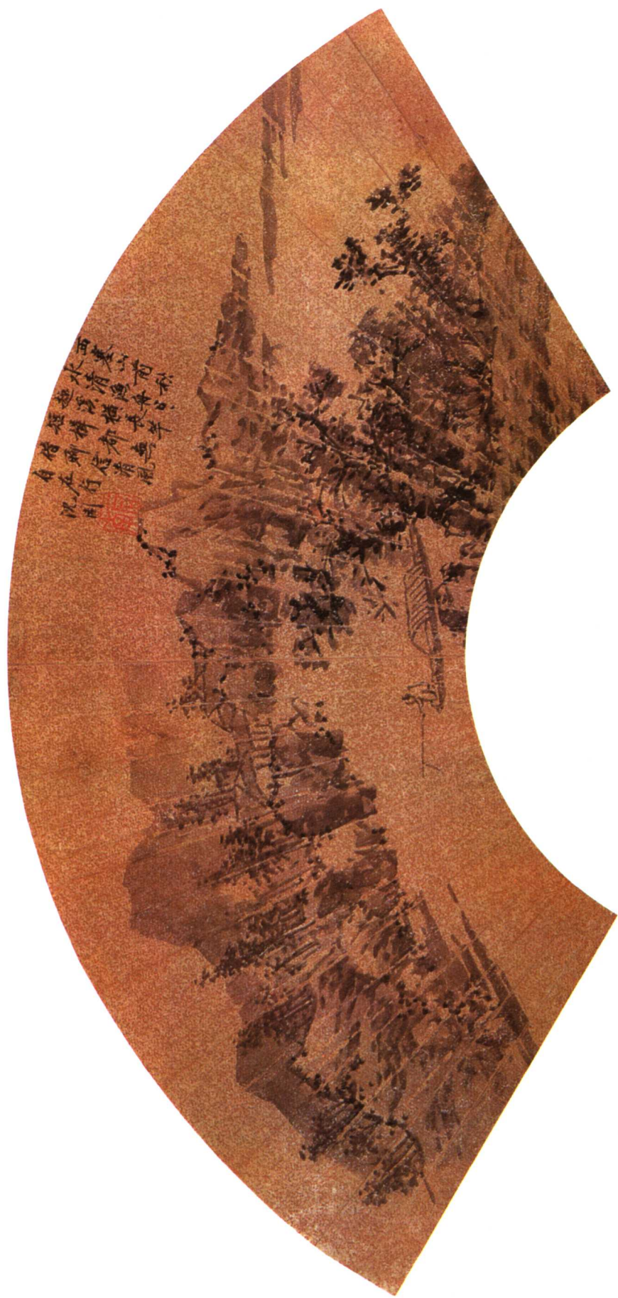
6 明 西塞渔舟图 沈周