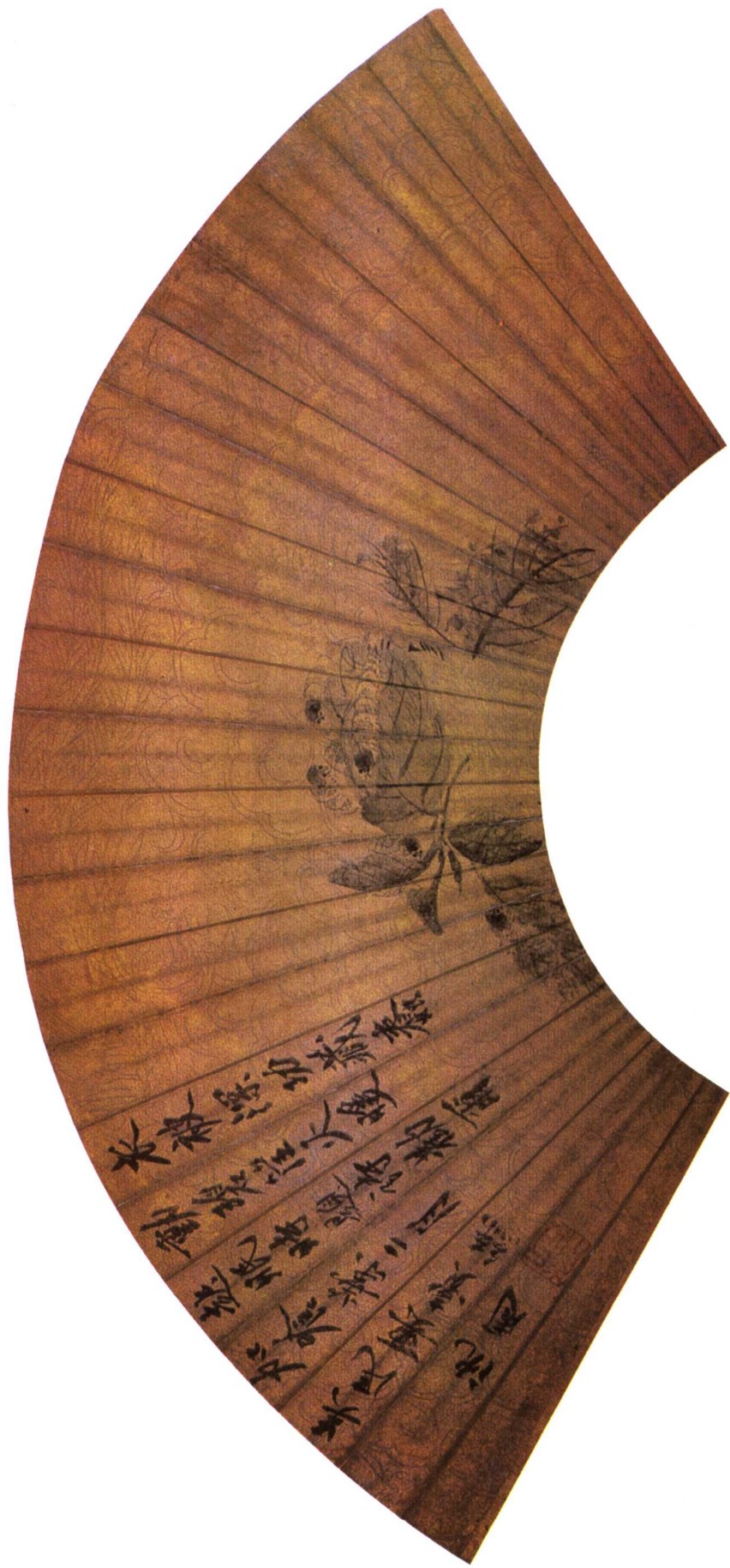
5 明 衣被深功藏图 沈周