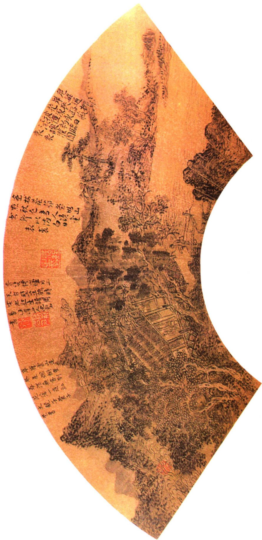
2 明 密树茅堂图 周 臣