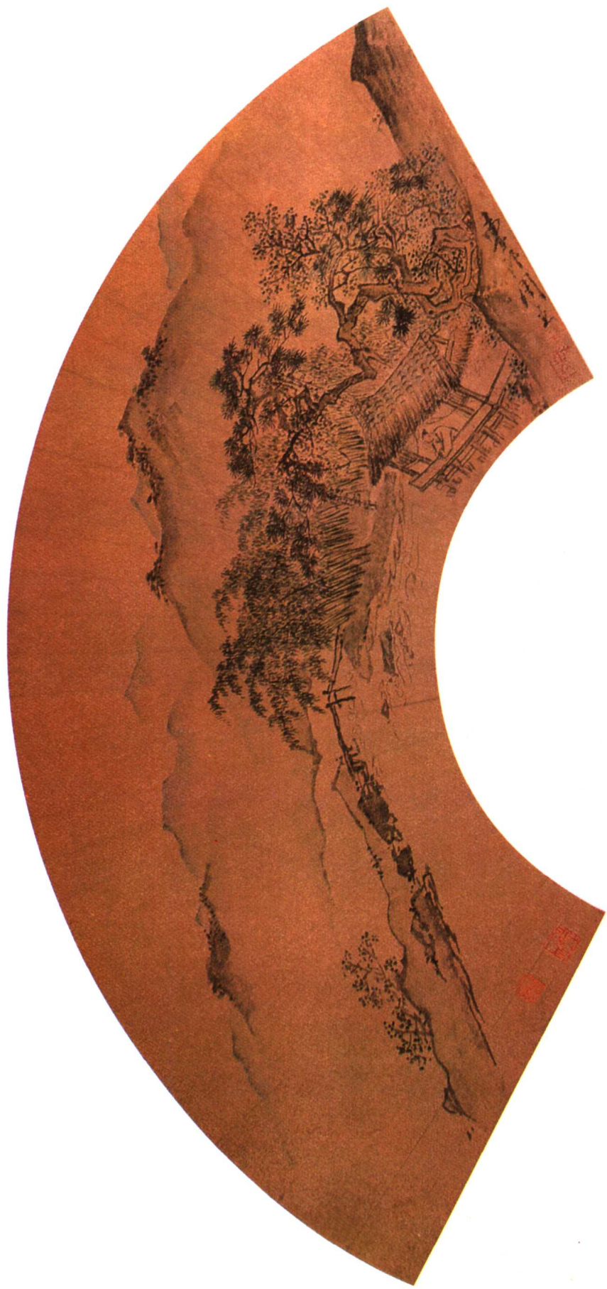
3 明 山水扇面 周臣