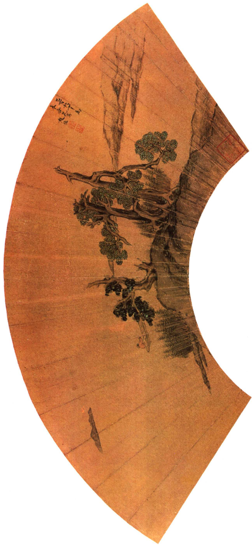
4 明 古木孤舟图 赵 佐