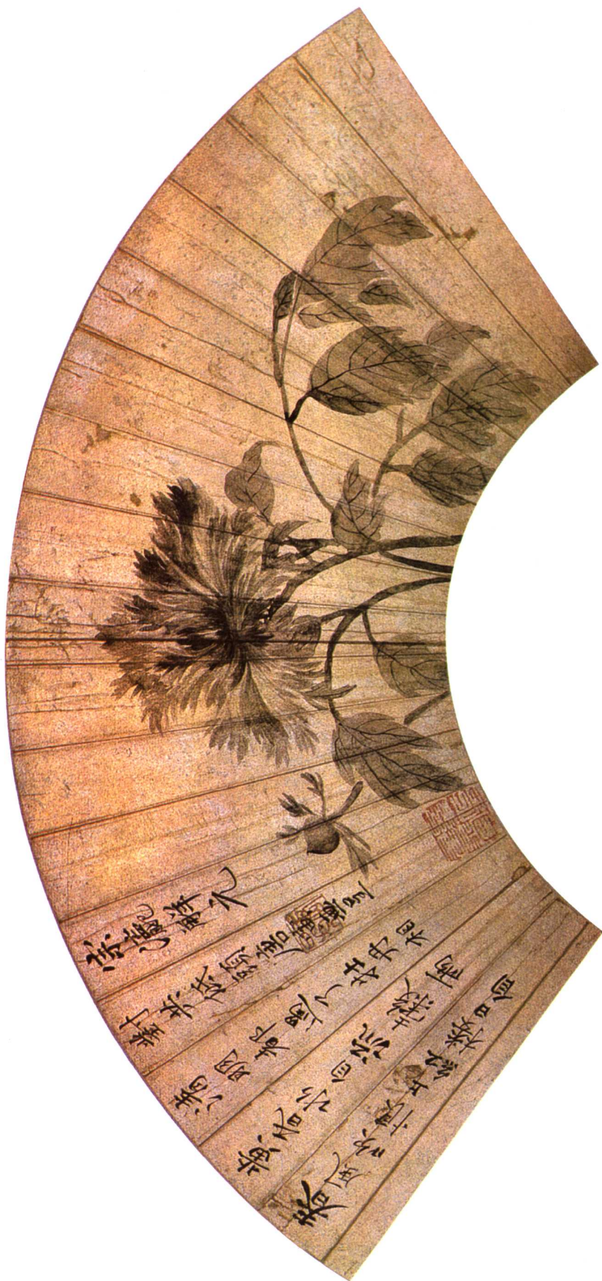
8 明 牡丹图 唐寅