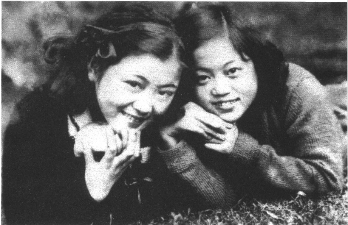
上官云珠(左)小时候在家乡与姐姐合影

“韦家有女初长成”。一眨眼的功夫，天资聪慧的小上官6岁了，她到了上学的年龄了。虽然当时女孩子上学还是很新鲜的事，但是给她取名“亚弟”的父亲还是把她送进了学校。来到这个新的环境中，小上官是如鱼得水。由于她悟性极高，不用花太多的功夫，就能把门门功课都考成优等。更叫人称赞的是，她把小时候学唱的戏曲也带到学校举办的文艺演出上。小小年纪的上官云珠往台上那么一站，无论是口齿清晰的朗诵，还是表情丰富的表演唱，她总能演得那么投入，仿佛她生来就属于舞台。上官云珠的表演不仅赢得了师生们的阵阵掌声，而且也让台下观看她演出的张大炎目瞪口呆，惊异万分。张大炎也是长泾镇人。他家住在长泾河南西街，