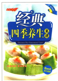
《经典四季养生菜谱》 定价:18.00元