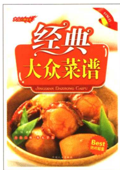
《经典大众菜谱》 定价:18.00元