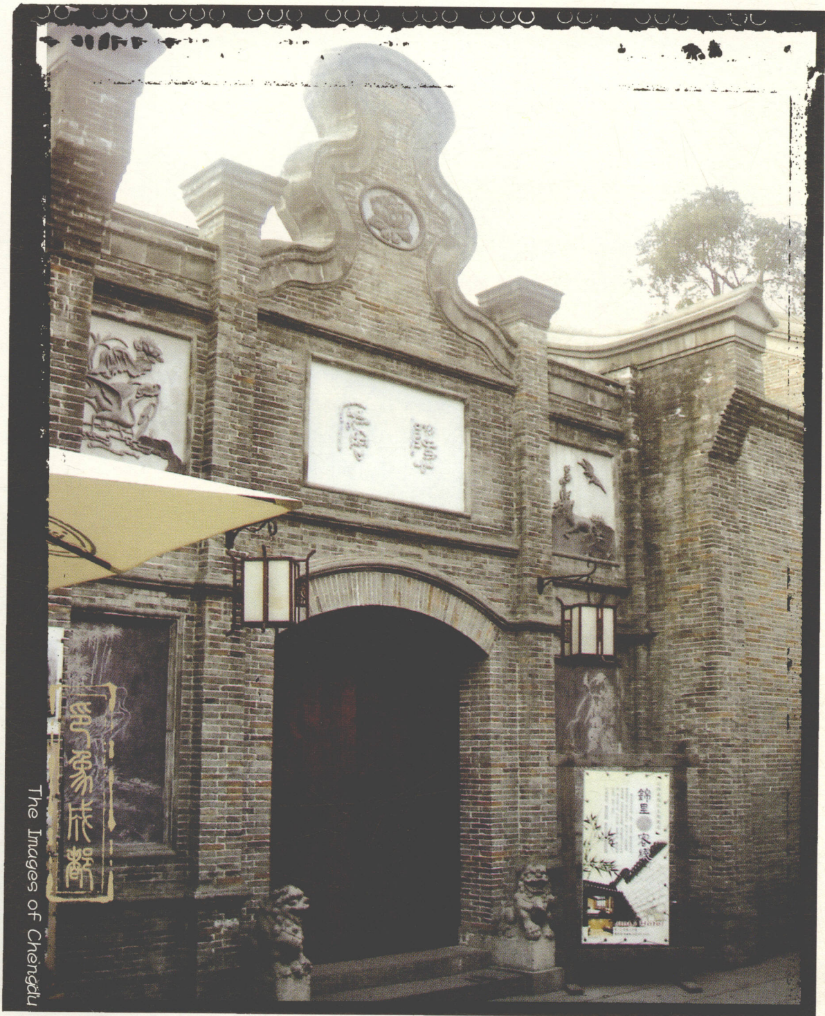
The Images of Chengde