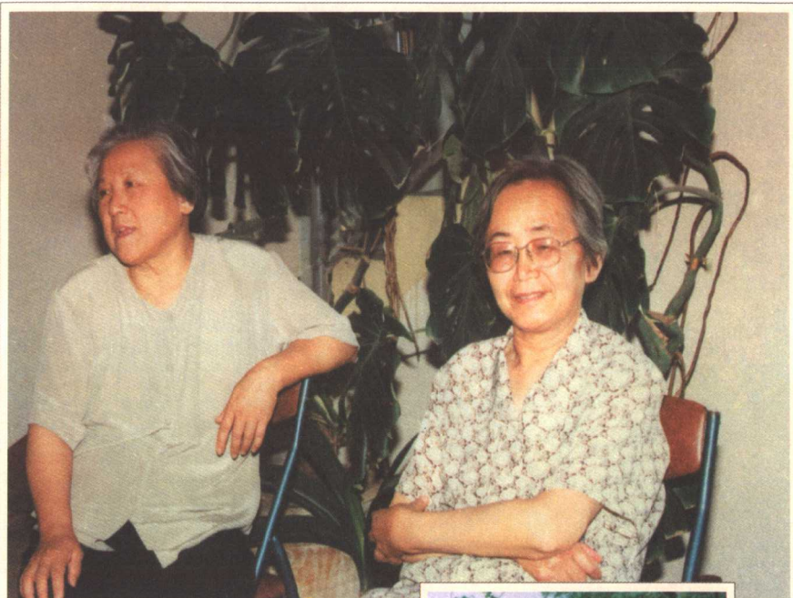
和老友聊天乃人生一大乐趣