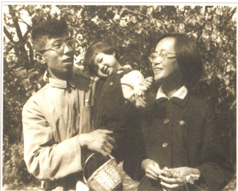
1965年的宽贵、我和珺儿在银川。那是个多么阳光灿烂鲜花似锦的日子！