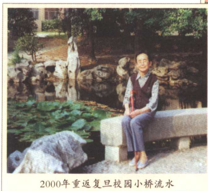
2000年重返复旦校园小桥流水