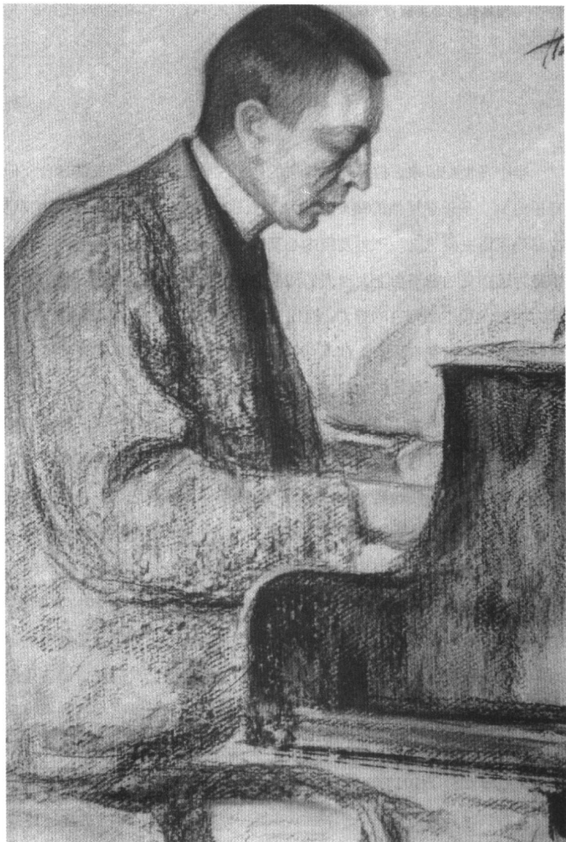
谢尔盖·拉赫玛尼诺夫。于1916年。画的作者：莱奥尼德·帕斯特纳克。（莫斯科，特莱蒂亚科夫画廊）