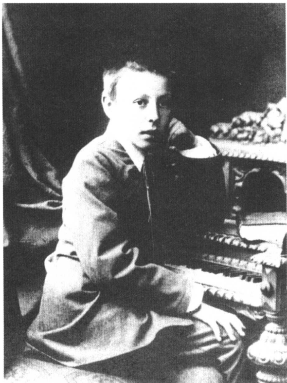
七岁的谢尔盖是一个怕生而多疑的男孩。他倔强地拒绝一切外界的帮助,别人送他一个外号“雅莎姆”(俄语音译,意思是“独行侠”)。

1873—1880年:对于昵称是“谢利奥加”的谢尔盖来说是晴空万里的几年。他非常爱恋他的父亲,因为父亲是第一位唤醒他音乐天赋的人。七岁时,拉赫玛尼诺夫就能不用乐谱满腔热情地弹奏舒伯特的浪漫曲。这一点让大家都吃惊。因此,瓦西里夫妇决定给他请一位钢琴老师。安娜·奥尔纳茨卡娅教了他两年。当他轻松愉快地获取了钢琴的基础技巧并且进行了基本的视