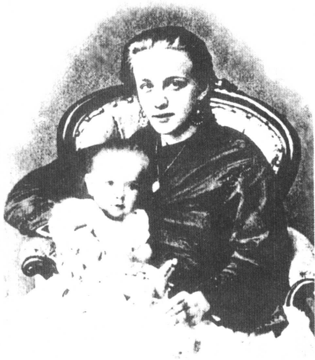
莉奥波夫·拉赫玛尼诺夫（和谢尔盖一起）给了音乐家启蒙教育。她大概跟安东·鲁宾斯坦学过钢琴。

很多俄罗斯贵族家庭一样，拉赫玛尼诺夫家族也非常喜欢音乐，并且经常举行家庭音乐会。莉奥波夫钢琴弹得相当不错，完全可以胜任对谢尔盖的钢琴启蒙教育。瓦西里的父母和祖父母都是音乐家：他的父亲（即音乐家的祖父）阿卡蒂是家族特殊的荣耀，因为阿卡蒂从前与著名的约翰·菲尔德共同学习过。瓦西里本人也是一位业余钢琴家。谢尔盖在奥涅格的童年时光是在瓦西里的钢琴独奏音乐会中度过的。瓦西里为了让他的孩子们高兴，还会穿上音乐会演出服，下午还总会有一些诸如歌剧、流行歌曲和即兴演奏之类的演出。拉赫玛尼诺夫在追思快乐的