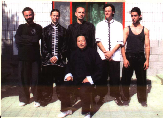
和希腊学生的合影