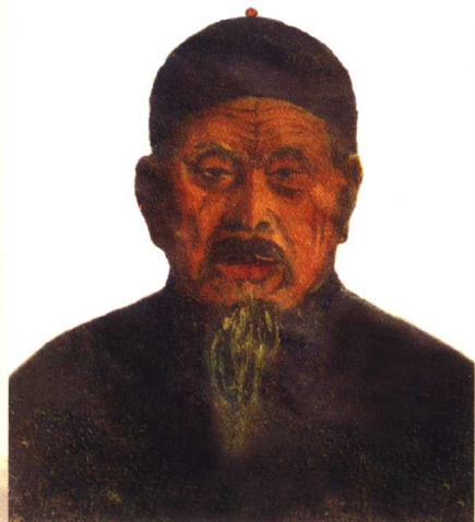
作者的师父国砚田