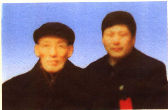
与武术大师李天骥合影