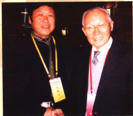
与太极拳名家、中国人民大学教授李德印先生合影