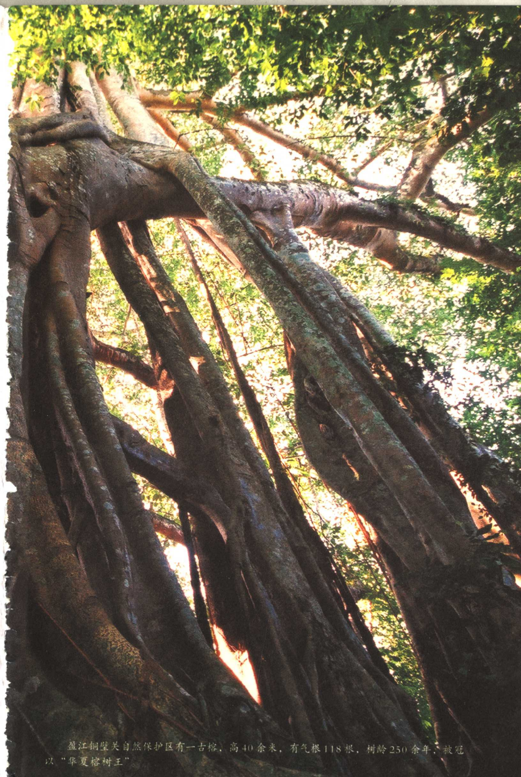
盈江铜壁关自然保护区有一古榕，高40余米，有气根118根，树龄250余年，被冠以“华夏榕树王”。