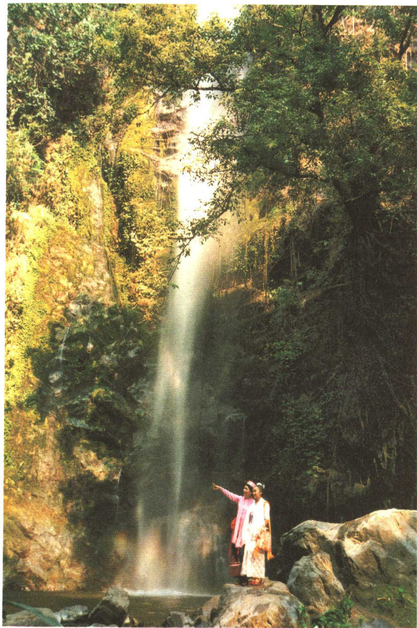
隐居于热带雨林中的莫里瀑布，“不用弓弹花自散”。