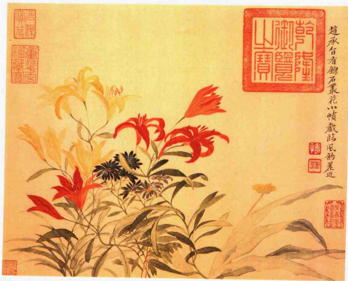
摹古册 清 恽寿平 绢本 (之一) (26.2×33.3cm)