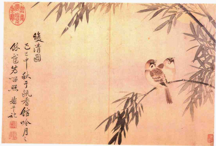
花卉册 清 恽寿平 绢本 (之一) (28.5×43cm)