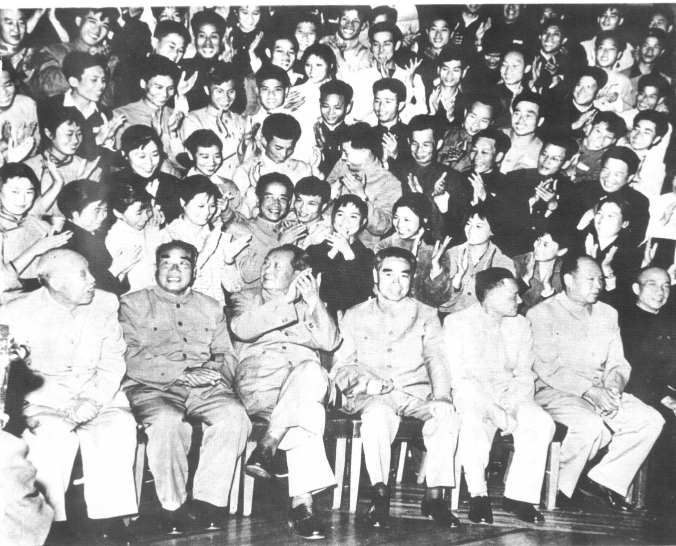
1965年毛泽东、周恩来、朱德、邓小平、彭真等同志接见内蒙古自治区乌兰牧骑巡回演出队（其中有赤峰市乌兰牧骑队员）