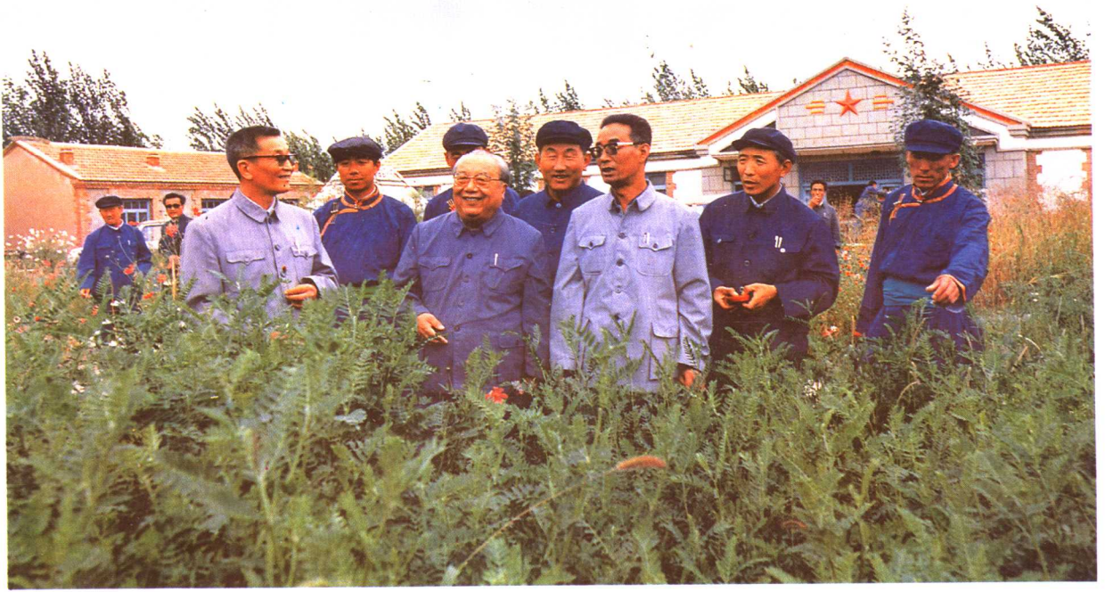
全国政协副主席费孝通同志在赤峰考察