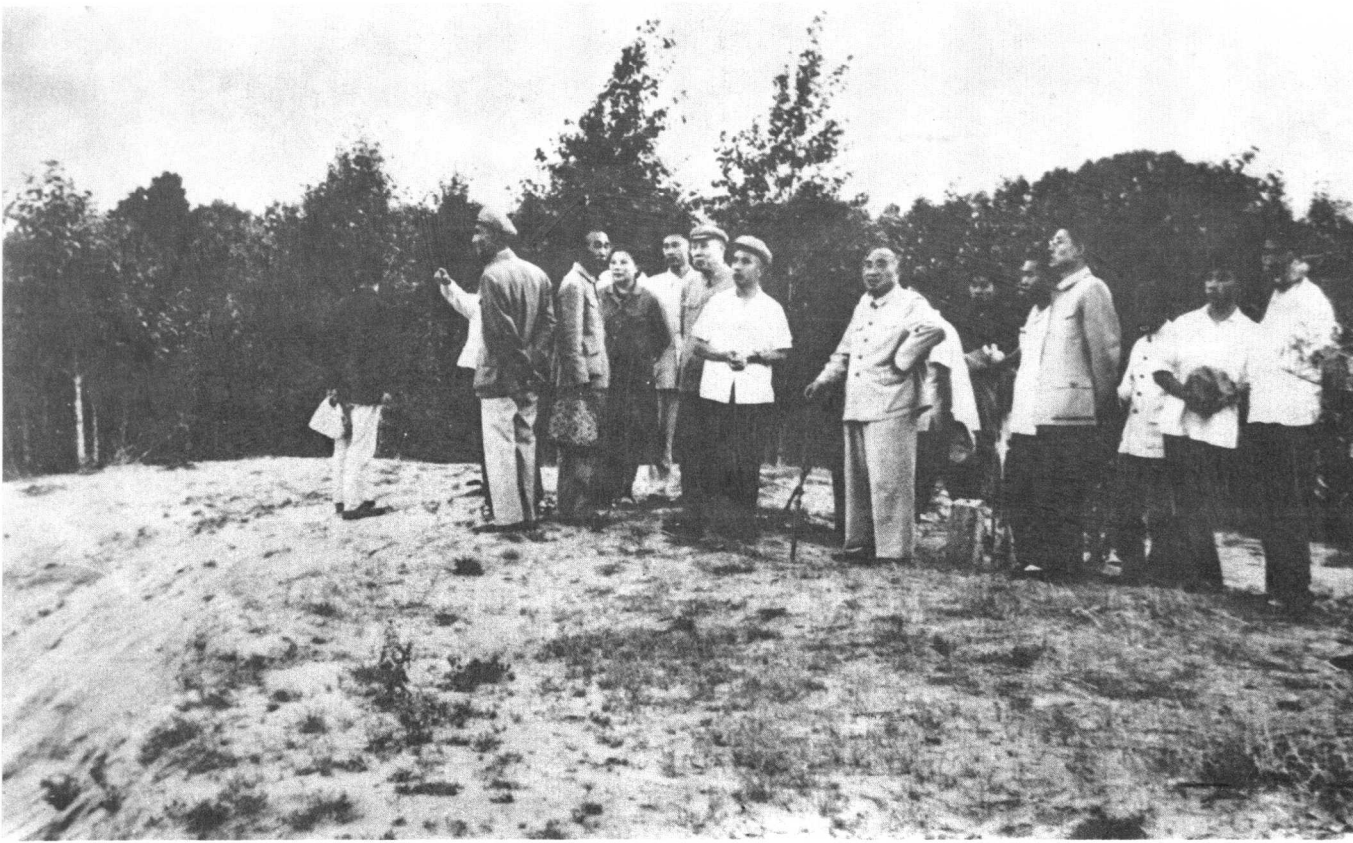
1964年朱德、董必武同志视察赤峰