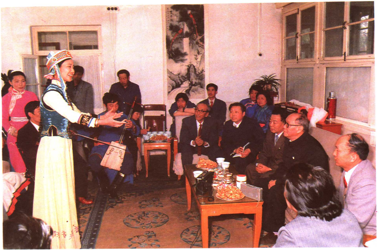
乌兰夫同志接见赤峰民族歌舞团