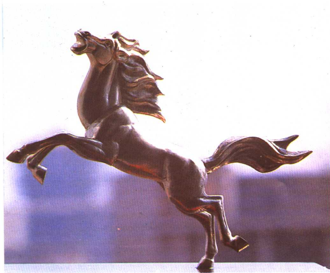
赤峰市区连续五年被评为自治区先进卫生城， 获阿吉奈奖