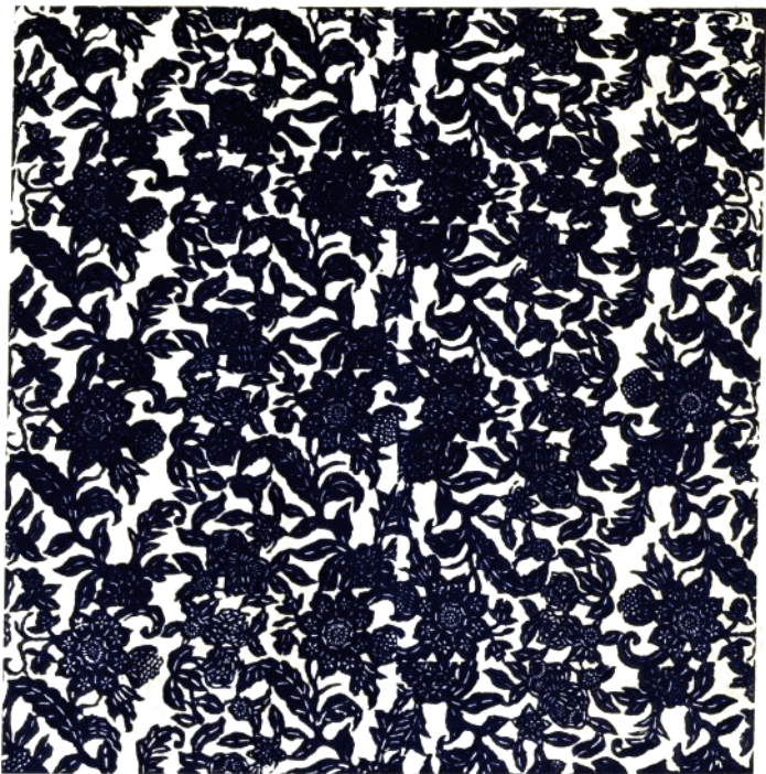
9 百 日 菊 (花布) 平江县