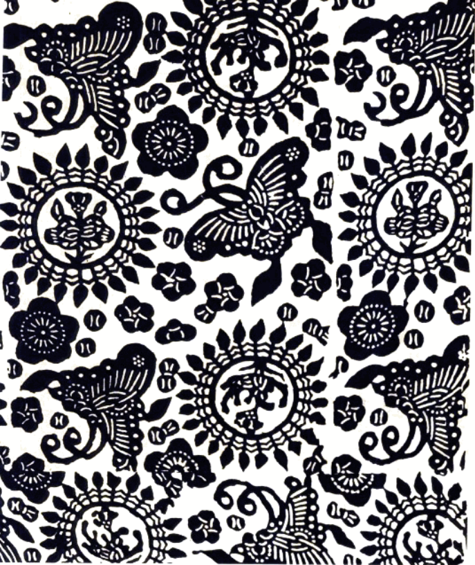
12 百蝶图 (花布) 常德市