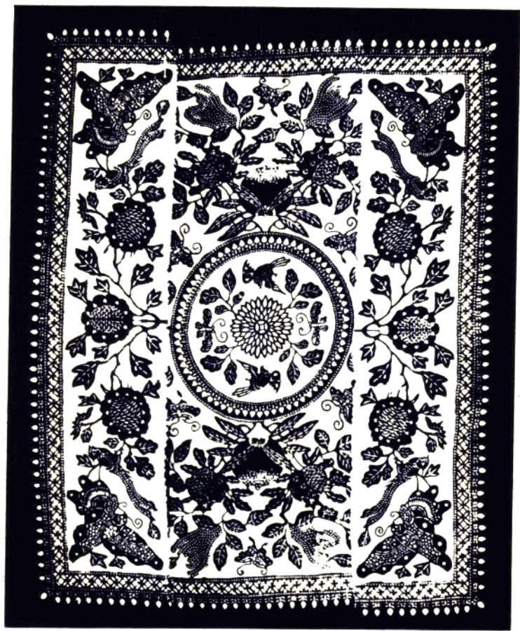
6 三 多 图 (被面) 常熟县