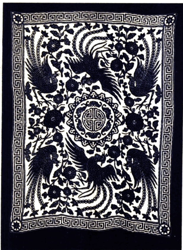
4 凤穿牡丹 (被面) 凤凰呈