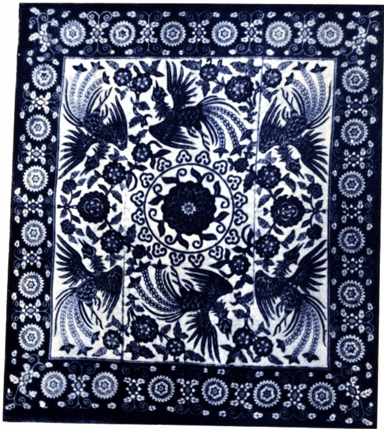
1 凤穿牡丹 (被面) 常锦县