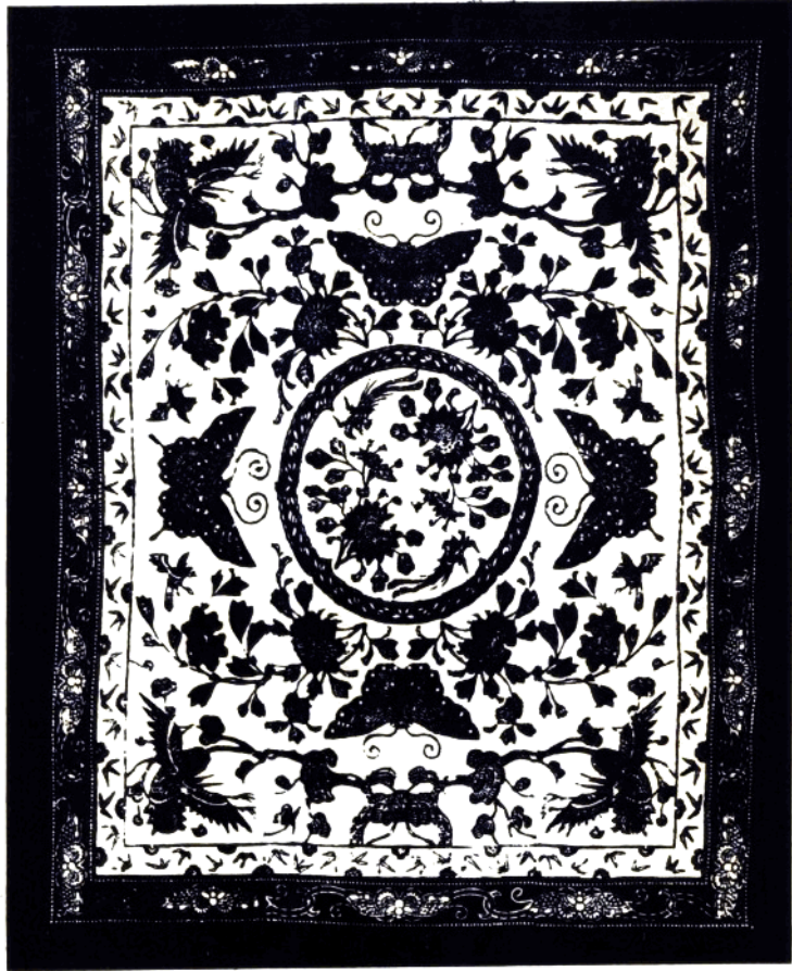
7 松鶴图 (被面) 常盤县