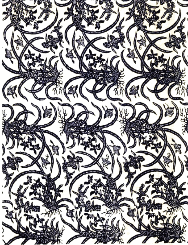
5 清香園 (縐布) 州明县