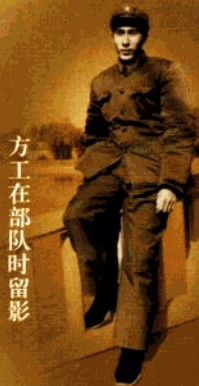
方工在部队时留影