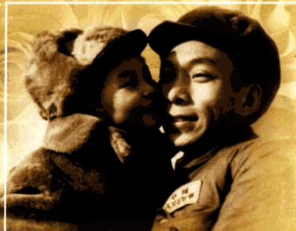
童年方工与父亲在朝鲜