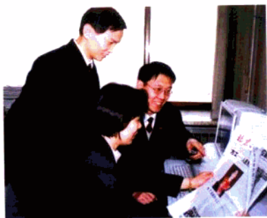
方工同志的先进事迹宣传之后， 同事们争相传颂