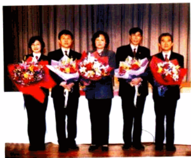
方工先进事迹报告团在全市巡回 报告，受到热烈欢迎