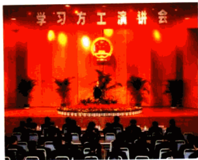
北京市人民检察院举办《方工在 我身边》演讲会