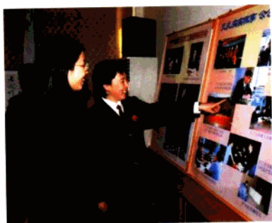
北京市检察系统学习方工同志 先进事迹现场会一角