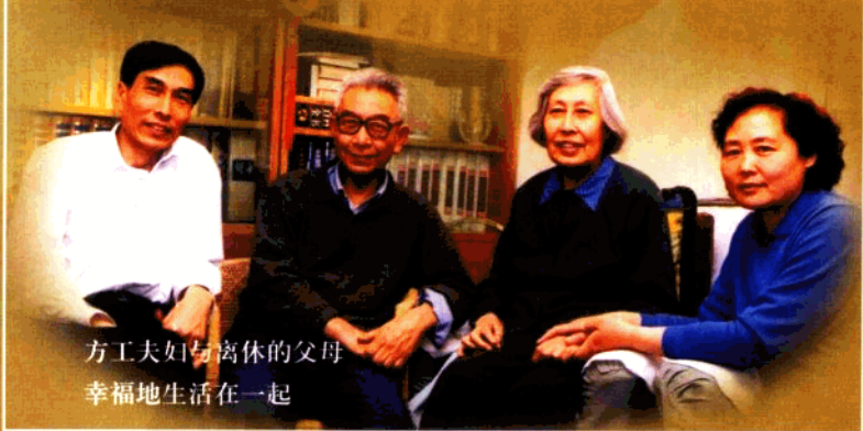
方工夫妇与离休的父母 幸福地生活在一起