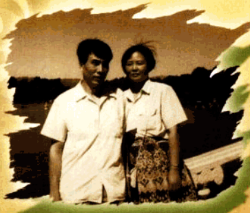
方工当工人时与爱人合影