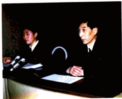
方工同志出庭支持公诉