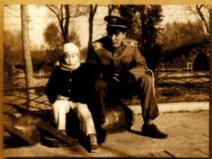
方工当检察官后与儿子合影