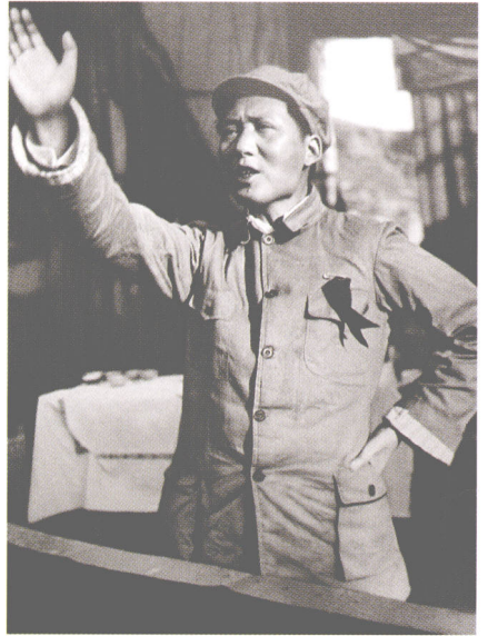
在党的六届六中全会上，毛泽东作出了“派兵去山东”的决定

按照毛泽东的指示，1939年3月，在政委罗荣桓、代师长陈光的率领下，八路军第一一五师主力挺进山东，不久进入沂蒙。在长达6年多的时间里，第一一五师在沂蒙山区纵横驰骋，英勇斗争，为中国抗日战争的胜利作出了重要贡献。