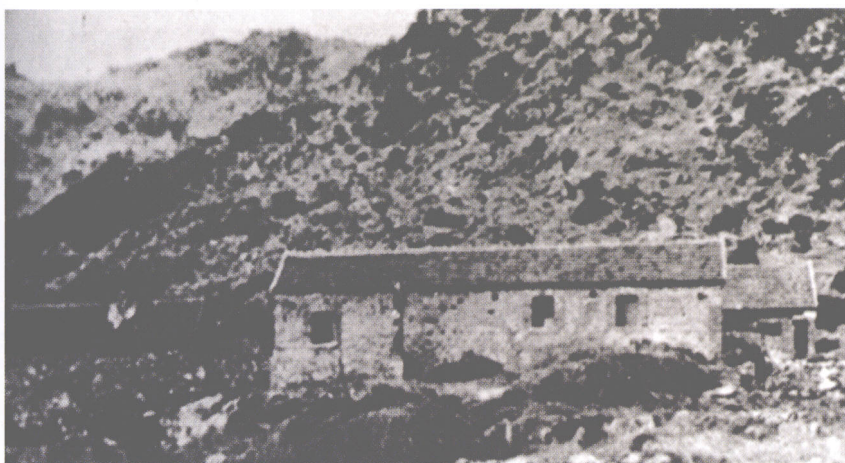
1938年1月1日，中共山东省委发动徂徕山抗日武装起义，成立了八路军山东抗日游击第四支队。图为起义旧址

省委的工作应以发动游击战争与建立游击区的根据地为中心。省委的工作中心应当放在鲁中区……努力向东发展，尤以莒县、蒙阴等广大地区为重心。