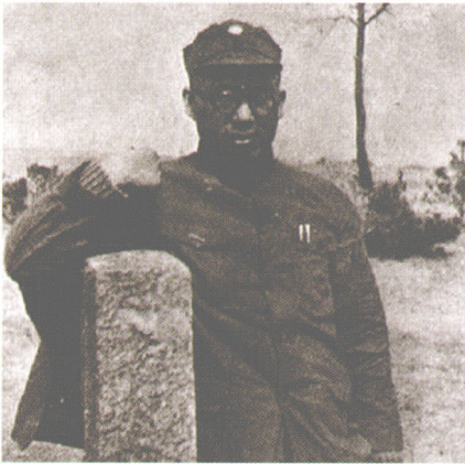
八路军第一一五师政委罗荣桓