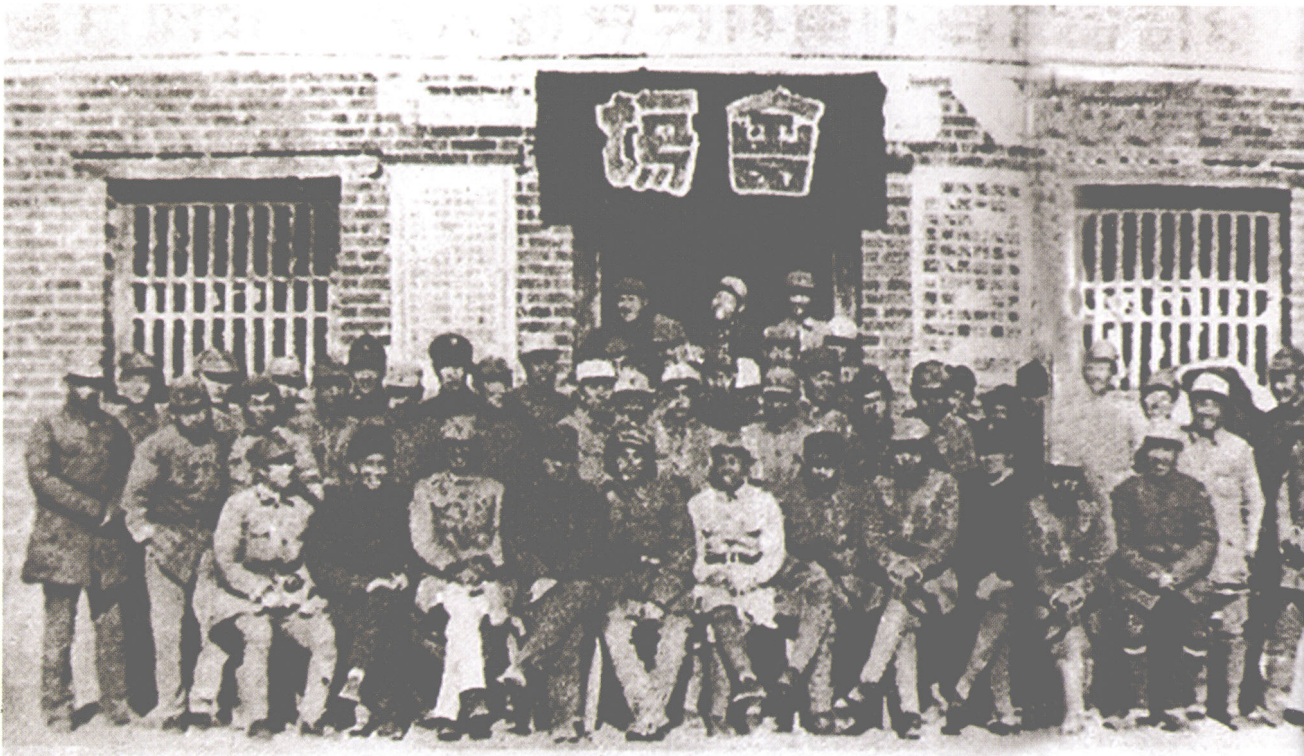
1938年12月，八路军第一一五师挺进山东前，八路军总司令朱德亲临部队召开会议，这是会后与干部战士合影