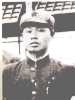
八路军山东抗日游击第四支队支队长洪涛