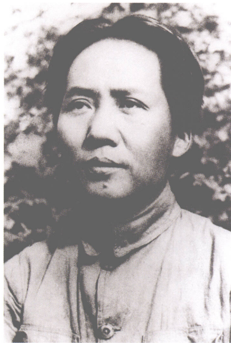
抗战时期毛泽东同志在延安

沂蒙山区是连结华北和华中的纽带，与晋察冀和晋冀鲁豫根据地呈鼎足之势，战略位置十分重要。1937年“七七事变”之后，日本发动全面侵华战争。在中华民族生死存亡的关键时刻，中国共产党高举爱国主义旗帜，努力促成抗日民族统一战线，领导抗日武装斗争。中共山东党组织发动抗日武装起义，组建抗日武装，点燃抗日烽火。1938年，党中央、毛泽东指示建立以沂蒙山区为中心的山东抗日根据地。八路军第一一五师主力挺进沂蒙，八路军第一纵队、山东纵队在沂蒙建立，沂蒙成为中国革命的重要战略基地之一。