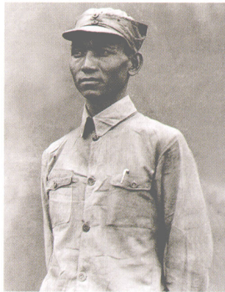
八路军第一一五师代师长陈光