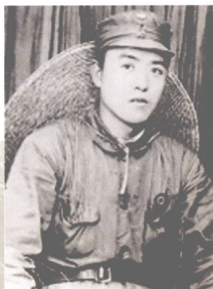
中共山东省委书记兼八路军山东抗日游击第四支队政委黎玉