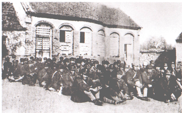
为建立山东抗日根据地，1938年5月，党中央派遣郭洪涛率领50余名干部从延安到达沂蒙，成为开辟根据地的领导骨干