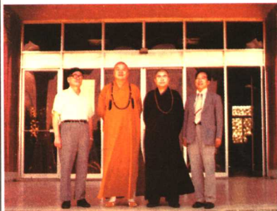
在佛光山与星云大师留影

后来，浩霖法师亲从慈航菩萨受业多年，承师衣钵，发扬弥勒菩萨的大乘精神，并且继续慈航菩萨的慈悲：无缘大慈、同体大悲，欢喜、赞叹、爱语、笑口常开，时时不忘将欢喜给人。他胖乎乎的形象，犹似寺院山门口接引众生的弥勒菩萨。巧的是，慈航菩萨师承近代佛学泰斗太虚大师倡导的“人间佛教”思想，而浩霖法师也致力大乘菩萨道