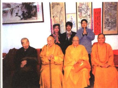
美国佛教联合会举办新春团拜后留影