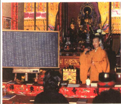
请仁峻长老讲大乘生心观经

二、法，成为念头上做人的准则，做人一贯地表现着这个准则，就迈上了佛法大路头。心量与眼光从这条大路头上，开廓察透得敞敞豁豁，待人、为人就没小家气、狭心肠。浩霖法师给人的印象：