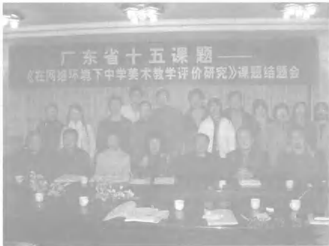
评审专家、校领导与课题组成员合影

美术教学评价体系的基础上，形成课题独特的研究特点，突破了网络互动评价实践操作中的难点。其研究成果在广东省乃至全国都具有较大的影响，对美术教学评价观有着积极的现实意义。”同时建议在此成果基础上，对现有成果进行更深入的提炼，以便推广。