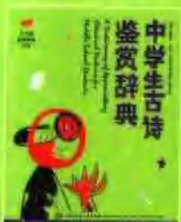
《中学生古诗鉴赏辞典》 A Dictionary of Appreciating Classical Poetries for Middle School Students