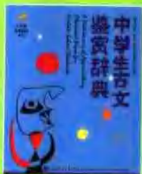
《中学生古文鉴赏辞典》 A Dictionary of Appreciating Classical Prose for Middle School Students