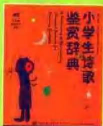
《小学生诗歌鉴赏辞典》 A Dictionary of Appreciating Classical Poetries for Primary Students